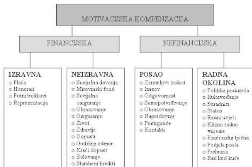
Slika 1. Motivacijska kompenzacija