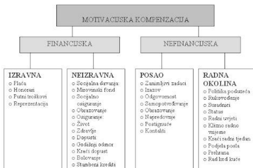
Slika 1. Motivacijska kompenzacija