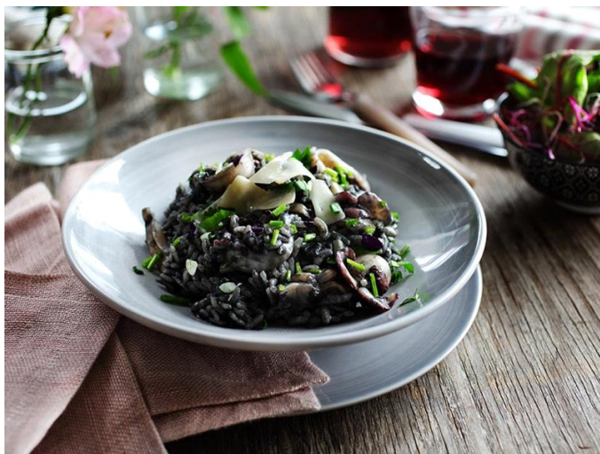
Slika 22. Rižoto od sipe

S obzirom na veliki broj raznolikih i svježih sastojaka koji su sastavni dio istarske kuhinje ne iznenađuje da je jedno od najpopularnijih jela koja se u Istri pripremaju od tih svježih i raznovrsnih sastojaka rižoto. „Rižot je istarski specijalitet. Crni mornarski rižoto, je jelo od sipe pripremljeno na luku dinstanom na maslinovom ulju, češnjaku te sve ukuhano u riži, parmezanu i žlici vrhnja“ (IstraSun.com, 2021.).