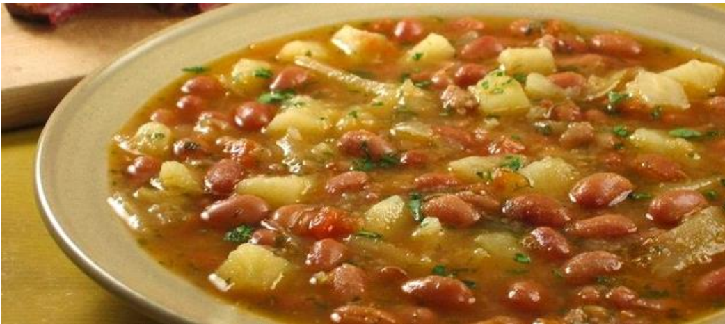
Slika 21. Istarska maneštra

Najpoznatije tradicionalno istarsko jelo na žlicu je istarska maneštra (Slika 21.). „Osnovu svake istarske maneštre čine kuhani krumpir i grah, kojima se, osim suhog mesa, dodaje i nešto od sezonskog povrća, po čemu će se tako pripravljena maneštra i zvati: maneštra od bobiči - od mladog kukuruza, maneštra od jačmika - od ječma, maneštra od slanica - slanutka, maneštra od koromača... Kada se za pripravu maneštre koristi kiseli kupus ili kisela repa, tada govorimo o joti, tipičnom zimskom pijatu. Posebna karakteristika istarskih maneštri je začinjavanje "peštom". Pešt se priprema tako da se zajedno dobro "iskoše" panceta (suha slanina), češnjak i list peršina te se tako pripremljena pastasta masa doda u maneštru na samom početku kuhanja da bi se slanina dobro raskuhala“ (istra.hr, 2021.)