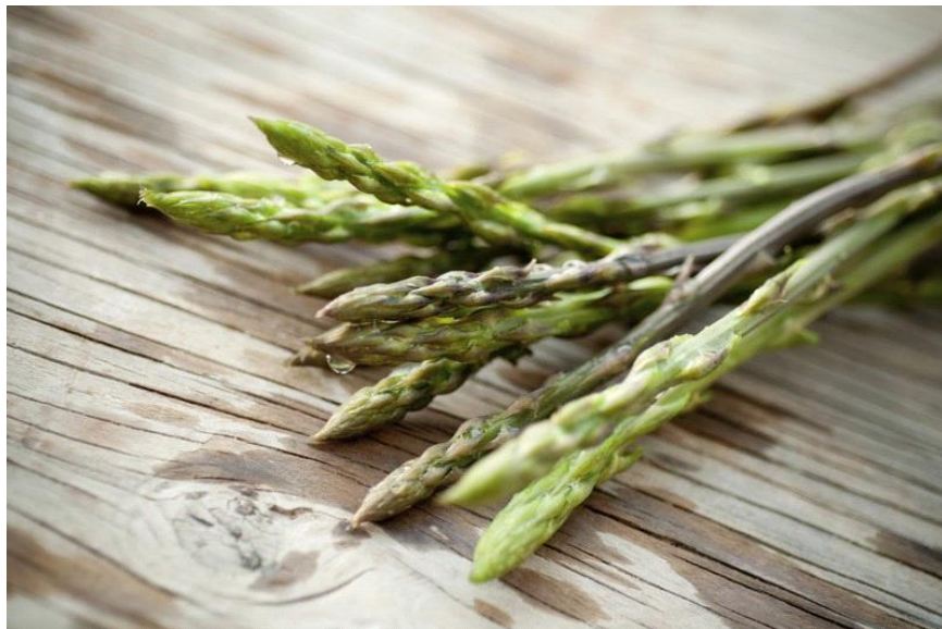
Slika 20. Divlje istarske šparoge

Istra je, osim po maslinama i vinovoj lozi, poznata i po velikom broju samoniklog bilja koje se može pronaći u šumama, brdima i livadama raspoređenim diljem Istre. Najčešće se mogu vidjeti i pronaći za konzumaciju šparoge, koprive i komorač. Samoniklo bilje se zbog intenzivnog okusa upotrebljava samo u određenim situacijama, a šparoge se često koriste u raznim jelima. „Divlja šparoga ima počasno mjesto na istarskoj trpezi - vitka i tamna, ona je simbol vitalnosti, zdravlja i užitka za nepce te će u svaku kuhinju unijeti dašak primorskog življenja. U proljeće divlja šparoga u izobilju raste po šumarcima i livadama uz širi obalni pojas Istre. Berači tada revno pretražuju žbunje u potrazi za mladim izdancima koje potom na jednostavan način pripremaju u fritaji, najpoznatijoj bazi za šparogu“ (istra.hr).