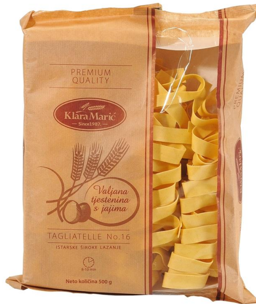
Slika 17. Istarska tjestenina - lazanje