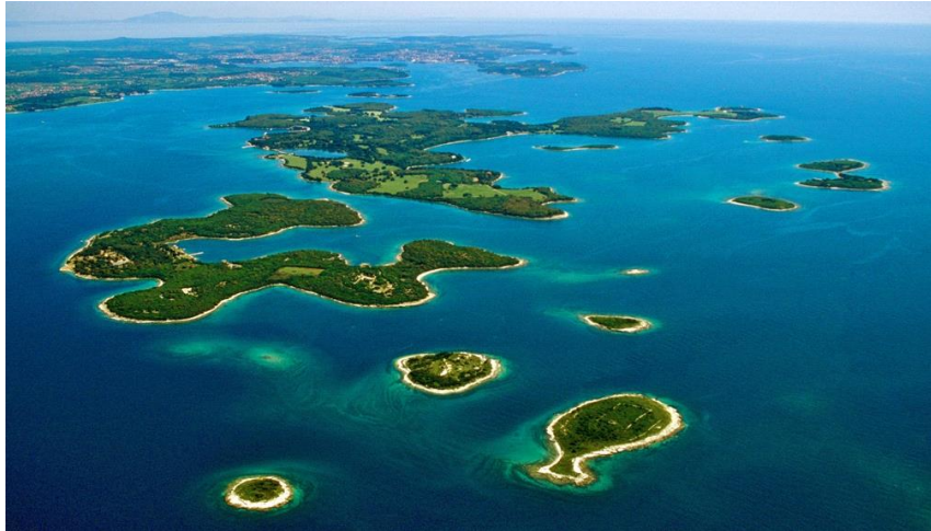
Slika 10. Nacionalni park Brijuni

Nadalje, jedno od mjesta koje se obavezno mora posjetiti u Istarskoj županiji su Brijuni. „Istra je doista terra magica. Obdarena je djevičanski netaknutom prirodom koju kruni nadaleko slavno otočje Brijuni — jedan od najljepših arhipelaga Mediterana s rijetkim biljnim i životinjskim vrstama“ (Hrvatska turistička zajednica, 2019.).