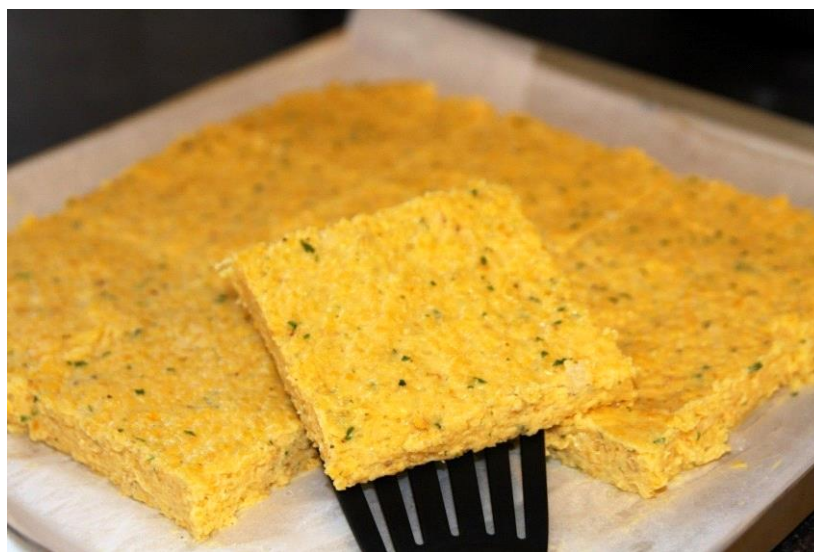
Slika 19. Istarska palenta sa šparogama

„U gastronomiji Istre palenta ima statusni simbol koji se vezuje za mlijeko, vino, povrće, ribu i meso. Najkvalitetnije i najsloženije morsko jelo, brodet, jede se s palentom. Najbolji gulaši od divljači jedu se s palentom...“ (istra.hr, 2021.).