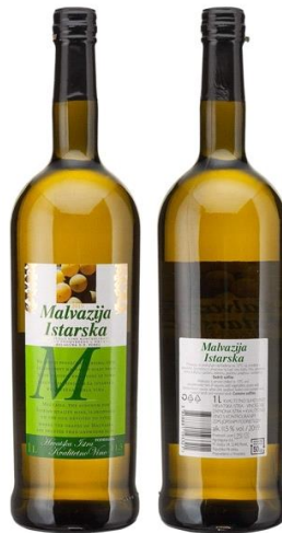
Slika 13. Malvazija Istarska

„Istarska vina imaju poseban okus zbog prirodnih posebnosti ove regije - vrste tla, reljefa i specifične klime nastale na mjestu gdje se susreću alpski i mediteranski zrak“ (istra.hr, 2021.).