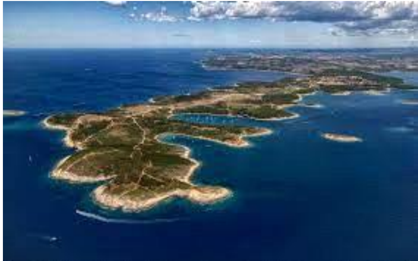
Slika 11. Rt Kamenjak