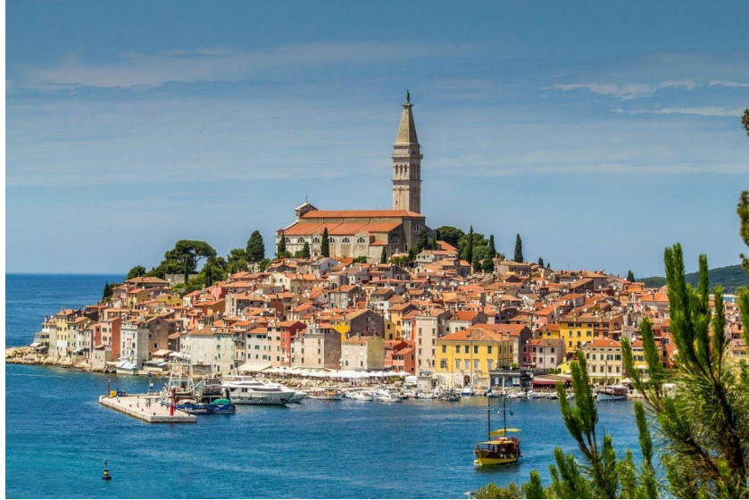
Slika 8. Rovinj