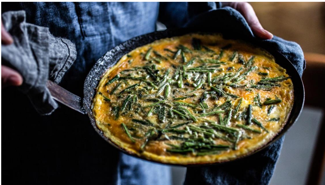
Slika 23. Istarska fritaja sa šparogama