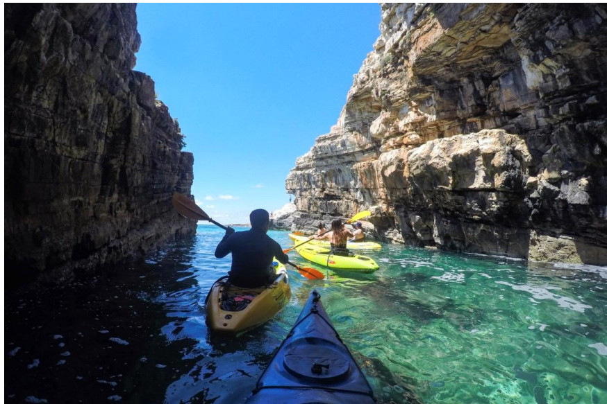
Slika 12. Donji Kamenjak – kajaci

Kamenjak (Slika 11.) najjužniji je rt istarskog poluotoka. Nalazi se u blizini Pule i Medulina. Pogodan je za cjelodnevni izlet, a u najpoznatiji je po tome što se na njemu može rekreirati u sklopu sportsko rekreacijskog turizma.