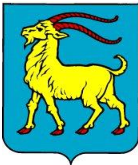
Slika 3. Grb Istarske županije

Republika Hrvatska podijeljena je na 20 županija i grad Zagreb. Jedna od županija koja već godinama iznova pokazuje znakove kontinuiranog razvoja i privlači sve više stanovnika i turista je Istarska županija. Posebnost Istarske županije leži u njenom izrazito pogodnom zemljopisnom položaju, ugodnoj klimi tijekom cijele godine, brojnim kulturnim znamenitostima i razvijenim vrstama turizma.