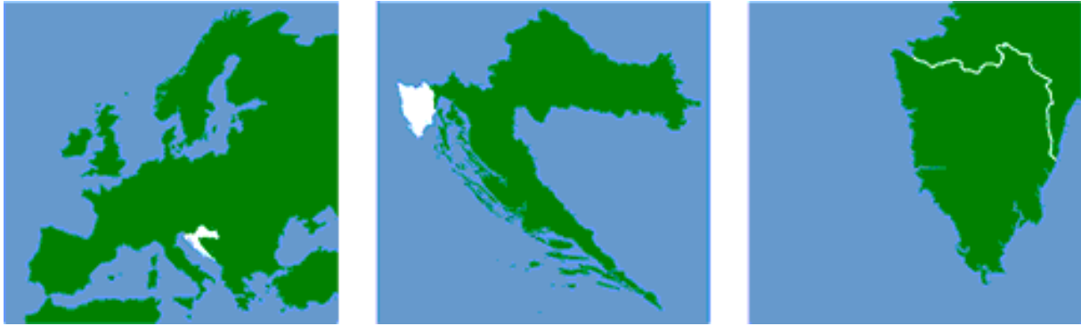
Slika 5. Istarska županija - geografski položaj