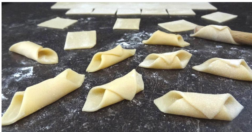
Slika 18. Istarska tjestenina - fuži