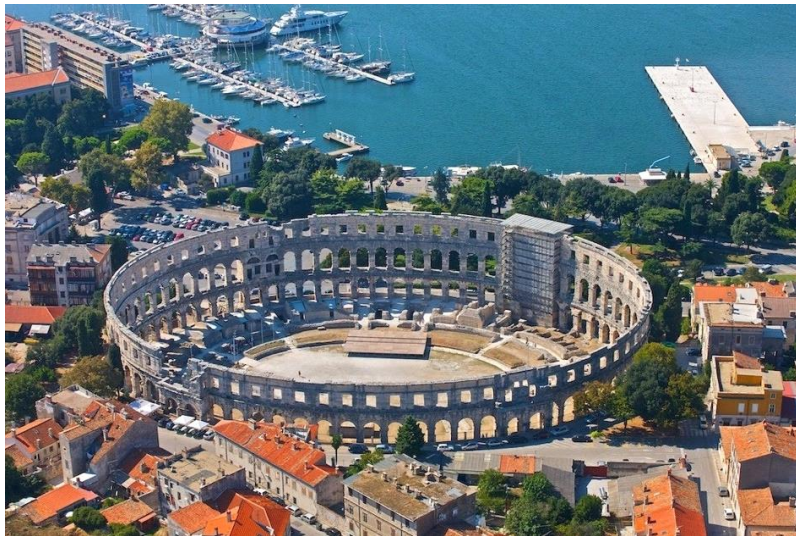
Slika 9. Pulska arena

Pula je među većim i poznatijim gradovima u južnoj Istri. Najveći pulski spomenik je Pulska arena (Slika 9.) koja je u prošlosti služila kao borilište za gladijatore, a danas je svjetski poznata koncertna i festivalska pozornica.