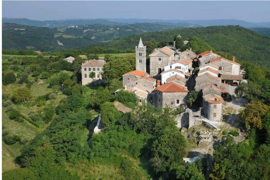
Slika 7. Hum - najmanji grad na svijetu

Istra je prepuna povijesnih priča, povijesnih građevina i malih gradića u kojima su se tijekom godina izmijenile mnogobrojne civilizacije. Na primjer, najmanji grad na svijetu, Hum (Slika 7.), smješten je u Istri.