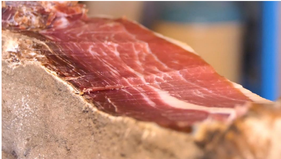
Slika 16. Istarski pršut

Jedan od simbola istarske kuhinje je istarski pršut (Slika 16.). U prošlosti je pršut bio hrana za imućne osobe i hrana koja se posluživala na proslavama. Rijetko se konzumirao u svakodnevnom životu običnih građana. Danas je pršut delikatesa u kojoj uživaju svi.