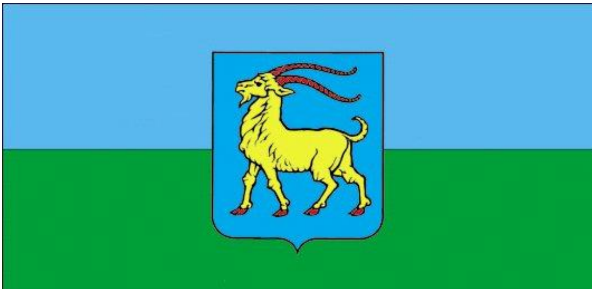
Slika 4. Zastava Istarske županije