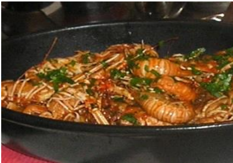
Slika 15. Škampi na buzaru

Morski specijaliteti nalaze se gotovo na svim jelovnicima u Istri. Morski plodovi koji se najčešće pripremaju u Istri su: škampi, kamenice, lignje i srdele.