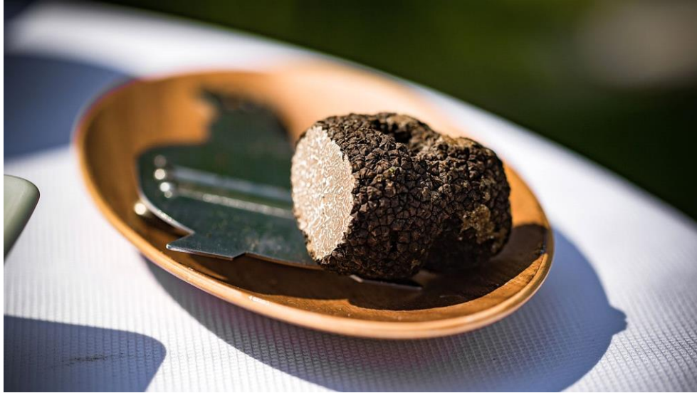
Slika 14. Bijeli tartuf