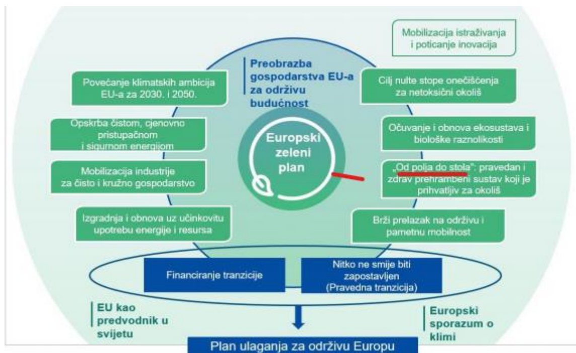
Slika 1. Elementi europskog zelenog plana

Novе mjere samo po sebi nisu dovoljne da se postignu ciljevi Europskog zelenog plana. Komisija mora pokrenuti nove inicijative i surađivati s državama članicama kako bi pojačala nastojanja Europske Unije da se važeće zakonodavstvo i politike koje se odnose na zeleni plan provedbe i djelotvorno primjenjuju.