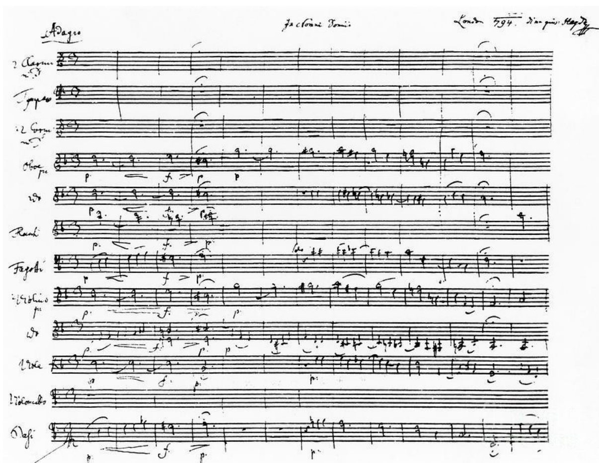
Slika :Prikaz rukopisa instrumentalne partiture