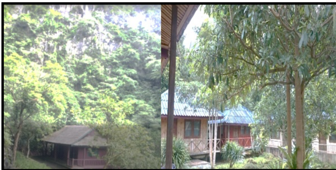
Slika 7.: Laos

optimalne ravnoteže, a svi dionici bi trebali imati koristi od razvoja turizma. Lokalno stanovništvo trebalo bi se i dodatno educirati, kako bi bilo svjesno prednosti od kvalitetno implementiranih pro – poor strategija. Istraživanja su pokazala kako je lokalno stanovništvo uglavnom svjesno prednosti koje donosi turizam. Međutim, ukoliko stanovništvo nije upozoreno na loše posljedice od razvoja turizma, može doći do antagonizma prema turizmu i turistima.