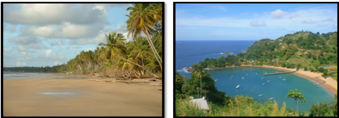
Slika 1.: Trinidad (Mayaro Beach); Tobago (Parlatuvier Bay)

Za prvi primjer dobre prakse navodi se Republika Trinidad i Tobago (Slika 1.), koja se nalazi na jugu Karipskog mora, u blizini Venezuele. Trinidad i Tobago obiluju naftom, te pripadaju razvijenim zemljama u karipskom području. Imaju stabilan politički i ekonomski sustav s visokom stopom rasta BDP-a.