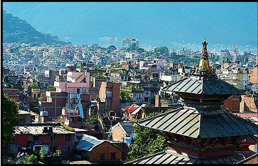
Slika 3.: Nepal

predstavljaju higijenski uvjeti koji dovode do raznih epidemija, zaraznih bolesti i gladovanja masa.