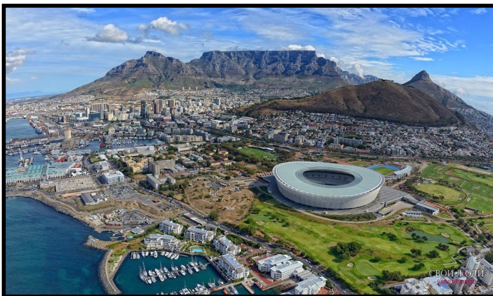
Slika 4.: Južnoafrička Republika

Sljedeći primjer se odnosi na Južnoafričku Republiku (Slika 4.), koja ima oko 50 milijuna stanovnika stopu siromaštva od oko 30 %. Ondje je provedeno najviše projekata pro – poor turizma.