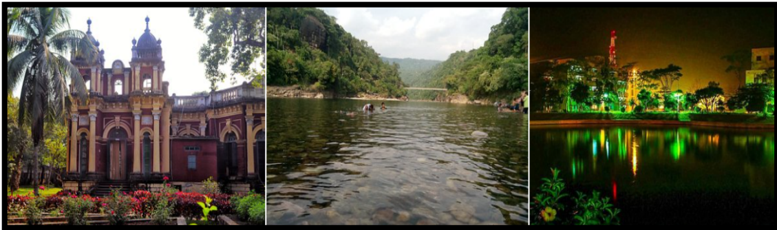
Slika 2.: Bangladeš

siromaštva na navedenom području. Izgradilo se oko 450 hotela i ostalih objekata namijenjenih turizmu na 121 km dugačkoj plaži, a koja se smatra najdužom na svijetu. 51 Uz to, izgradnja adekvatne infrastrukture za restorane i hotele, prometnica i komunikacijskih veza, kvalitetne vodovodne mreže, obrazovnih i medicinskih objekata, objekata javne sigurnosti, značajno su doprinijeli siromašnom lokalnom stanovništvu. Mnogi ljudi su u turizmu pronašli posao turističkih vodiča, prodavača rukotvorina i poljoprivrednih proizvoda, kao fotografi i sl. Rasli su i zanati.