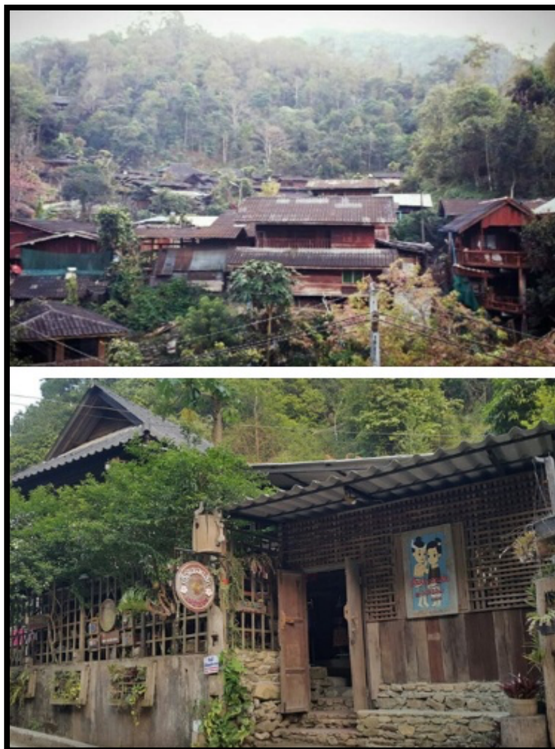
Slika 6.: Selo Mae Kampong na Tajlandu

lokalna zajednica, već samo povlašćena manjina, što je vrlo negativan primjer pro – poor turizma.