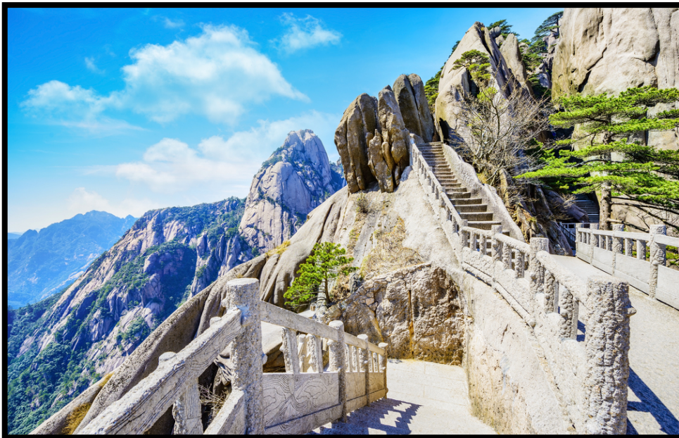
Slika 9.: Turistička infrastruktura u planinama

Ulaganjem u turističku infrastrukturu, te u promociju planinskih područja razvijen je turizam, koji je utjecao na porast životnog standarda lokalnog stanovništva. Unatoč mnogobrojnim problemima, u praksi je ipak moguće riješiti probleme nedostupnosti, i nerazvijenosti turizma, te na takav način pridonijeti lokalnom stanovništvu u smanjenju siromaštva. Destinacijski nedostaci ponekad se mogu iskoristiti kao prednost, pri čemu se, primjerice topografske različitosti, klima, bioraznolikost i kultura lokalnog stanovništva formiraju kao faktori privlačenja turista u destinaciju.