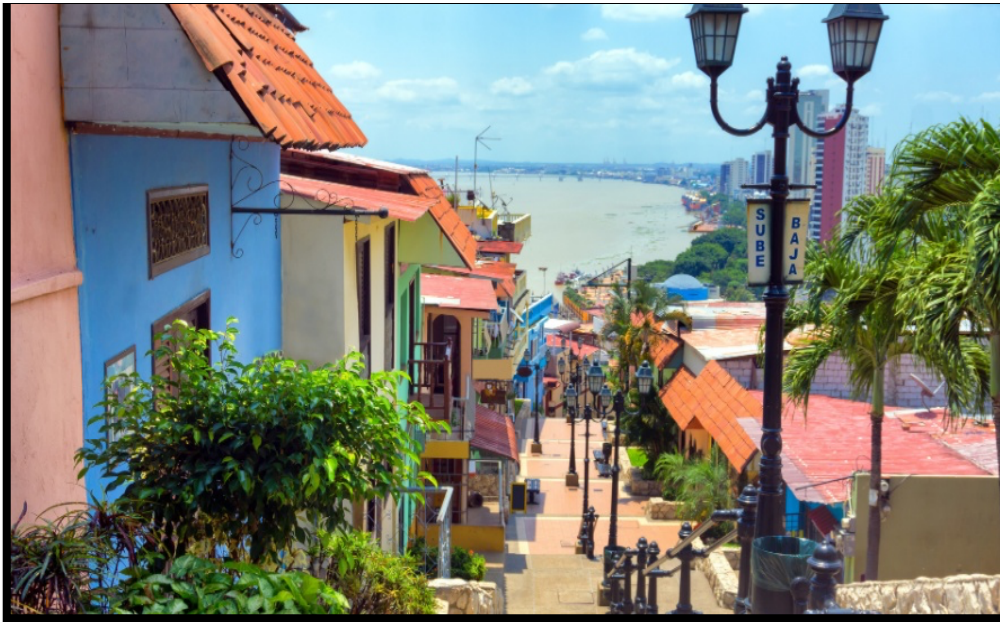
Slika 5.: Ekvador