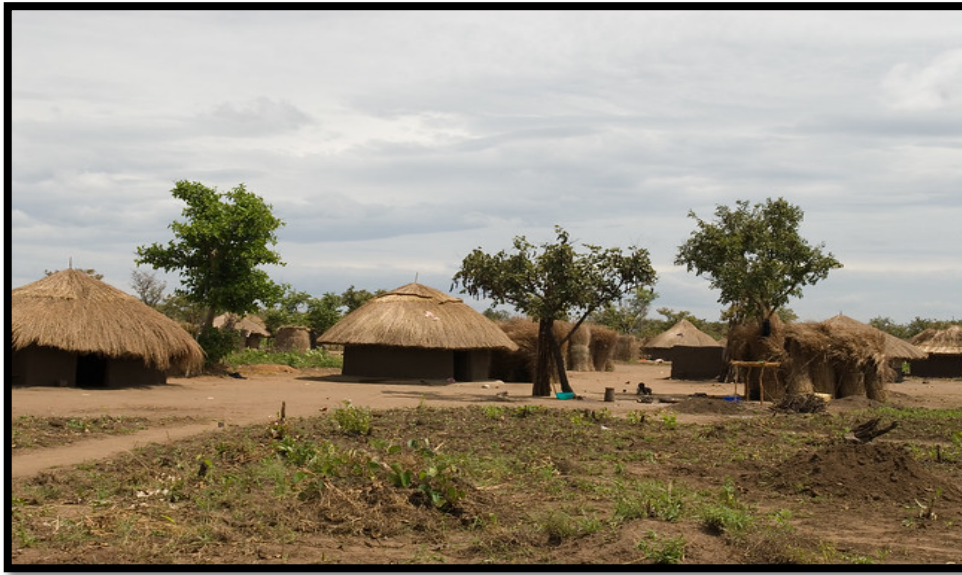
Slika 8.: Selo Bergville u Južnoj Africi