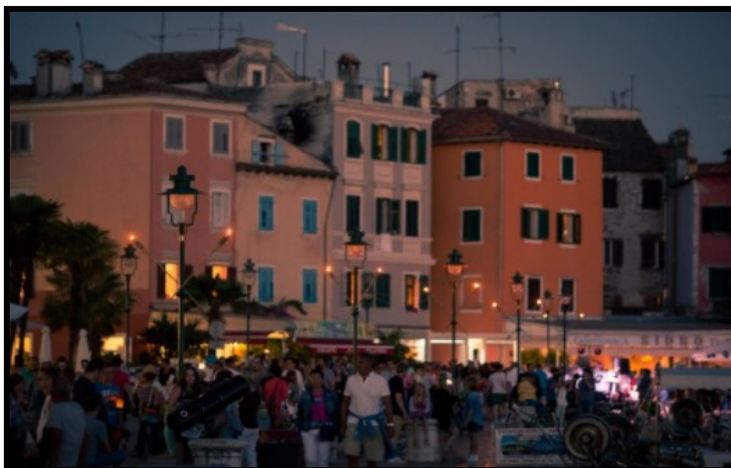
Slika 10.: Noć sv. Lovre – Rovinj

Noć sv. Lovre (Slika 10.) je manifestacija koja naglašava ambijentalnost grada Rovinja, odnosno njegovu romantičnost, a odvija se 8. kolovoza, svake godine. „Karakteriziraju ju brojni koncerti romantične glazbe na različitim pozornicama u gradu. Za tu se priliku gasi javna gradska rasvjeta, te je grad osvijetljen bakljama. Manifestaciju najavljuju plesom kroz grad članice plesnog kluba Roxanne.“ 70 Svjetla se gase, a pale se baklje, da bi se bolje vidjele zvijezde padalice koje padaju u danima kada se festival održava, a nazivaju se „suzama svetog Lovre“. U gostitelji na terasama pale svijeće, s ciljem pojačavanja ambijentalnosti, a ulicama prolaze plesači u pratnji svirača.