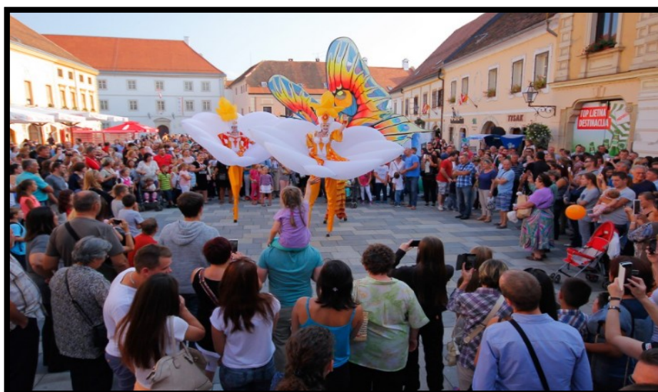
Slika 4.: Špancirfest – ulični program

Špancirfest se odvija u Varaždinu (Slika 4.), te je također poznat po privlačenju velikog broja ljudi iz svih krajeva Europe. Odvija se od 20. – 29. kolovoza, te je poznat po uličnim zabavnim programima, programima za djecu, programima izlagača rukotvorina, te po gastro i vinskim programima.