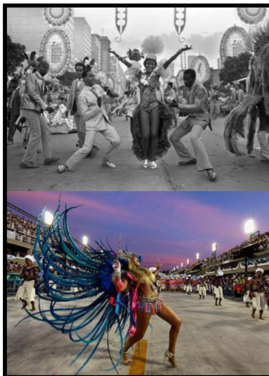
Slika 2.: Karneval u Brazilu, u Rio de Janeiru