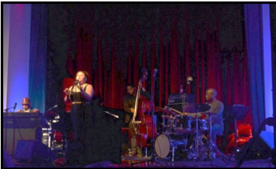
Slika 7.: Jazz festival u Rovinju

Rovinj Jazz Festival je glazbeni festival (Slika 7.), koji se u Rovinju odvija svake godine, od svibnja do srpnja, u okviru AvantgardeJazz Festivala. Namijenjen je ljubiteljima jazz glazbe, ali i drugoj publici.