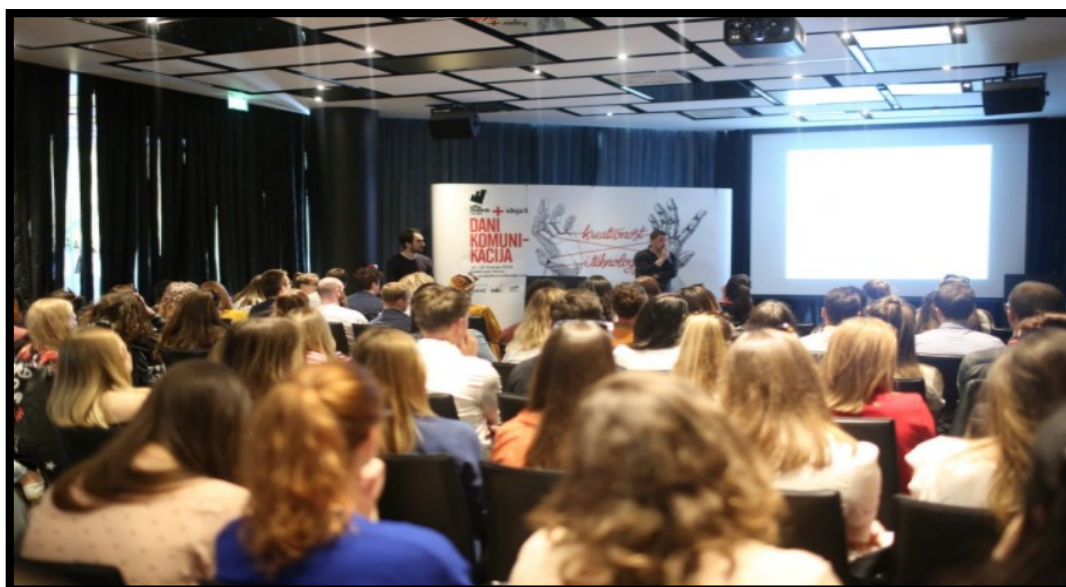
Slika 8.: Festival Dani komunikacija u Rovinju: hotel Lone

Festival Dani komunikacija (Slika 8.) je festival koji traje tri dana, tijekom ožujka, te okuplja ljude iz poslovne industrije, odnosno eksperte marketinške komunikacijske industrije, koji posjetiteljima prenose znanja i vještine za rješavanje poslovnih problema. U okviru programa izvode se i natjecanja, te edukativni i zabavni programi. 69 Festival se odvija u hotelu Lone, u njegovim dvoranama, a organizator je poduzeće HURA g.i.u.