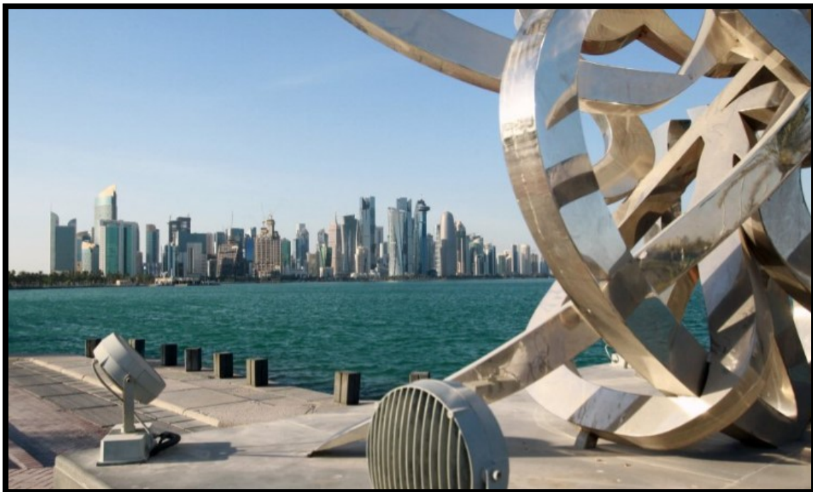
Slika 1.: Katar (Doha)

Svake četiri godine za Svjetsko nogometno prvenstvo odabire se druga država. Godine 2014. odvijalo se u Brazilu, 2018. godine u Rusiji, dok je za 2022. godinu odabran Katar (na 8 stadiona oko Dohe navijači će moći pratiti utakmice, te se brzo transferirati s jednog mjesta na drugo), a za 2026. Meksiko, SAD i Kanada. Katar (Slika 1.) je država Bliskog istoka, smještena na arapskom poluotoku, na jugozapadu Azije, te je proglašena najbogatijom državom svijeta (ostvaruje prihode od nafte i prirodnog plina).