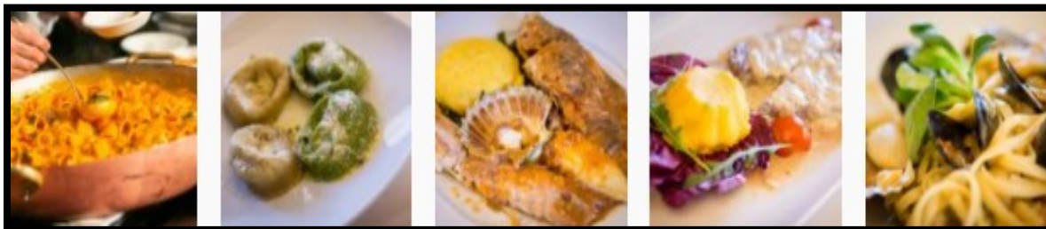
Slika 9.: Eno – gastronomska manifestacija „Putevima rovinjskih delicija“

Eno-gastronomska manifestacija „Putevima rovinjskih delicija“ (Slika 19.) održava se u najboljim rovinjskim restoranima, tijekom svibnja. Na organizaciji radi udruženje obrtnika, iz područja ugostiteljstva. Manifestacija „Putevima rovinjskih delicija“ posjetiteljima omogućava kušanje eno–gastro specijaliteta grada Rovinja i Istre.