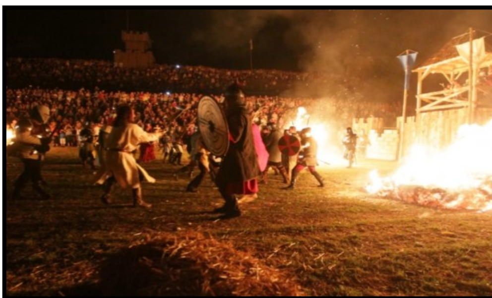
Slika 3.: Renesansni festival u Koprivnici

Renesansni festival se održava svake godine u Koprivnici (Slika 3.), te je poznat kao mega spektakl prikazivanja srednjovjekovnih povijesnih događaja i baštinskih vrijednosti Podravine. Na festivalu se odvijaju muzički, viteški i obrtnički nastupi umjetnika iz deset europskih zemalja. Festival prikazuje nekadašnje vrijeme kroz koje se stvarala Koprivnica, na veoma slikovit način.