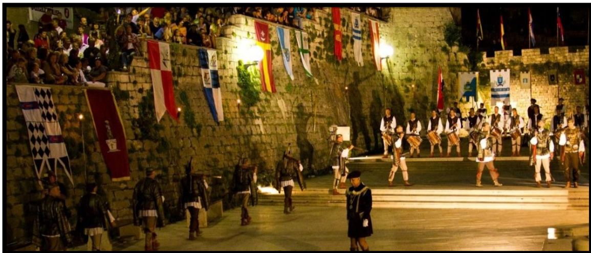
Slika 5.: Festival Rapska fjera

Festival Rapska fjera (Slika 5.) je srednjovjekovni ljetni festival, koji se održava svake godine na otoku Rabu, u gradu Rabu, od 25. – 27. srpnja. Festival je karakterističan po prikazivanju tradicije Raba, iz 14. stoljeća, u kojem je kralj Ljudevit Veliki otočno područje oslobodio od Mlečana.