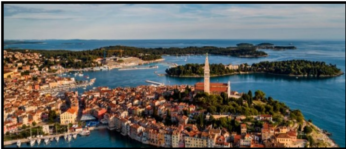
Slika 6.: Grad Rovinj

Grad Rovinj (Slika 6.) smješten je u Istarskoj županiji, na zapadnoj obali, te pripada pomorskim turističkim destinacijama. Rovinj ima dobar geografski položaj, te prometno lako dostupan ostalim europskim zemljama, ali i ostatku svijeta. Ima razvijenu cestovnu infrastrukturu, nalazi se u blizini zračne luke u Puli, zračne luke u Rijeci, kao i u blizini zračnih luka u susjednoj Italiji, u Veneciji, i Trstu. 56 Prema navedenom do Rovinja je jednostavno doći osobnim vozilima, te autobusima, zračnim prijevozom do obližnjih zračnih luka u Puli i Rijeci, a zatim od njih nastaviti putovanje cestom. Željeznički prijevoz u Rovinju nije razvijen, dok je pomorski promet razvijen te se odvija raznim brodicama i katamaranima, koji se kreću na relacijama od Venecije, Pule, Umaga, Poreča, do Rovinja.