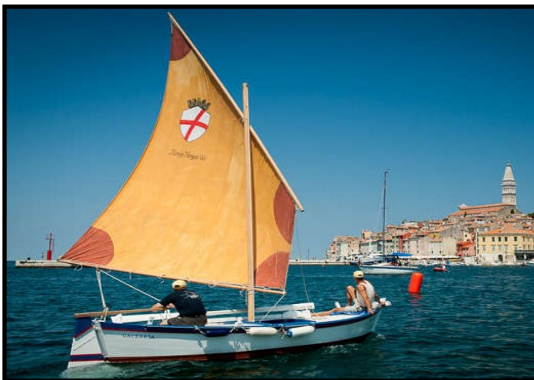
Slika 11.: Batana

gradovima. Po jednoj od teorija, ime joj navodno potječe od glagola battere (udaranje) koje asocira na zvukove batane koja upravo svojim ravnim dnom proizvodi lupanjem u valove. 72 Manifestacija „Povorka batana s feralom i večerom u spaci“ oživljava bogatu prošlost Rovinja, te utječe na jačanje suradnje među dionicima grada Rovinja: glazbenici, eko muzej, spacio Matika (spacio po rovinjskom znači konoba, pa je to još jedna posebnost, korištenja domaćih riječi u nazivu manifestacije, koje oblikuju identitet grada) uslužni objekt, koji turistima unutar događaja priprema tradicionalnu istarsku hranu, sa ribljim specijalitetima, te ukusna vina lokalne sorte malvazije i terana, maslinovo ulje, svježi kruh.