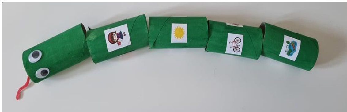
Slika 3. Pričljiva zmija