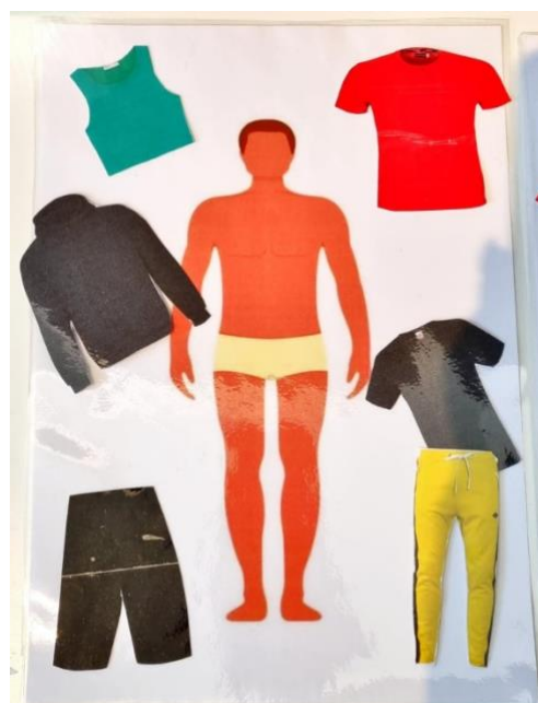
Slika 10. Izaberi i obuci