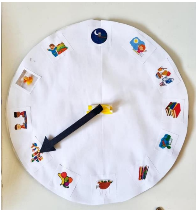
Slika 6. Vrijeme je za

Opis igre: igrači se nalaze u krugu. Na početku igre odgojitelj pokazuje kartonski sat koji sadrži 12 fotografija, baš onoliko koliko ima sati u jednome danu. Ovaj, kartonski sat ima samo jednu kazaljku. Igrač će zavrtjeti kazaljku i reći Vrijeme je za... ovisno o fotografiji na kojoj se kazaljka zaustavila. Svako dijete iz kruga jednom će zavrtjeti kazaljku sata i reći za što je njihovo vrijeme.