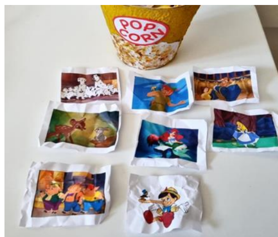
Slika 8. Filmske kokice