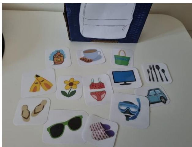
Slika 5. Idemo na more