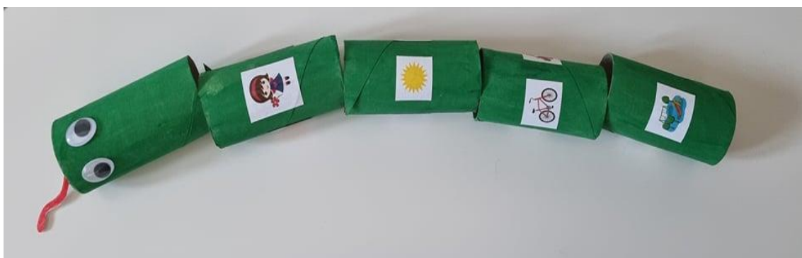
Slika 3. Pričljiva zmija