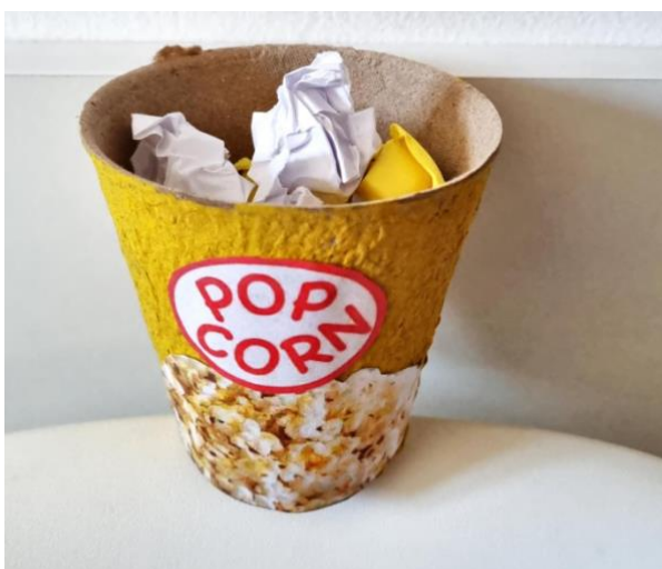
Slika 7. Filmske kokice

Igra je olakšana tako što je su velike fotografije postavljene na zid kako bi igrači mogli pratiti opise i lakše pogoditi film.