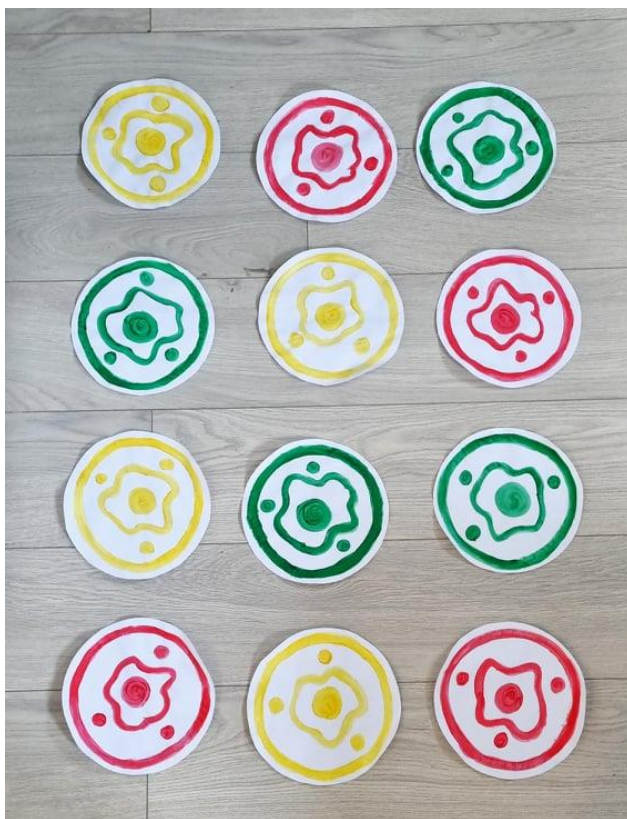
Slika 17. Kao semafor

Opis igre: na tlu se nalazi 12 krugova žute, crvene i zelene boje postavljeni u kolone. Crveni krugovi označavaju “zabranu”, zeleni “odobravanje” i žuti “premišljanje”. Djeca staju na svaki od krugova. Kada stanu na krug ovisno o njegovoj boji moraju izreći da/ne/možda . Crvena boja predstavlja izraz ne , zelena da i žuta možda .