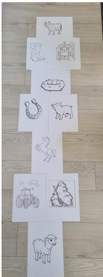
Slika 16. Skakalica

Opis igre: igra Skakalica vrlo je slična igri Školice . Na tlu se nalaze polja s različitim fotografijama. Među fotografijama nalaze se i životinjske. Kada igrač stane na polje gdje se nalazi životinjska fotografija potrebno ju je imenovati i oponašati zvuk glasanja životinje. Ukoliko igrač stane na bilo koje drugo polje potrebno je samo imenovati viđeno. Ukoliko je naziv točan igrač može ponovno bacati kamenčić do idućeg polja.