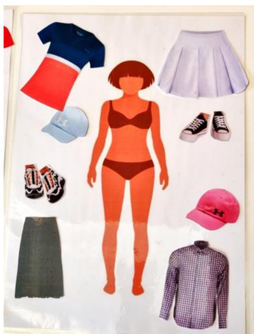
Slika 9. Izaberi i obuci

Opis igre: u igri sudjeluju dva igrača. Jedan drugome govore što žele da obuku dječaku a što djevojčici. Igrač koji ih je "oblačio" na kraju daje ocjenu za modnu kombinaciju koji je drugi igrač osmislio