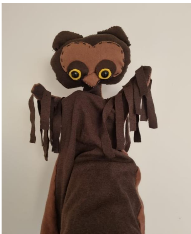
Slika 15. Ginjol lutka, sova

Opis igre: prepričati vikend uz pomoć sove. Svaki ponedjeljak nekoliko djece će ostatku grupe ispričati kako je proveo/la vikend. Prepričavanje će se odvijati na zabavan način, glumom. Svakoj priči, zajedno s odgojiteljem djeca će dati naziv.