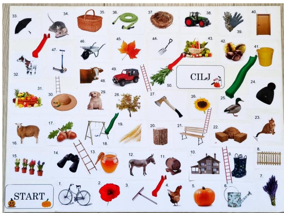
Slika 11. Gdje se krije jesen?

Opis igre: u igri može sudjelovati više igrača. Igra započinje na startnom polju, a prvi igra onaj koji dobije najveći broj bacajući kocku. Na ploči se nalazi 50 polja među kojima su i ona gdje se krije jesen. Igrači bi trebali prepoznati ta polja kao neke od vjesnika jeseni i ukoliko ih prepoznaju kada stanu na to polje dozvoljeno im je nagradno bacanje, a ukoliko ga ne prepoznaju vratit će se u nazad za isti broj koji su dobili. Među poljima nalaze se ljestve i tobogani. Kada igrač stane na polje gdje se nalaze ljestve popet će se do polja gdje ga one vode, a ukoliko je stao na polje gdje je tobogan spustit će se dolje do određenog polja. Pijuni s kojima će se igrači kretati jesu neki drugi vjesnici jeseni koji će se kretati pločom i predočiti kako jesen stiže do svojega cilja. Igra završava kada svi igrači dođu do cilja.