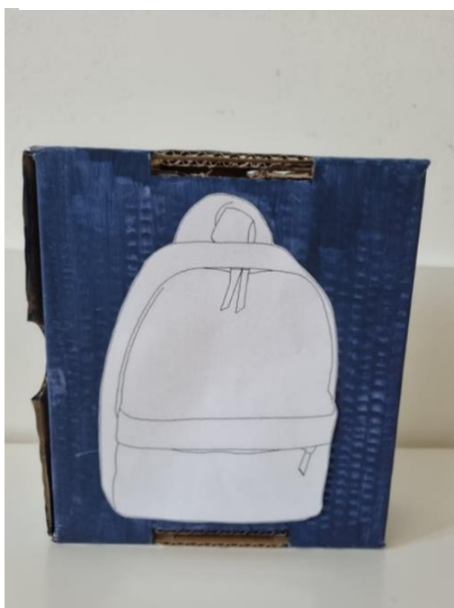
Slika 4. Idemo na more

Opis igre: potrebno je imenovati stvari koje se nose na more, a nalaze se na stolu. Imenovane stvari potrebno je ubaciti u torbu (kutiju).