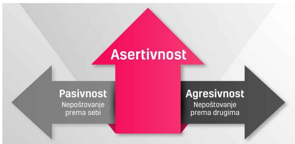
Slika 2. Stilovi komuniciranja

Elektronički izvor: URL: https://webiz.me/hub/articles/asertivna-komunikacija-svrha-zauzimanja-za-sebe/?fbclid=IwAR3EhrhBqvTwwgt33EWLWdt1DjSnpIWIVv6eYCany7PO8OWufryMRiSMug [pristupljeno 27.04.2022.]