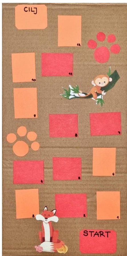
Slika 12. Životinjska potraga

Opis igre: u igri može sudjelovati više igrača. Započinje na startnom polju gdje prvi igru započinje onaj igrač koji je dobio najveći broj na kockici. Na ploči se nalaze 12 polja. Prilikom zaustavljanja na polju igrač mora izvući karticu sa zadatkom. Na karticama su fotografije životinja koje igrač treba imenovati i reći sve što zna o njima (gdje žive, što jedu, kako se kreću i slično). Nakon datog odgovora o životinji na fotografiji igra sljedeći igrač ponovnim bacanjem kockice. Pobjednik je onaj koji prvi dođe do cilja.