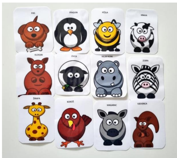
Slika 13. Životinjska potraga