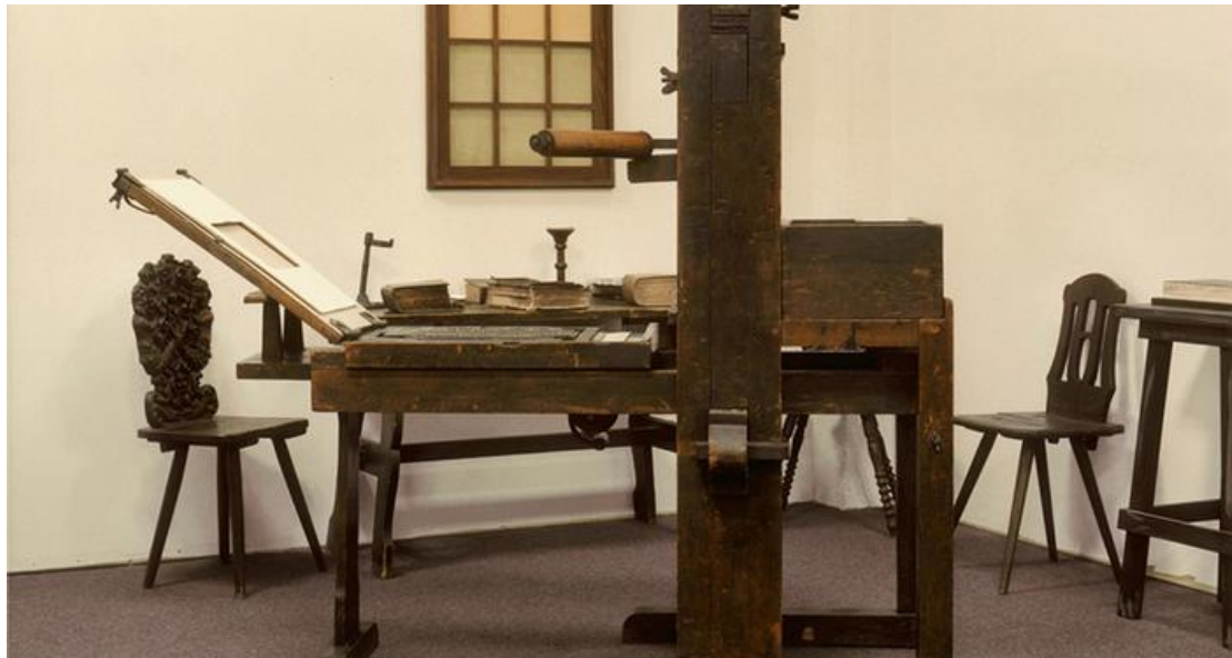
Prilog 12. Gutenbergov tisak (dostupno na: https://www.dw.com/hr/kolijevka-svjetske-pismenosti/a-15956951 )

grubljim slovima tiskao i neka manja djela: Fragmenat o sudu svijeta , Astronomski kalendar za 1448 , ali to se nije moglo dokazati. 60 Do Gutenbergova vremena samo su povlašteni mogli imati knjigu. Vrijednost knjige bila je velika, a primjer tomu je da je za rukom pisanu knjigu na pergameni trebalo izbrojati mnogo zlatnika ili se plaćala velikom količinom životinjske kože.