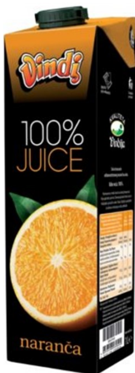
Slika 11. Vindi 100% juice naranča sok