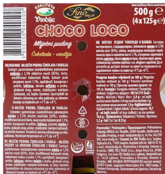
Slika 8. Označavanje Fino mi je Choco Loco mlijecnog pudinga