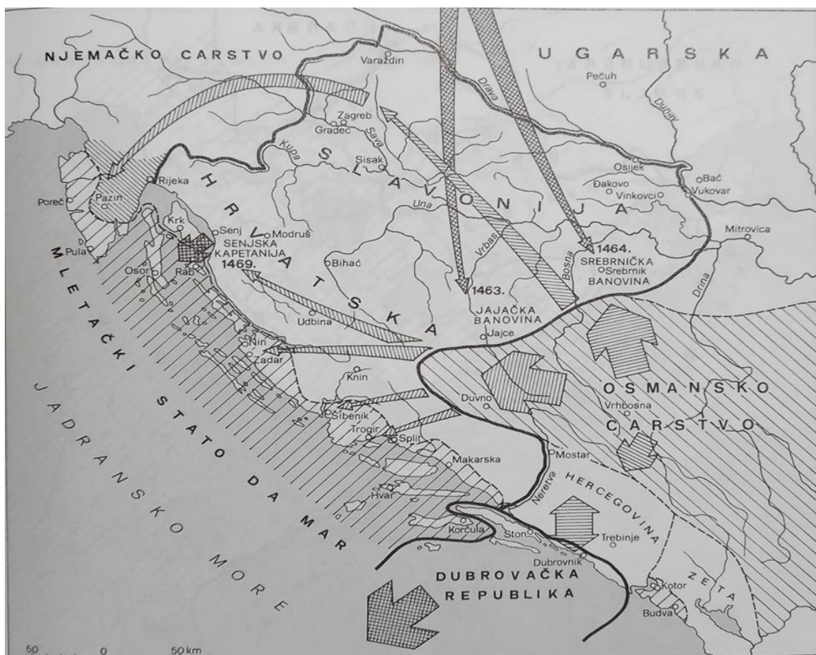
Prilog 5. Napredovanje osmanskih snaga i pljačkaški pohodi prema Hrvatskoj tijekom 2. polovice 15. st. (preuzeto iz: Budak – Raukar, Hrvatska povijest... , str. 445).