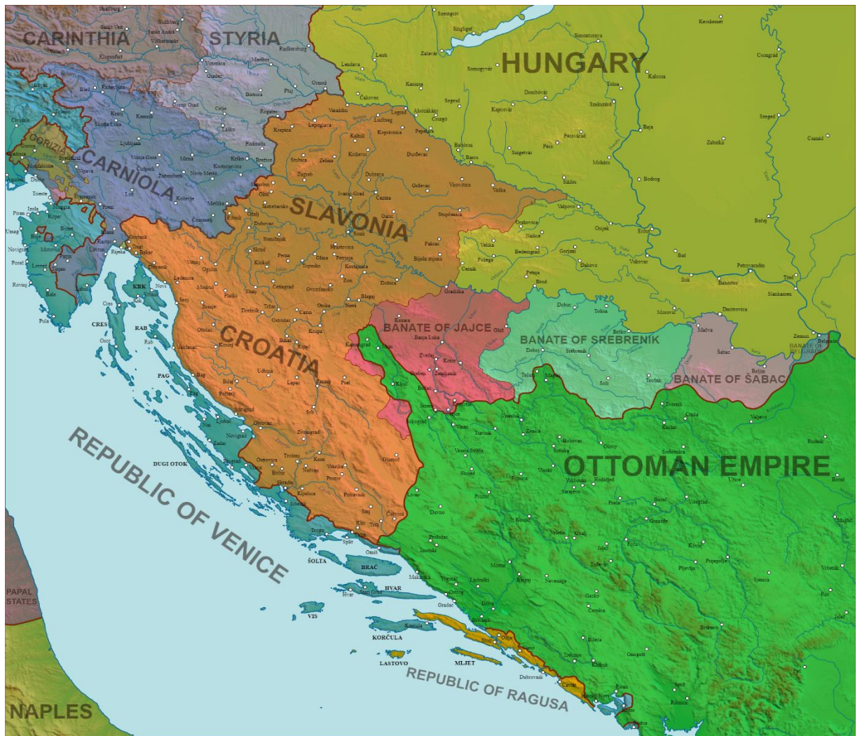
Prilog 1. Korvinov obrambeni sustav nakon pada Bosne 1463.