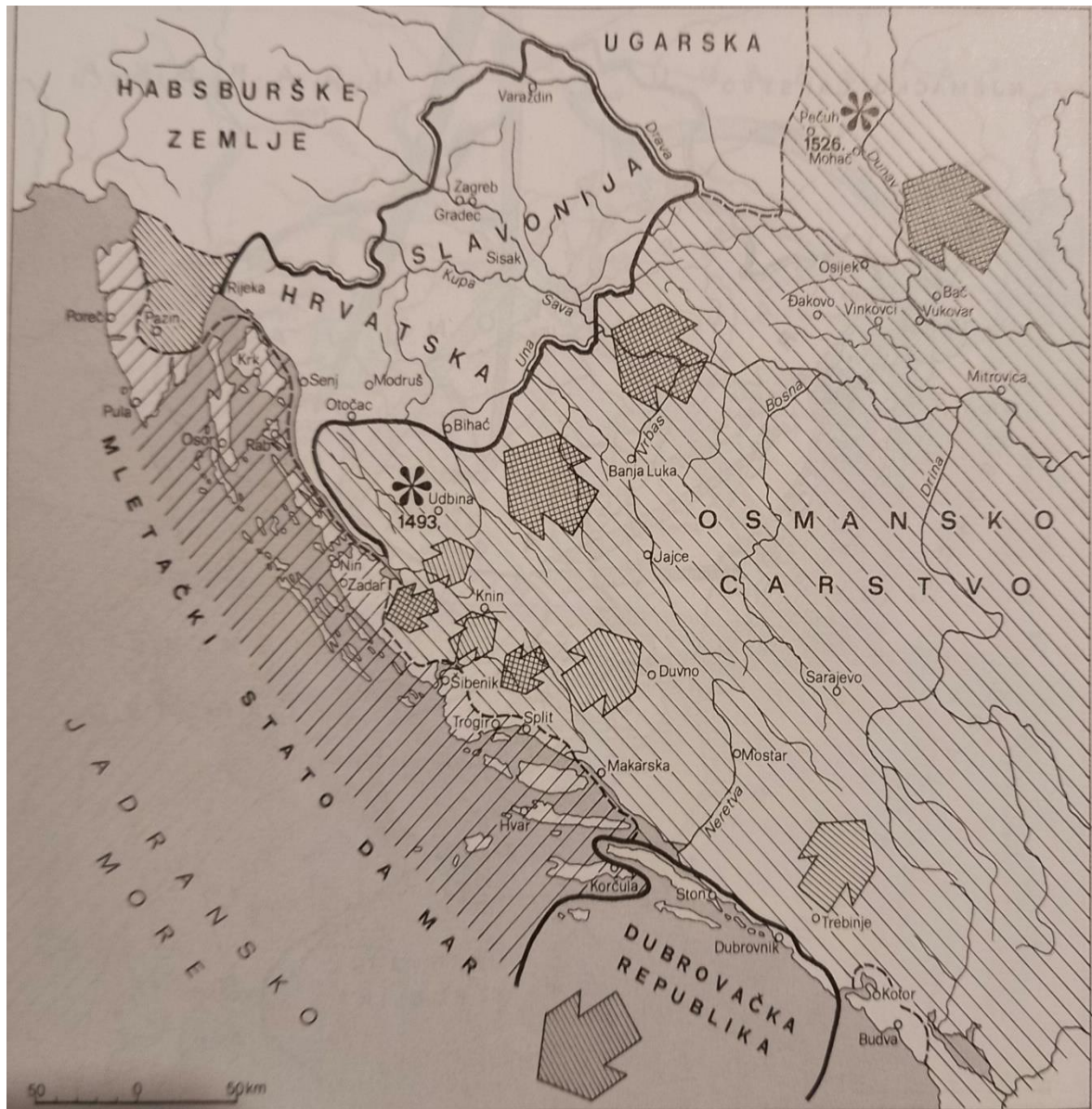
Prilog 6. Hrvatska nakon bitke na Mohačkom polju 1526.

kršćanstva ( Antemurale Christianitatis ). Knez Bernardin Frankapan je bio jedini plemić visokog ranga koji je uspio i preživjeti i izbjegnuti osmanlijsko sužanjstvo te je postao vrlo popularan i slavljen u Europi kao veliki kršćanski borac iz Hrvatske. 45