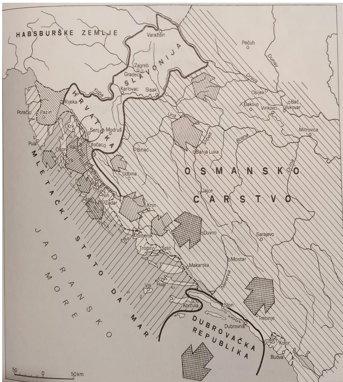
Prilog 7. Zadnja faza osmanskog osvajanja Hrvatske u drugoj polovici 16. st.