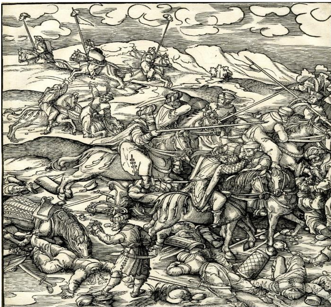
Prilog 3. Bitka na Krbavskom polju 1493. ilustracija Leonharda Becka iz 16. st.