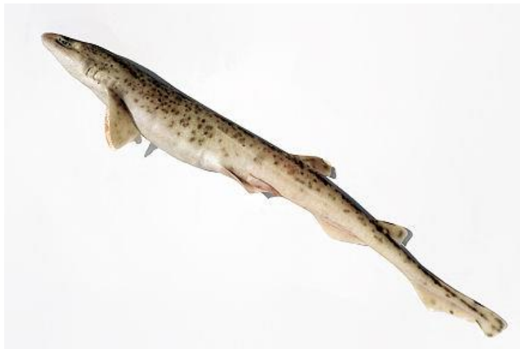
Slika15. : Mačka bljedica 15

Mrijesti se tokom cijele godine, najviše u proljeće i u zimu. „Oplodnja je unutarnja; ženka odlaže u razmacima od 1-2 tjedna po 2-20 jaja“ (Milišić, 2007.). Jaja se izvan majke razvijaju 8 do 9 mjeseci poslije čega se izlegu mladi. Dok je još mala, nakon što se tek izleže, hrani se žumanjčanom vrećicom na koju je spojena, a kad odrastu, hrane se beskralježnjacima s morskog dna i pelagijala, ponekad i manjim ribama. Pripada životnoj zajednici bentos.