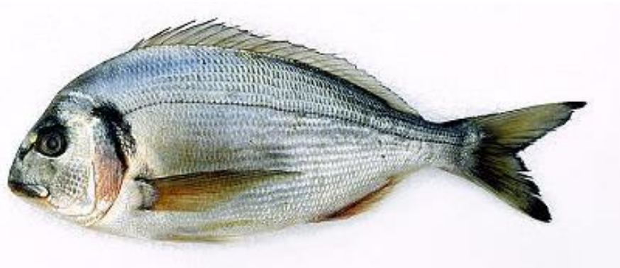
Slika 5. : Orada 5

Orada je protandrični dvospolac. Mrijesti se tijekom kasne jeseni i prve polovice zime. Pripada životnoj zajednici bentosa, a hrani se školjkama i rakovima. Osjetljiva je na hladnoću. Često stvara probleme uzgajivačima školjaka jer ako nema hrane u njenoj blizini gdje joj pogoduje temperatura, oštećuje im uzgoj. Živi u manjim jatima ili nekoliko primjerka zajedno, a za vrijeme mriještenja skuplja se u veća jata.