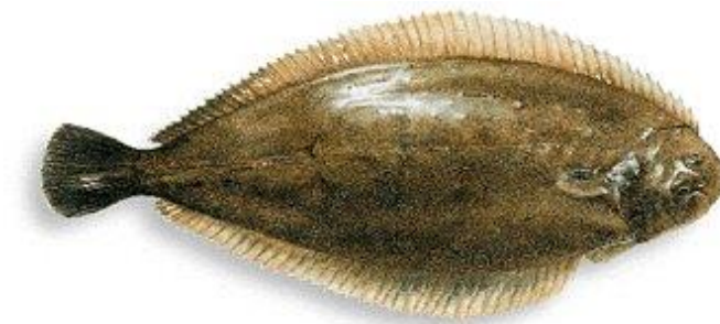
Slika 13. : List 13

List živi u jatima, ali raspršeno na morskom dnu te zato spada u životnu zajednicu bentosa. Najviše se seli noću za južnih olujnih vremena ili nakon njih. Aktivan je većinom noću, a danju se ukopava. Mrijesti se tijekom kasne jeseni i prve polovice zime kad s tri godine postigne spolnu zrelost tako što se iz obalnih krajeva seli na pučinu. Hrani se svim sitnim životinjama koje pronađe na morskom dnu. Ima dug životni vijek – od 12 do 15 godina. (Milišić, 2007.)