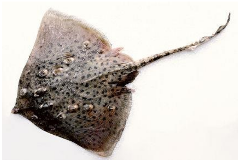
Slika 16. : Raža kamenica 16

Mrijesti se tijekom zime i proljeća u plićacima. Nakon što mužjak oplodi ženku, ona nosi 6 do 8 jaja koja na početku ljeta snese i zakvači kratkim viticama za bilje. Ona se danju ukopava u mulj, a noću lovi. Hrani se raznom ribom posebice iz obitelji plosnatica, te rakovicama i kozicama. Pripada životnoj zajednici bentosa. (Milišić, 2007.)