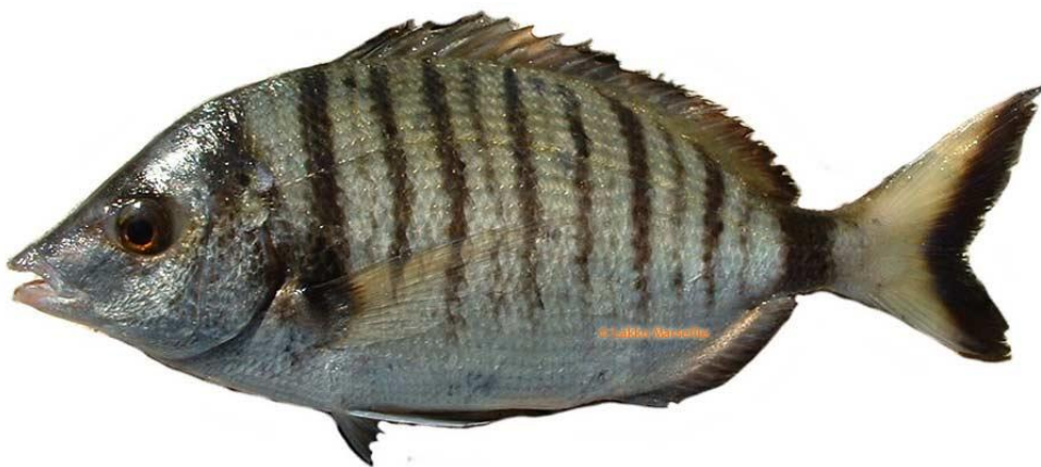
Slika 8. : Pic 8

Pic najčešće živi samačkim životom iako se ponekad skuplja u manja jata. Hrani se malim ribama, rakovima, mekušcima i algama. Ima zanimljiv način hranjenja – stane pred stijenu gdje je uočio plijen i zatim ga naglim pokretom tijela iščupa ili zgrabi. Mrijesti se u ljetnim mjesecima.