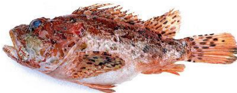
Slika 14. : Škarpina 14

Mrijesti se krajem proljeća i prvoj polovici ljeta. Prirodnom okruženju se, osim otrovnim bodljama, prilagođava i time što ima sposobnost boju prilagoditi boji okoliša u kojem se nalazi. Hrani se ribom, rakovima i mekušcima.