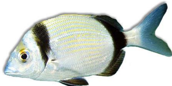
Slika 7. : Fratar 7

Ova oprezna i plaha bijela riba bira staništa s neravnim dnom uzduž kamenitih obala na granici s pješčanim dnom dok je mlada boravi u jatima, a kasnije se osamostaljuje i živi sama ili u malim skupinama. Stanovnik je životne zajednici bentosa gdje i lovi mekušce, rakove i crve. Zbog sličnih hranidbenih navika, dok je mlad, živi u jednoj vrsti mutualizma s ribama trljama – on jede ostatke njene hrane, a one nju upozoravaju na opasnost. Mrijesti se u drugoj polovini jeseni.