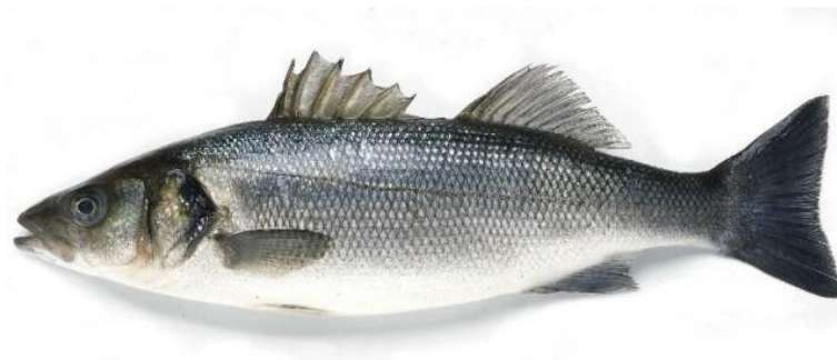
Slika 4.: Lubin 4

Ova bijela riba ne preferira dubinu i otvoreno more, ali za vrijeme mriještenja, u hladnijem dijelu godine, skuplja se u manjim jatima te odlazi na otvoreno more. Što je stariji, to je veći samotnjak, ali je veliki grabežljivac koji je u stalnoj potrazi za plijenom posebice u noćnim satima.