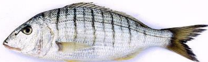
Slika 9. : Ovčica 9

Ovčica je litoralna vrsta koja je uvijek u pokretu. Najčešće živi u malim jatima iako odrasle jedinke znaju živjeti same ili u paru. Pri sezonskoj migraciji i pri mriještenju, skuplja se u velika jata. Mrijesti se tokom ljetnih mjeseci. Ona je protandrični dvospolac – mužjak kada dosegne duljinu od oko 17 centimetara postaje ženka. Hrani se organizmima koji se nalaze na morskom dnu kao što su rakovi, crvi, mekušci, alge i slično. Veoma je plašljiva pa se tokom dana skriva, a noću jede.