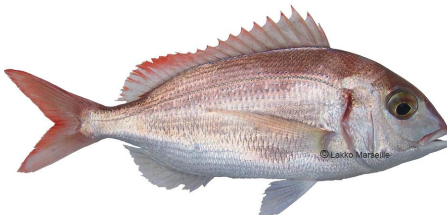
Slika 10. : Arbun 10

Ova riba živi u velikim jatima i isključivo pripada životnoj zajednici bentosa. Hrani se manjom ribom i raznim sitnim mekušcima, rakovima i crvima koje pronade na morskom dnu. Mrijesti se u travnju i svibnju. Protandrični je dvospolac – u trećoj godini mijenja spol. Njegova jaja su pelagijska. Na njegovom tijelu (glavi, leđima ili usnoj duplji) ponekad parazitira račić izopod iliti uš. (Milišić, 2007.)