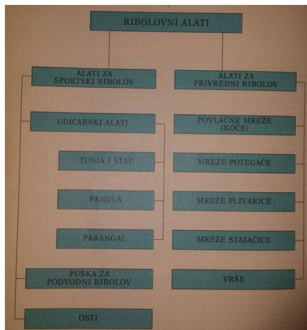
Slika 1. Podjela ribolovnih alata 1

U sljedećem poglavlju opisana je većina alata, njihovi stari i moderni oblici te način na koji se tim alatom lovi odnosno lovilo. Neki su još u funkciji, a neki su zastarjeli te postoje samo kao zapisi ili uspomene.