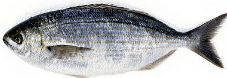
Slika 11. : Salpa 11

Salpa je veoma društvena riba koja se najčešće kreće u jatima koje se starošću smanjuju. Veći primjerci najčešće žive samostalno ili u malim grupama do 3 primjerka. Karakterističan im je život i ponašanje u jatu. Veoma usklađeno i koordinirano plivaju, a pri opasnosti svi zajedno bježe. Kopnu se približavaju kada je more umjereno valovito i mutnom te nailaskom plime jer najradije jedu one alge koje su za vrijeme oseke bile izložene suncu. Pretežno se hrani biljnom hranom iako nedorasli primjerci znaju ponekad jesti i račiće. Mrijeste se početkom jeseni. (Milišić, 2007.)