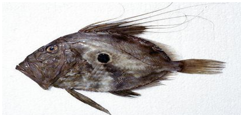
Slika 3. : Kovač 3

Rasprostranjen je diljem Jadrana, od 5 do 300 metara dubine na svim vrstama dna. Lovi se kočom, ponekad i tunjom i štapom tokom cijele godine. Najčešće živi sam ili u jako malim skupinama. „Vrlo često se ulovi slučajno, no veliko je zadovoljstvo jer je izrazito rijedak i ukusan plijen“ (Ferran, 1997.). Veoma sporo i graciozno pliva, ali je izrazit grabežljivac. Slijedi jata riba kojima se hrani dok ne pronađe priliku da lovi izbacujući prema naprijed produljenu čeljust. Bentopelagička je vrsta, boravi u zoni otvorenog mora i pri morskom dnu. Mrijesti se u proljeće tako što odlazi udubljena otvoreno more.