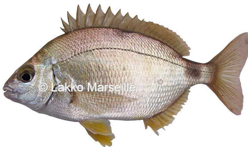
Slika 6. : Špar 6

Živi pri morskom dnu i time spada u bentonsku životnu zajednicu, a najčešće živi u manjim jatima ili grupama. Mrijesti se tokom ljetnih mjeseci, od travnja do lipnja, a nakon mriještenja ikra i ličinke slobodno plutaju po moru. Hrani se raznovrsno, najčešće beskralježnjacima .