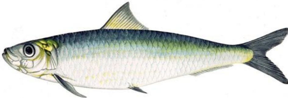
Slika 2.: Srdela 2

Srdela živi u zoni otvorenog mora i tipični je predstavnik pelagične ribe. Živi u većim ili manjim jatima. Hrani se raznim planktonskim organizmima koje traži danju. Voli se mrijesti u hladnijem dijelu godine na otvorenom moru, krajem studenog do početka ožujka (zato u to vrijeme ne traje lov na nju). Nakon mriještenja, jaja slobodno plutaju po moru kao pelagijska jaja.