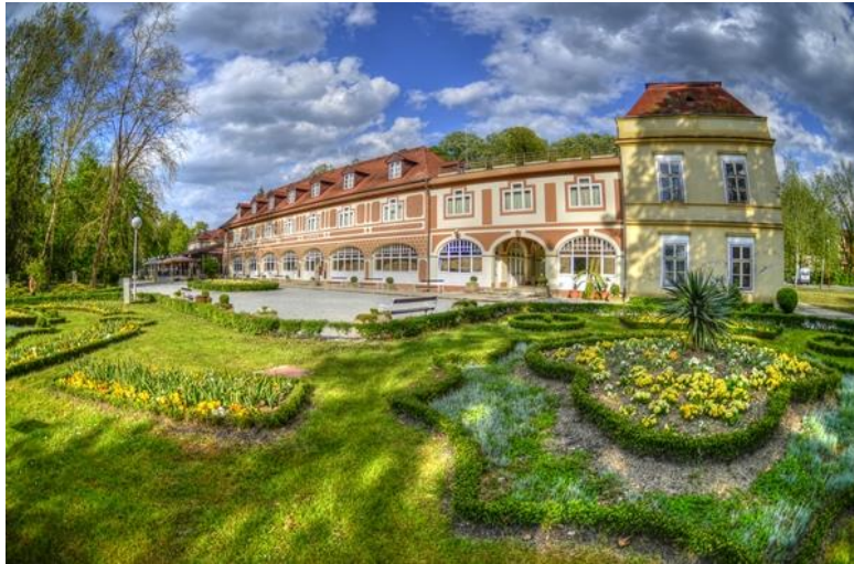
Slika 5: Vila Arcadia