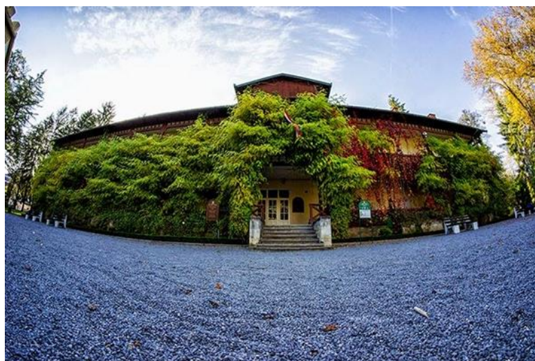
Slika 4: Švicarska vila