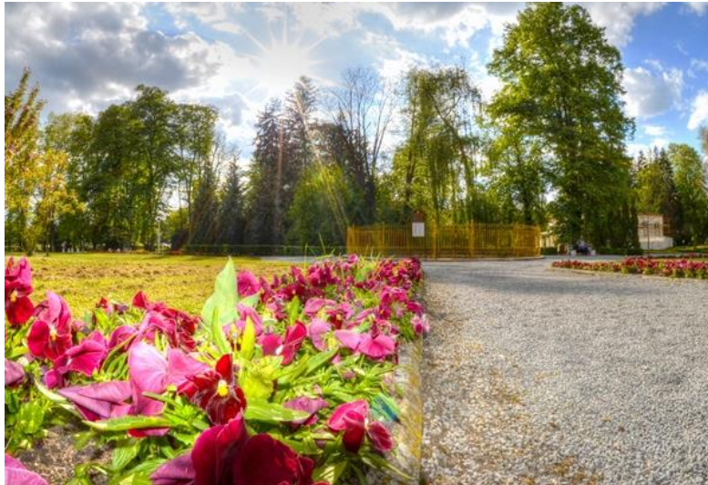
Slika 3: Ivanova kupelj