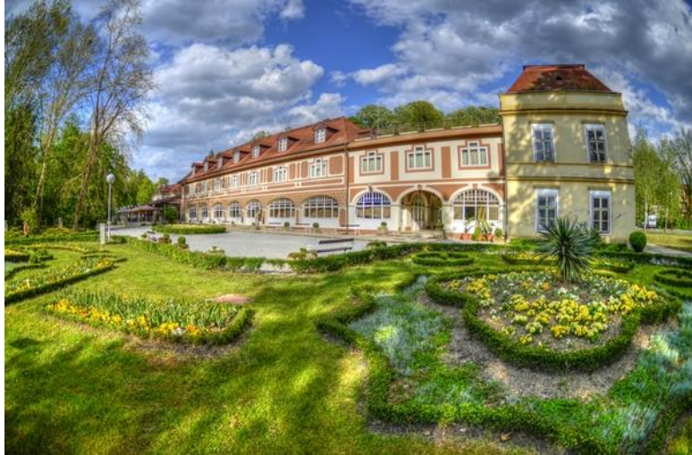
Slika 5: Vila Arcadia