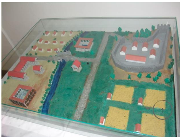
Slika 9: Slobodan prikaz makete Daruvara u doba Rimskog carstva