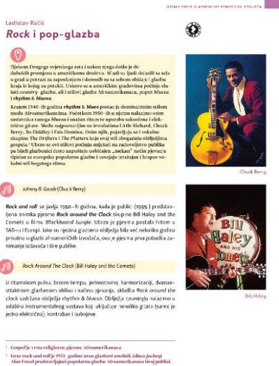
Slika br.3, Poglavlje iz udžbenika Glazbena umjetnost 4 (Školska knjiga) 16

Udžbenici za Glazbenu umjetnost (u četvrtom razredu) sadrže poglavlja posvećena popularnoj glazbi. Osim povijesnog presjeka popularne glazbe, udžbenici sadrže prijedloge za slušanje te osmišljena pitanja, zadatke i dodatne aktivnosti. Svojevrsna problematika su gimnazijski programi, po kojima je obrada popularne glazbe predviđena za kraj četvrtog razreda, koje za učenike maturante predstavlja stresno razdoblje pred maturu.