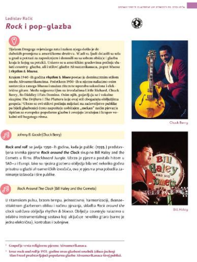
Slika br.3, Poglavlje iz udžbenika Glazbena umjetnost 4 (Školska knjiga) 16

Udžbenici za Glazbenu umjetnost (u četvrtom razredu) sadrže poglavlja posvećena popularnoj glazbi. Osim povijesnog presjeka popularne glazbe, udžbenici sadrže prijedloge za slušanje te osmišljena pitanja, zadatke i dodatne aktivnosti. Svojevrsna problematika su gimnazijski programi, po kojima je obrada popularne glazbe predviđena za kraj četvrtog razreda, koje za učenike maturante predstavlja stresno razdoblje pred maturu.