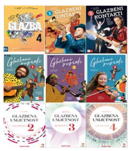
Slika br.4, Udžbenici za Glazbenu umjetnost 17