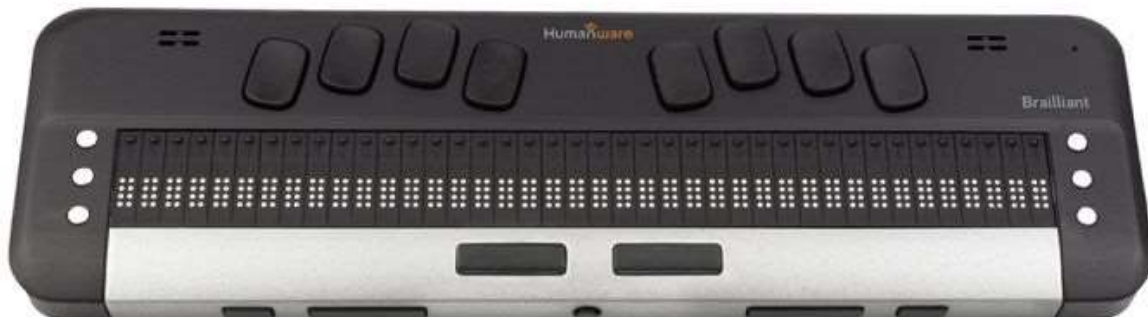
Slika 4. Prikaz Brajlova monitora

Što se tiče ponude i cijena ovih uređaja, one su široke, stoga će se navesti oni koji su po procjeni stručnjaka najbolji: