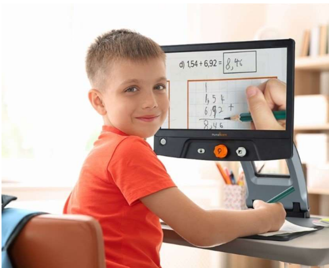
Slika 2. Prikaz monitora koji koristi video povećalo