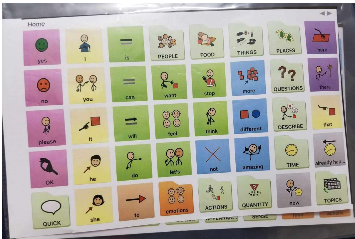
Slika 14. Prikaz ploče sa sličicama za djecu s govorno-glasovnim teškoćama

Takvi uređaji niske tehnologije gotovo su besplatni: mogu se sami napraviti u nekom od alata za uređivanje teksta i oblika. Jedino što košta jest uloženo vrijeme da se napravi takva pločica, no to je vrijeme dobro uloženo jer olakšava komunikaciju osobama i djeci s govorno-glasovnim teškoćama ( https://guides.library.illinois.edu/c.php?g=613892&p=4265891 ).