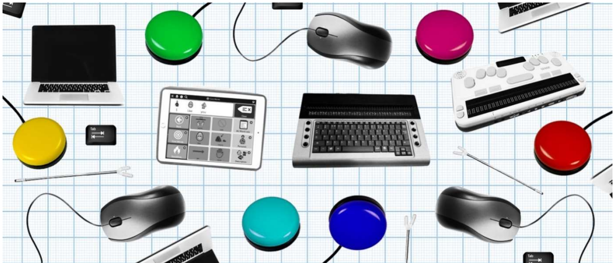
Slika 1. Prikaz asistivnih uređaja

ICT je objašnjen u prijašnjem poglavlju te kao što je bilo najavljeno, u ovom poglavlju obradit će se asistivne tehnologije koje se nalaze u ICT-u. Povezano s teškoćama koje učenici imaju, obradit će se što više mogućih tehnologija za pomoć djeci s određenim teškoćama. Govorit će se o pristupačnosti određenih tehnologija, njihovoj upotrebi te isplati li se financijski uvesti takve tehnologije u škole. Asistivne tehnologije bit će prikazane redom vezane uz teškoće s kojima se djeca susreću, a to su oštećenje vida, oštećenje sluha, motoričke teškoće, govorno-glasovne teškoće, poremećaji ponašanja, autizam te zdravstvene teškoće i neurološka oštećenja.