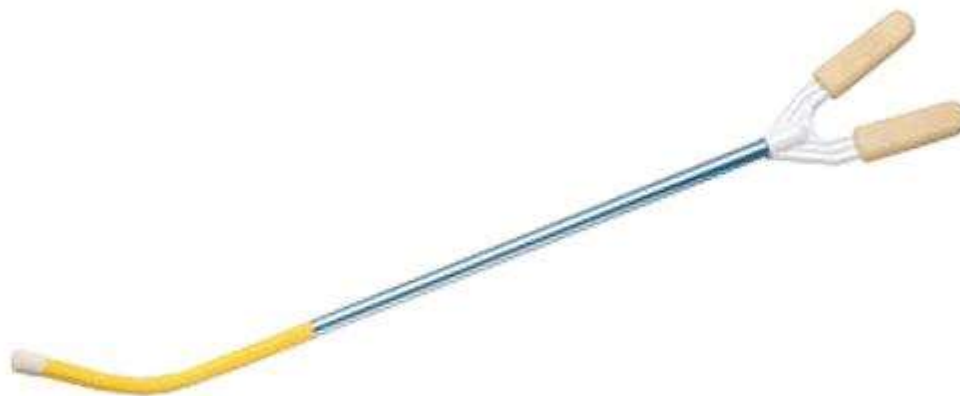
Slika 8. Prikaz štapića za usta

Cijene se kreću od nekoliko stotina kuna do nekoliko tisuća kuna, no najčešći su oni koji koštaju 300 kuna ( https://www.amazon.com/Best-Sellers-Health-Personal-Care-Mouth-Sticks/zgbs/hpc/3776211 ).