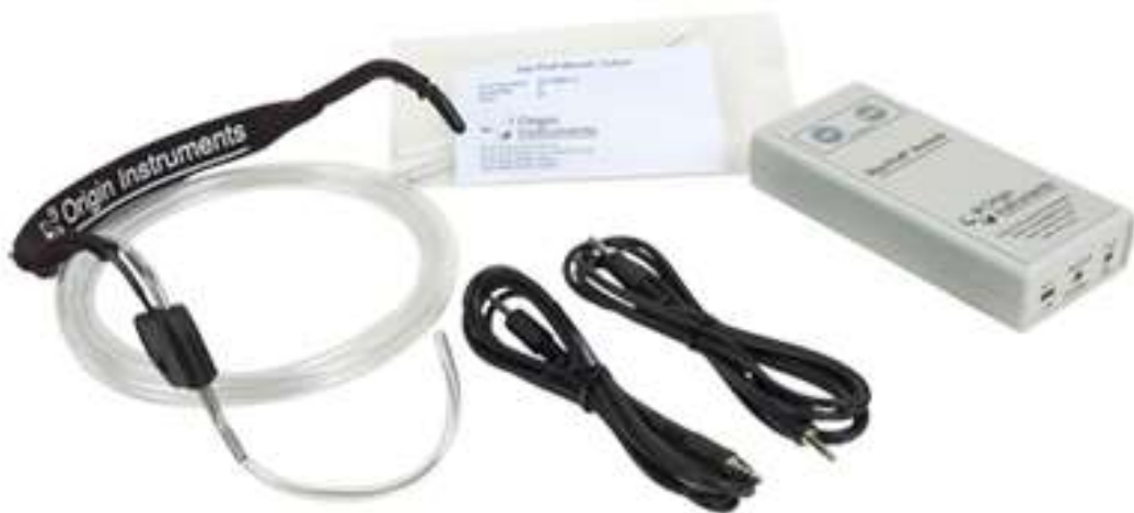
Slika 11. Prikaz prekidača gutljaja i puhanja

Na sličan način funkcionira i ovaj prekidač. Ta vrsta prekidača prepoznaje korisnikove aktivnosti puhanja i usisa kao uključiti/isključiti signale te pomoću tog prekidača djeca s motoričkim teškoćama teže razine mogu kontrolirati svoja kolica, računala itd. Što se tiče primjene ovog prekidača, ona se kreće od jednostavnih do složenijih radnji ( https://webaim.org/articles/motor/assistive ). Na slici 11 prikazan je jedan takav prekidač. Cijena ovog uređaja, odnosno alata u većini je slučajeva 200 $, odnosno 1300 kuna ( https://enablingdevices.com/product-category/switches/sip-puff-mouth-switches/ ).