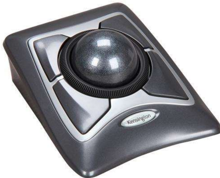
Slika 12. Prikaz velikog miša s kuglom

Miš s kuglicom ne mora biti asistivna tehnologija jer neki ljudi koji nemaju teškoće imaju želju koristiti takav tip miša zato što je često jednostavniji za korištenje od običnog miša i ne zahtijeva nikakvu podlogu. Međutim, kao što postoje obični miševi s kuglicom, postoji i onaj koji je prilagođen djeci s motoričkim teškoćama – na primjer, miš koji koristi osoba koja nema mogućnosti upravljanja svojim gornjim ekstremitetima. Takav je miš velik i nalazi se na podu te osoba njime može upravljati pomoću svojih stopala. Kugla za upravljanje nalazi se u sredini toga miša, a lijevi i desni klik nalaze se na rubovima. Pomoću njega osoba može upravljati računalom i drugim uređajima na koje se ovaj miš može povezati. Na slici 12 prikazan je upravo takav miš ( https://www.adaptivetechsolutions.com/bigtrack-ball-mouse-wireless/ ).