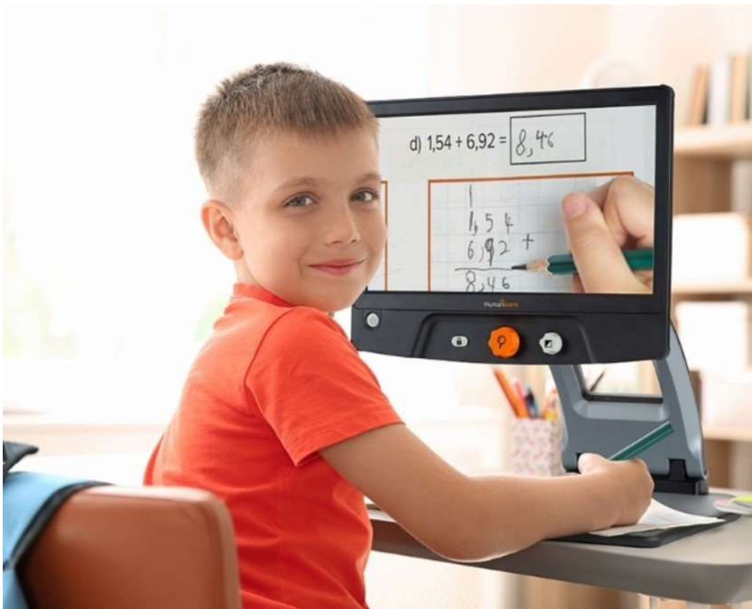
Slika 2. Prikaz monitora koji koristi video povećalo