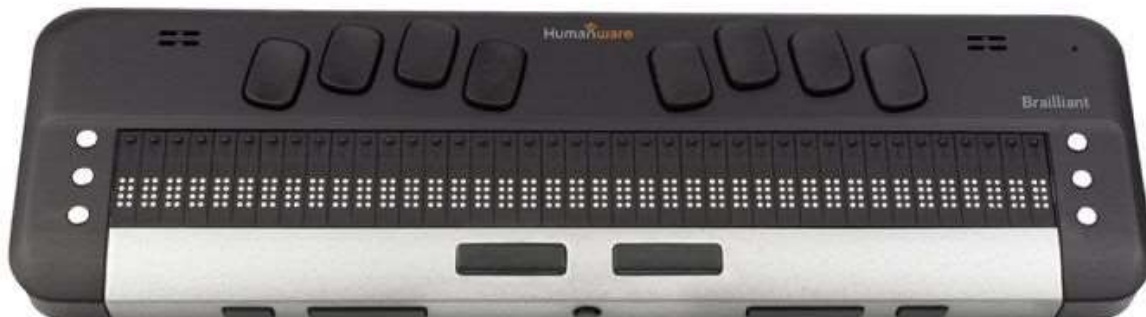
Slika 4. Prikaz Brajlova monitora

Što se tiče ponude i cijena ovih uređaja, one su široke, stoga će se navesti oni koji su po procjeni stručnjaka najbolji: