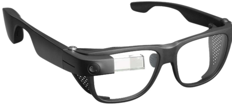
Slika 3. Prikaz Envision pametnih naočala

Cijena ovih naočala poprilično je visoka, no jednom kada se ovaj proizvod kupi, Envision jamči doživotnu upotrebu, kao i jamstvo u slučaju kvara. Cijena je 3270 €, odnosno 25 000 kuna. Uz Envision postoje još neke tvrtke koje proizvode takav tip uređaja za pomoć s oštećenjem vida, a to su: IrisVision s cijenom od 3000 $, odnosno 20 000 kuna, Acesight s cijenom od 5000 $, odnosno 33 200 kuna, NuEyes Pro s cijenom od 6000 $, odnosno 40 000 kuna. Iako su cijene visoke, kvaliteta uređaja i sama korist vrlo je velika i isplativa, jer može omogućiti slijepoj djeci i djeci s težim oštećenjima vida da se lakše snalaze u prostoru te da na neki način budu više uključena u životne i društvene radnje ( https://irisvision.com/electronic-glasses-for-the-blind-and-visually-impaired/ ).