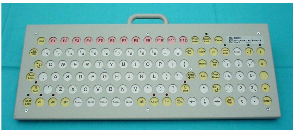
Slika 13. Prikaz prilagodljive tipkovnice

Prilagodljiva tipkovnica je uređaj koji pomaže osobama koje imaju teškoće s pokretima šaka i prstiju, ali imaju mogućnost osnovnih jednostavnih pokreta. Točnije, ona koristi osobama koji ne mogu obaviti fine motoričke pokrete. Sastoji se od udubljenih tipaka, što omogućava osobama bez fine motorike ruku da postavie ruku na tipkovnicu i onda klizećim pokretom ruke dođu do tipke koju žele stisnuti. Djeca koje imaju tremore ili spastične pokrete često koriste ovakve tipove tipkovnica. Raspored slova na tim tipkovnicama identičan je onom na standardnim tipkovnicama. Neke od ovakvih tipkovnica dolaze i sa softverom za automatsko nadopunjavanje riječi, što umanjuje napore koje osoba s motoričkim teškoćama ulaže u pisanje ( https://webaim.org/articles/motor/assistive#adaptivekeyboard ). Na slici 13 nalazi se prikaz jedne takve tipkovnice.