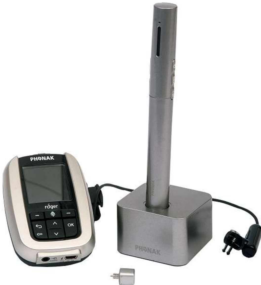
Slika 5. Prikaz transmitera i prijavnika za djecu s oštećenjem sluha