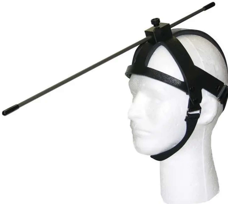
Slika 9. Prikaz štapića za glavu (izvor: https://tecnologiasenelambitosocial.wordpress.com/2017/10/11/head-wand/ )

Što se tiče cijene takva alata za pomoć osobama i djeci s motoričkim teškoćama, one variraju ovisno o kvaliteti samog alata. Najprodavaniji tip jest onaj koji se može prilagođavati prema razini i kutu i on košta 169 $, odnosno 1125 kuna ( https://www.caregiverproducts.com/adjustable-head-pointer.html ).