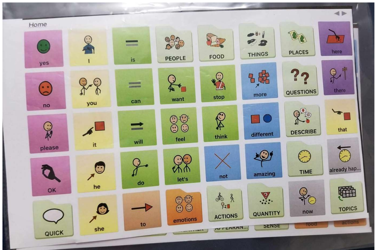
Slika 14. Prikaz ploče sa sličicama za djecu s govorno-glasovnim teškoćama

Takvi uređaji niske tehnologije gotovo su besplatni: mogu se sami napraviti u nekom od alata za uređivanje teksta i oblika. Jedino što košta jest uloženo vrijeme da se napravi takva pločica, no to je vrijeme dobro uloženo jer olakšava komunikaciju osobama i djeci s govorno-glasovnim teškoćama ( https://guides.library.illinois.edu/c.php?g=613892&p=4265891 ).