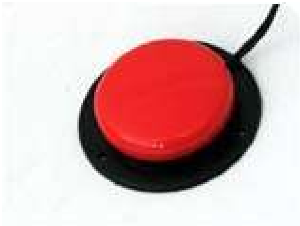
Slika 10. Prikaz prekidača s pristupom

Djeci s vrlo ograničenom pokretnošću ovaj alat od velike je koristi. Ako dijete, na primjer, može samo pokretati glavu, ovaj prekidač postavi se uz glavu te dijete na taj način može pritisnuti prekidač pokretima glave. Pritisci na ovaj prekidač prenose se na aplikaciju na računalu koja dopušta korisnicima da se kreću kroz operacijski sustav, internetske stranice i ostale programe. Neke aplikacije imaju mogućnost nadopunjavanja riječi i radnji koje djeca rade na način da osobi ponude izbor što želi napisati ili napraviti te im na taj način olakšava korištenje računala i tehnologija. Na slici 10 prikazan je jedan takav gumb. Cijene se kreću od 350 kuna do nekoliko tisuća kuna, ovisno o mogućnostima prekidača ( https://webaim.org/articles/motor/assistive ).