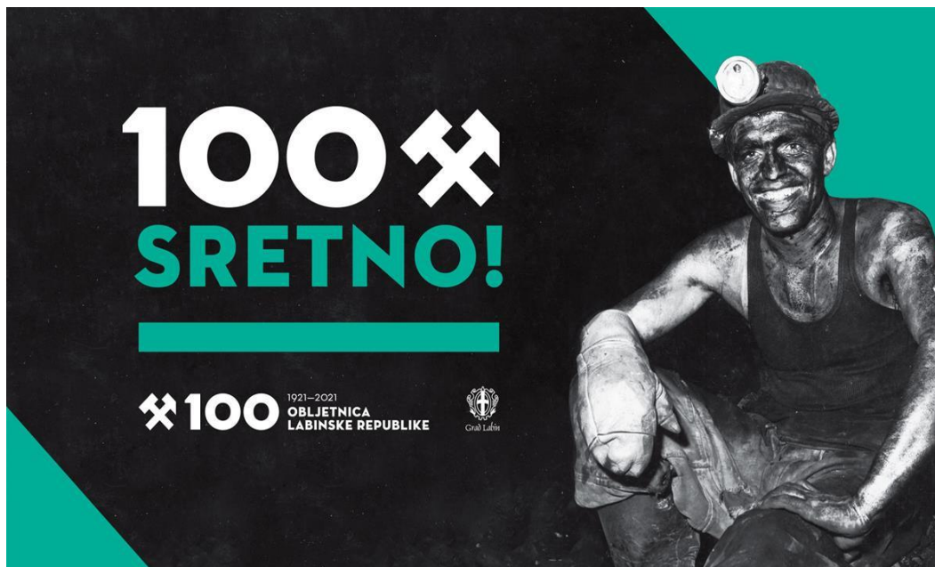
Slika 25. Promo plakat sa službenim sloganom na kojem su vidljive dominantne boje (crna i zelena) po kojima je mnogima poznat labinski identitet