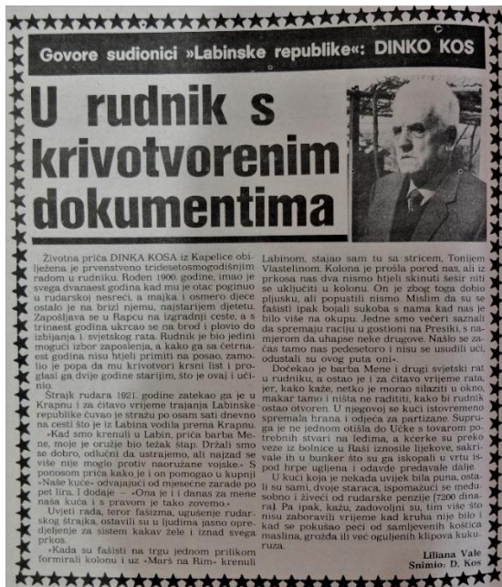
Slika 14. Kolumna "Govore sudionici 'Labinske republike'"