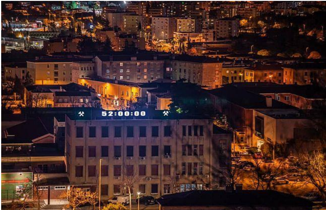
Slika 22. Sat postavljen u Labinu koji je odbrojavao dane do obljetnice