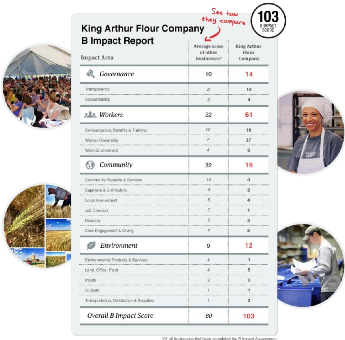
Slika 4 : Usporedba utjecaja korporacije King Arthur koja proizvodi brašno u odnosu na ostale korporacije koje su prošle B Impact Assessment