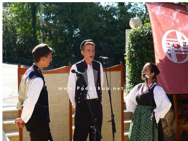
Slika 8: Pjevanje na „tonko i debelo“