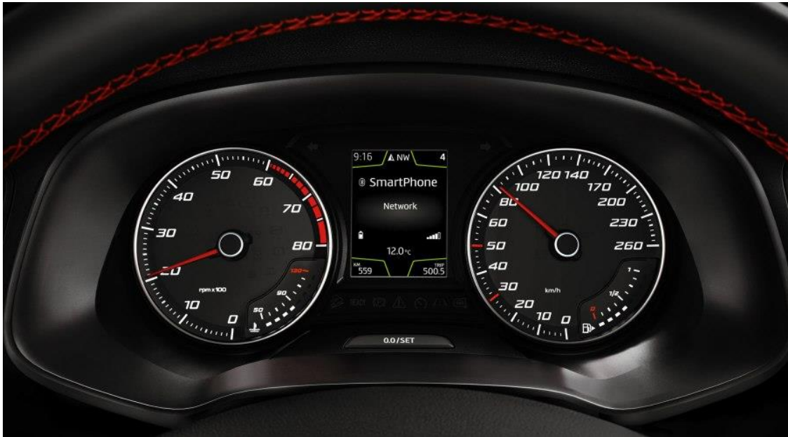
Slika 1 - putno računalo u automobilu

Ovisno o marki, modelu i godini na automobilu, putno računalo će imati različite mogućnosti. Na jeftinim automobilima, putno računalo može uključivati samo mjerač vanjske temperature i podatke o kilometraži. U vrhunskim luksuznim automobilima putna računala su često naprednija; na primjer, neki mogu pratiti ukupnu učinkovitost anlansera 2 ili nadzirati tlak u gumama. (Univdesigntechnologies, 2019)