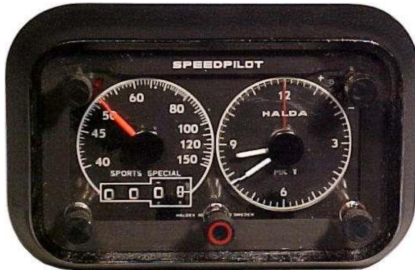
Slika 6 - Halda Speedpilot

Halda Speedpilot izračunava vrijeme i udaljenost u odnosu na unaprijed odabranu prosječnu brzinu. Potrebni su poznati čimbenici; tj. prosječna željena brzina, stvarna prijeđena udaljenost i stvarno provedeno vrijeme te izračunava vaše vrijeme u odnosu na pravo vrijeme. Dobiva točnu mjeru udaljenosti od kabla brzinomjera. Gumb za odabir prosječne brzine kontrolira niz varijacija koje određuju napredak ruke pilota. To je napredak ruke pilota, koji kontinuirano ukazuje na bilo kakvo odstupanje od pravog vremena. (MGAguru, 2011.)