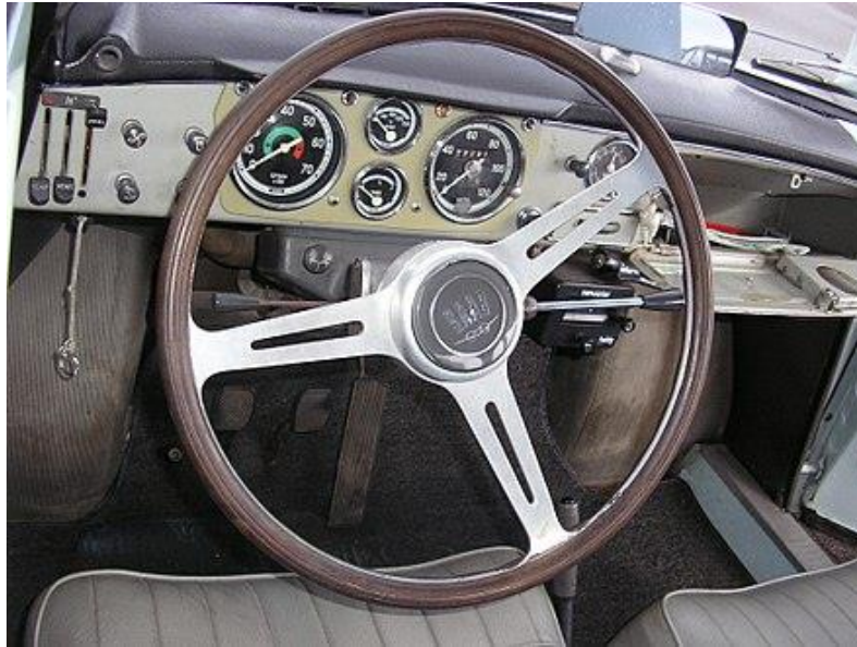
Slika 5 - Halda Tripmaster je postavljen ispod instrumenta Saaba GT8500