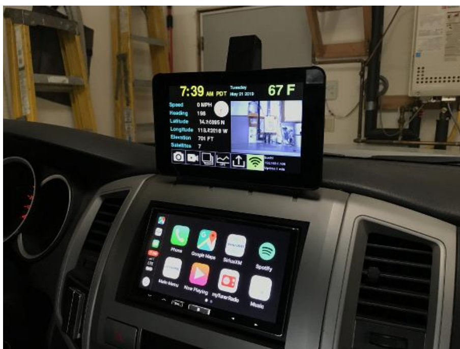
Slika 13 - Carputer kodiran u Pythonu-u baziran na Raspberry Pi, ugrađeno u Toyotu