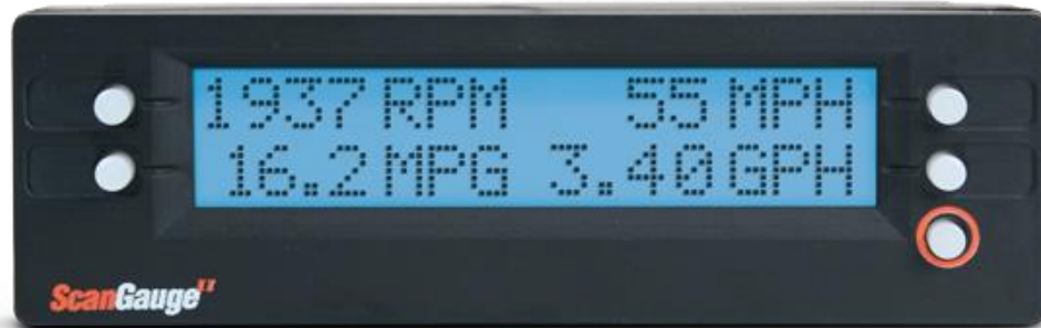
Slika 3 - ScanGauge II

vrijeme bio jedini lako instaliran (putem OBDII 7 ) pribor koji je radio kao putno računalo, 4 istovremena digitalna mjerača i dijagnostički čitač kodova problema. Ovaj uređaj ima na raspolaganju 12 različitih mjerenja koja se mogu koristiti kao 4 digitalna mjerača. Mjerne jedinice se mogu nezavisno odabrati između mi/km, gal/l, °C/°F i PSI/kPa.