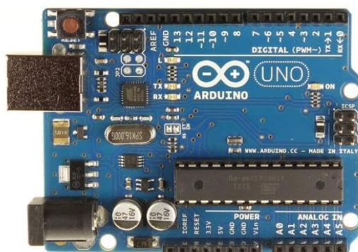
Slika 7 - Arduino

Arduino (Slika 7.) je elektronička platforma otvorenog koda koja se temelji na hardveru i softveru koji je jednostavan za korištenje. Arduino, instrukcije šalju se niz uputama mikro kontroleru na ploči. Za slanje niz uputa, koristi se programski jezik Arduino (temeljen na ožičenju) i Arduino softver (IDE 12 ) na temelju obrade. (Arduino, 2018.) Tijekom godina Arduino je bio mozak tisuća projekata, od svakodnevnih predmeta do složenih znanstvenih instrumenata. Svjetska zajednica kreatora - studenata, hobista, umjetnika, programera i profesionalaca - okupila se oko ove platforme otvorenog koda, čiji su doprinosi dodali nevjerojatnu količinu dostupnog znanja koje može biti od velike pomoći kako početnicima tako i stručnjacima. (Arduino, 2018.)