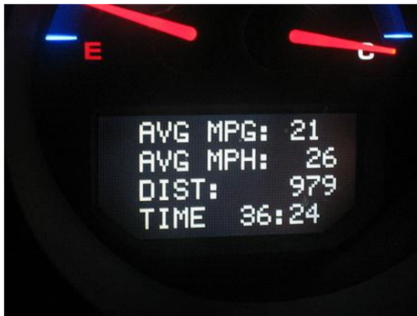
Slika 2 - Acura TL 2004, putno računalo

Automobiles) 4 vozila pružaju upozorenja o zamjeni ulja na temelju broja i duljine putovanja, temperature motora i drugih čimbenika. Neka vozila također koriste putno računalo kako bi vlasnicima omogućili promjenu određenih aspekata ponašanja vozila, npr. kako funkcioniraju blokade napajanja, ali u većini automobila "podešavanje preferencija" sada se vrši preko središnjeg zaslona koji se također koristi za pomoćnu kameru i radio.