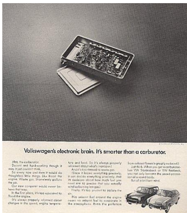
Slika 4 - Volkswagenovo prvo automobilsko računalo (1968.)

Prva upotreba računala u automobilu bila je jednostavno u svrhu kontrole motora. Proizvođači automobila počeli su uvoditi rane verzije računalno kontroliranih sustava za obavljanje jedne specifične funkcije; Godine 1968. Volkswagen je predstavio prvo vozilo s računalno kontroliranim sustavom elektroničkog ubrizgavanja goriva (EFI) D-Jetronic 10 , (Slika 4.) tranzistorizirani elektronički modul proizvođača Bosch 11 . Ponuđen je kao standardna oprema na njihovim modelima Type-3. (ChipsEtc, 2021.)