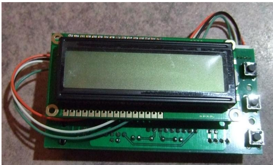
Slika 9 - OBduino