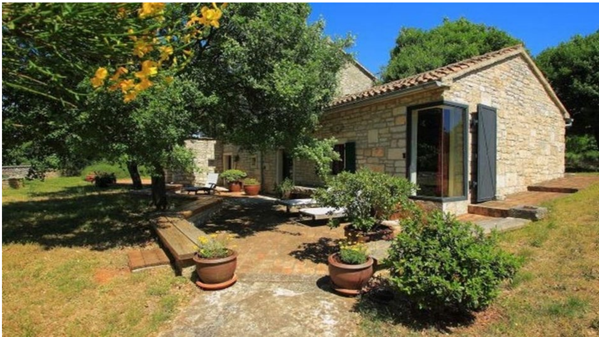
Slika 2. Istarska stancija, Rovinj 0170