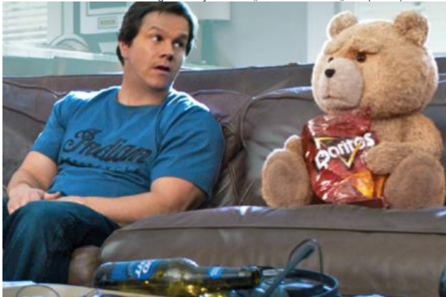
Slika 7. Prikriveno oglašavanje marke „Doritos“ u filmu „Ted“ (2012.)