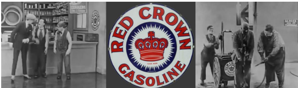
Slika 2. Prikriveno oglašavanje u filmu "The Garage"