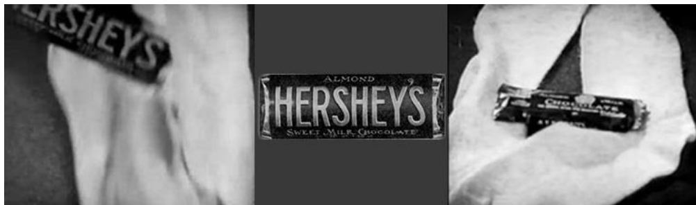
Slika 3. Prikriveno oglašavanje u filmu "Wings" nagrađenom filmskom nagradom Oscar