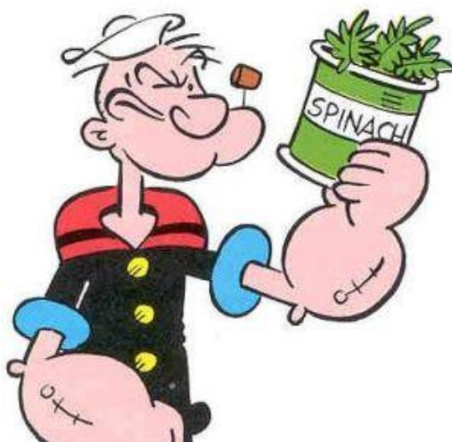
Slika 4. Mornar Popaj sa špinatom