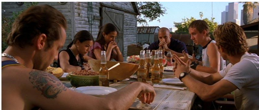
Slika 10. Corona pivo u filmu "Brzi i žestoki"