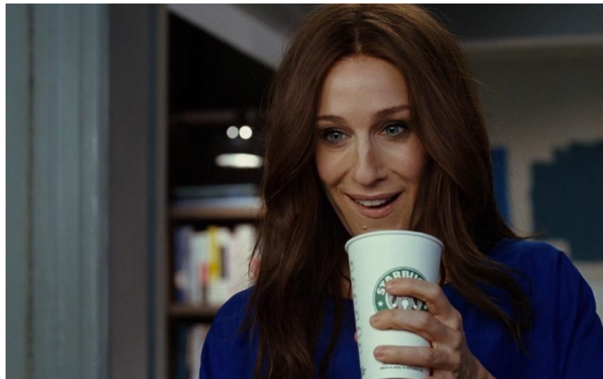
Slika 5. Prikazivanje "Starbucks" loga u seriji "Seks i grad"