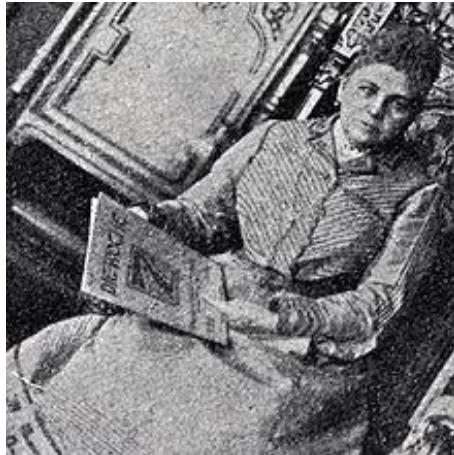
Slika 1. Prikriveno oglašavanje u časopisu „Die Woche“