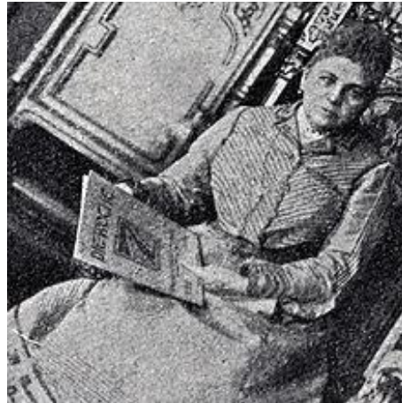
Slika 1. Prikriveno oglašavanje u časopisu „Die Woche“