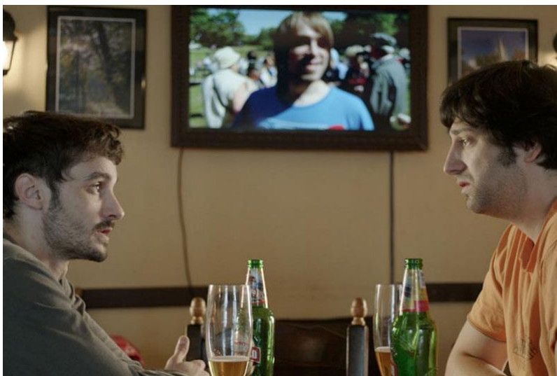
Slika 11. Prikriveno oglašavanje „Ožujskog“ piva u filmu „Zagrebačke priče“