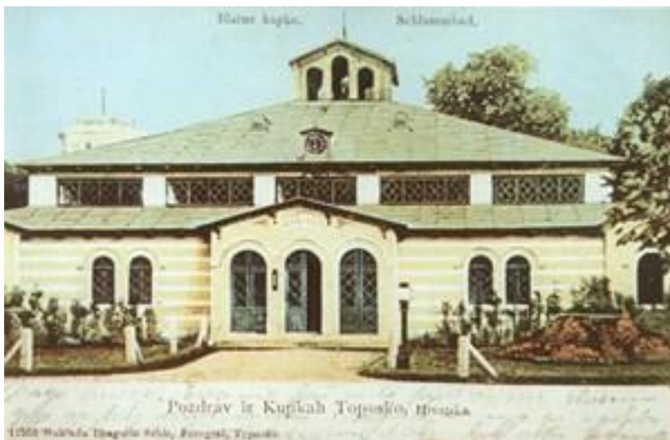
Slika 5. Razglednica iz Topuskog