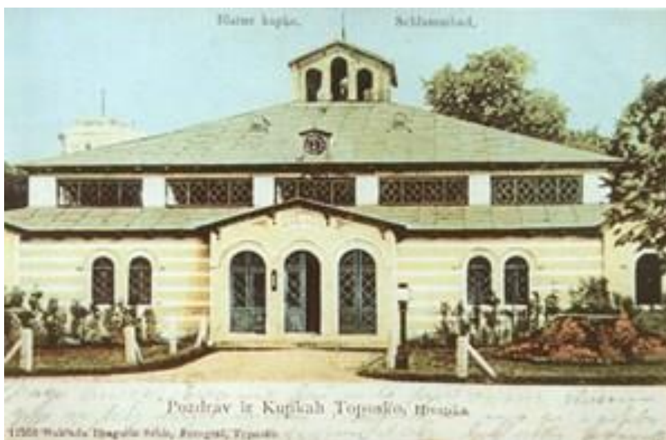
Slika 5. Razglednica iz Topuskog