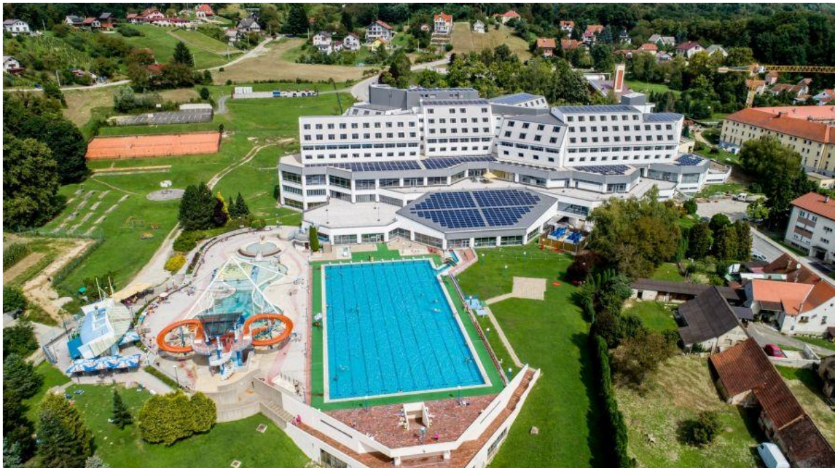
Slika 3: Specijalna bolnica za medicinsku rehabilitaciju Varaždinske Toplice