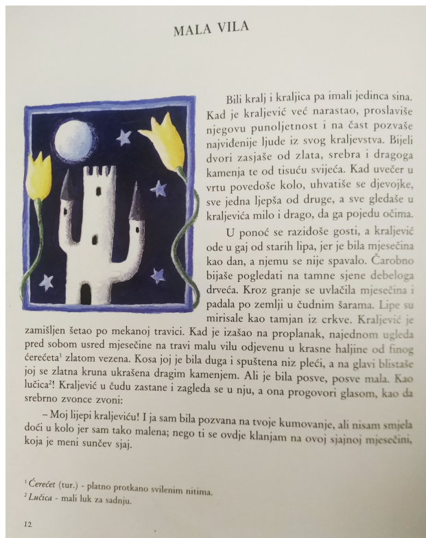
Slika 5. Pejzaž

Sljedeća ilustracija (Slika 6) prekriva cijelu stranicu i prati početni stil. Prevladava tamna boja, prikazani su mjesec i zvijezde, što upućuje na noć. U sredini slike nalazi se djevojka, anđeoskog lica, zlatne, duge kose, obučena u bijelo. Umjetnica prikazuje svoje viđenje Male vile , te upućuje da se vrijeme radnje događa u kasnu noć.