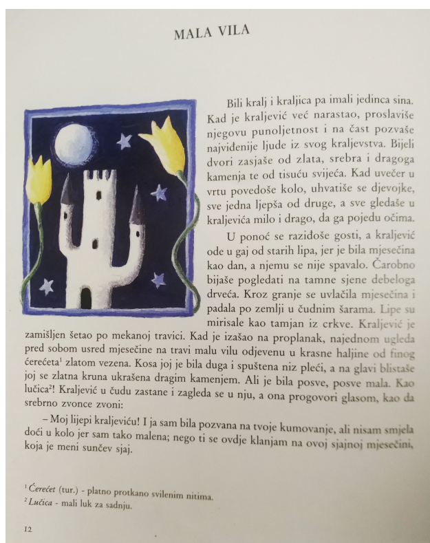
Slika 5. Pejzaž

Sljedeća ilustracija (Slika 6) prekriva cijelu stranicu i prati početni stil. Prevladava tamna boja, prikazani su mjesec i zvijezde, što upućuje na noć. U sredini slike nalazi se djevojka, anđeoskog lica, zlatne, duge kose, obučena u bijelo. Umjetnica prikazuje svoje viđenje Male vile , te upućuje da se vrijeme radnje događa u kasnu noć.