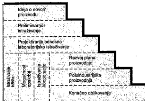
Slika 2. Proces istraživanja proizvoda

Izvor: Sikavica P., Novak M. (1999.) Poslovna organizacija. Zagreb: Informator. str. 754.-762.