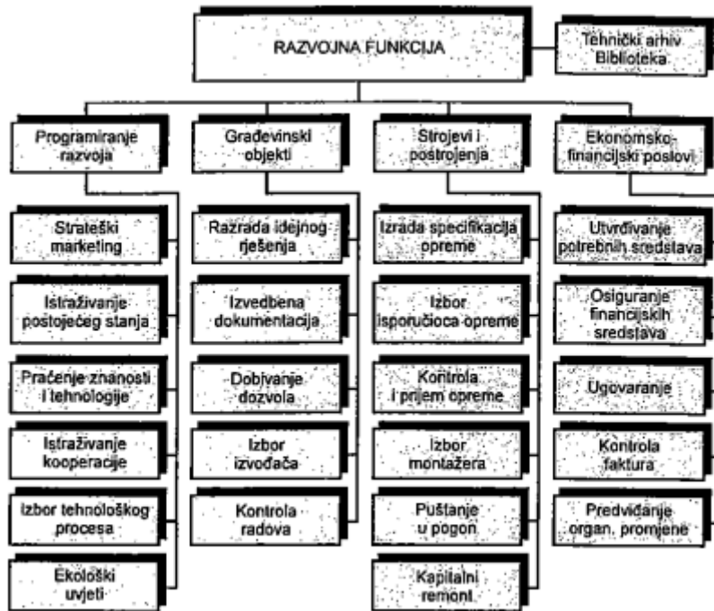
Slika 3. Razvojna funkcija

Izvor: Sikavica P., Novak M. (1999.) Poslovna organizacija. Zagreb: Informator. str.762.-774.