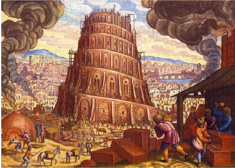
Slika 6. Babilonska kula.