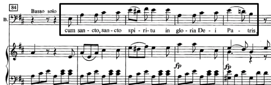
Slika 17. Druga tema

Od 72. do 76. takta slijedi motiv u funkciji mosta koji vodi u drugu temu (Slika 17) i „B“ dio u A-duru. Motiv izvodi samo prva violina pa nastavlja materijalom druge teme, a prati ju gudački dio orkestra. Puhači nastupaju samo u taktu 80 (i paralelno tome u taktu 88) za što bih dobu ranije dao oštar uzmah i udahnuo s njima. Druga je tema skokovita i karakterno zaigranija od prve, a izvodi ju prvo samo orkestar u 77. taktu te solo bas od 85. takta.