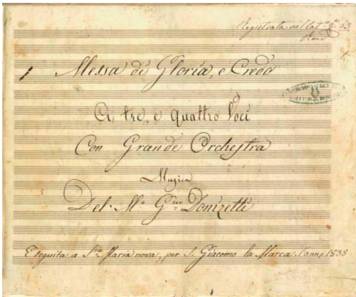
Slika 1. Naslovna stranica rukopisa Donizettijeve „Messe di Gloria, e Credo“

U skladu s tradicijom „napuljske škole“ skladanja, djelo nije čitava misa sa svim stavcima. U rukopisu napuljskog muzičkog konzervatorija naslovljeno je kao „Messa di Gloria, e Credo“ (Slika 1.), implicirajući da se radi o dva dijela – „Messa di Gloria“, forma mise karakteristična za „napuljsku školu“ koja sadržava početna dva stavka Kyrie i Gloria , te odvojeni „Credo“ stavak. Unutar stavaka je liturgijski tekst podijeljen na brojeve sačinjene od pojedinih stihova liturgijskog teksta. Djelo se sastoji od 12 takvih dijelova koji se ističu jasnim glazbenim oblikovanjem i bogatstvom pjevnih melodija.