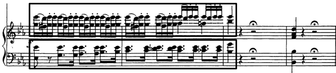
Slika 14. Motivi preuzeti iz stavka Kyrie

Od 60. takta, drugi dio u Allegro tempu započinje novom temom. Novi tempo i harmonijski ritam na polovinku traže da se drugi dio dirigira na dva. Nakon instrumentalne ekspozicije polovice teme u dionici horne nastupa solo tenor izvodeći ju u cjelosti. Tema je u obliku velike periode. U 76. taktu Donizetti izostavlja početak glave teme u dionici solista, što će napraviti i kasnije u stavku. Po završetku nastupa teme, opet započinje zbor, ali