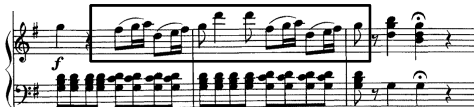
Slika 10. Figura mosta i kadence

Ovaj je dio sopranska arija, a izvodi ju solistica uz pratnju orkestra. Trodijelnog je ABA' oblika u G-duru, a karakter je ispočetka pastoralan. Dio započinje trodijelnim uvodom u kojem solo flauta ima glavnu ulogu. Njena dionica iznosi glavnu temu u obliku velike periode do 8. takta, nakon čega slijedi drugi odsjek karakteriziran pokretljivim ostinato u pratnji. U početku je isticanje njene dionice potpomognuto orkestracijom – pizzicato gudači i općenito puno prostora zbog pauza. Kada nastupi ostinato , važno je da se ne prekrije dionica flaute. Također, karakter je na početku zaigran te bi ga kao dirigent inicirao suptilnim, ali oštrim pokretom. Treći odsjek uvoda harmonijski je na dominantni tonaliteta, a flauta izvodi virtuozne šesnaestinske figure. Od 26. takta nastupa motiv (Slika 10) u gudačima kojim završava uvod te će ga Donizetti koristiti kao most i kadencu kroz stavak.