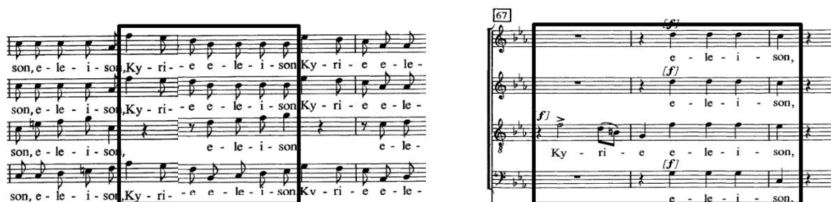
Slika 6. Motiv iz sekvence prvog dijela i početak drugog dijela stavka

U taktu 67 nastupa zbor. Nakon uzemljenog ostinatnog ritma iznenadno nastupaju tenori i drveni puhači u sinkopi i forte dinamici, za što bi dirigent trebao dati oštar znak na prvu dobu takta. Odsjek ritmički podsjeća na zbarsku sekvencu koja se prije pojavila u 20. i 52. taktu (Slika 6), ali je preuzet samo jedan nastup bez sekvenciranja. Potom muški zbor homofono izriče tekst „eleison“ te ih ženski zbor u nastavku imitira. Slijede ponovljeni taktovi 67 i 68, nakon čega zbor nastavlja homofono izuzev basa koji upadaju s kromatsko-uzlaznim motivom. Zbarski odsjek završava na dominantni početnog tonaliteta dvaput ponovljenom kadencom, koju čini kromatski motiv u inverziji – silaznim kretanjem zaključuje prvi odsjek nakon čega slijede solisti u Es-duru.