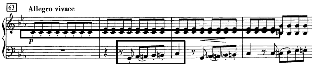
Slika 5. Ostinato i kromatski motiv na kojima se gradi drugi dio stavka

1:2, zbog čega će brzina udarca dirigentskog štapića ostati ista, ali će se četverodobni takt dirigitirati na dva. U drugom taktu (64. takt) se u dionici kontrabasa pojavljuje sljedeći karakteristični, kromatsko-uzlazni motiv (Slika 5) koji će biti prisutan do kraja stavka. To je „auftaktni motiv“, to jest, melodija koja ima rješenje na prvu dobu sljedećeg takta i treba ju tako interpretirati – s intenzitetom prema sljedećem taktu. Treba također pripaziti na pravilnu artikulaciju svake note kako bi motiv dobio na karakteru. Donizetti promjenom tempa, postavljanjem ostinatne harmonijske pratnje u visokim gudačima i kromatskog motiva u dubokoj dionici basa postiže dramatičnu napetost kontrastnu polaganom i veličanstvenom karakteru prvog dijela stavka.