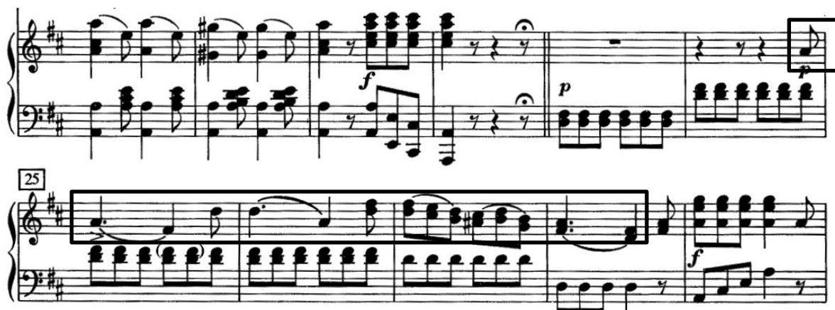
Slika 16. Prva tema, ostinatna pratnja

Zborski odgovor se nastavlja u imitacijski odsjek od 53. takta, a potom i u silaznu sekvencu do 65. takta. Slijedi ponavljanje riječi „Amen“ te se Donizetti ovdje igra s naglascima u riječi – riječ stavlja nekad na naglašeni, a češće na nenaglašeni dio takta. Također, s harmonijskog aspekta dodatno ističe drugu, inače nenaglašenu dobu takta (taktovi 66-71) smanjenim septakordom, čime postiže i harmonijsku dramatičnost. Usred svega, valja istaknuti dionice prve violine koje izvode zaigrani šesnaestinski motiv od 67. takta.