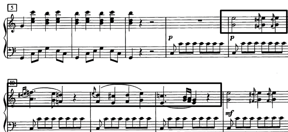
Slika 9. Pjevni motiv

Nakon stavka Kyrie , ostajemo u C-duru te novi stavak započinje standardnom podjelom četveroglasnog zbora. Mjera stavka je četveročetvrtinska, ali kao i drugu polovicu stavka Kyrie , dirigirao bih na dva zato što faktura to traži. „Gloria in excelsis“ sonatnog je oblika, a započinje uvodom koji nalikuje opernoj uvertiri jer donosi materijale koji će se koristiti u samom stavku. Uvod se može podijeliti u četiri odsjeka, a svaki je novi ritmički pokretljiviji od prethodnog. Prvi odsjek (taktovi 1-7) započinju tutti intoniranjem tonike u oktavnoj poziciji u forte dinamici. Drugi, piano odsjek počinje od 8. takta i karakteriziran je osminskim ostinatom . Kontrabasi nastupaju na prvu osminku u taktu, a zatim violončela i viole zajedno izvode ostinatni ritam kao jeku. Tako će doći do izražaja pjevna tema (Slika 9) prvih i drugih violina. Pri ponavljanju teme pridružuju se i puhači: klarineti i fagoti, kako bi promijenili boju već poznatom materijalu.