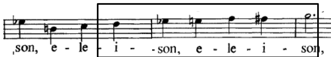
Slika 8. Kromatski motiv u augmentaciji

kao što su ranije (u 102. taktu) solisti. Nakon drugog javljanja sekvence basi izvode kromatski motiv (165. takt) dok ostali homofono izmjenjuju tonički i dominantni akord. U taktu 169 harmonijski se ritam prorjeđuje mijenjajući se na svaka dva takta, dok je za to vrijeme u dionici viole sinkopa preko cijelog takta, čime se pratnja ritmički zgušnjava dok zbor ima duge držane tonove. U 171. taktu je uklon u dominantu medijantnog As-dura postignut kromatskom promjenom akorda. Nakon kadence u toniku As-dura, Donizetti koristi uzlazni kromatski motiv u augmentaciji (Slika 8) u dionici tenora, čime se ujedno vraća natrag u C-dur.