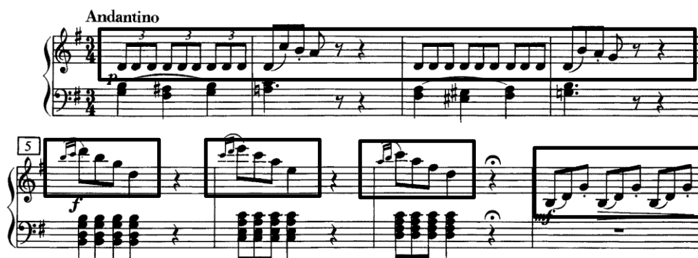
Slika 11. Pulsacija triole i arpežirani trozvuci

Stavak je skladan za solo bas i orkestar u tročetvrtinskoj mjeri, koja unutrašnjom pulsacijom češće sličí devetosminskoj. U prethodnom je stavku flauta, uz solisticu imala vodeću ulogu, a ovdje će se isticati gudački dio orkestra. Tonalitet je također G-dur, a započinje kratkim uvodom koji utvrđuje karakterističnu pulsaciju triole i arpežirane trozvuke (Slika 11). Kao i prethodni, stavak je trodijelnog ABA oblika te je basovska arija, a građen je također repeticijom i variranjem četverotaktnih i dvotaktnih glazbenih misli. Važno je dati oštar i izražajan uzmah za taktove 5, 6 i 7, kako bi uistinu svi zajedno zaszvirali.