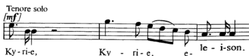
Slika 7. Tema solističkog odsjeka u taktu 96

Solo tenor prvotno iznosi dvodijelnu frazu koja se može protumačiti kao tematski materijal (Slika 7), a zatim slijedi imitacija soprana. U orkestralnoj pratnji se nastavlja pojavljivati kromatski motiv kao kontramelodija koja vodi u sljedeći takt. U taktu 100 dirigent treba dati jasan znak tenoru koji nastupa na laki dio prve dobe. Od takta 102 tenor i sopran izvode sekvence silaznih ljestvičnih nizova, a svaki niz pomaknut je interval sekunde više. Za to vrijeme bas solist izvodi svoju uzlaznu sekvencu koja se poklapa s ostalima i čini protupomak. Glazbeni materijal se počinje zgušnjavati u funkciji gradacije do 112. takta. Sekvenca kadencira homofono u Es-duru te se ponavlja. Po završetku ponovljene sekvence, slijede ponavljanja iste homofone kadence, a zatim orkestar izvodi inverziju silaznog niza sekvence od ranije. Opet nastupaju kratko solisti, a onda se i to ponavlja.