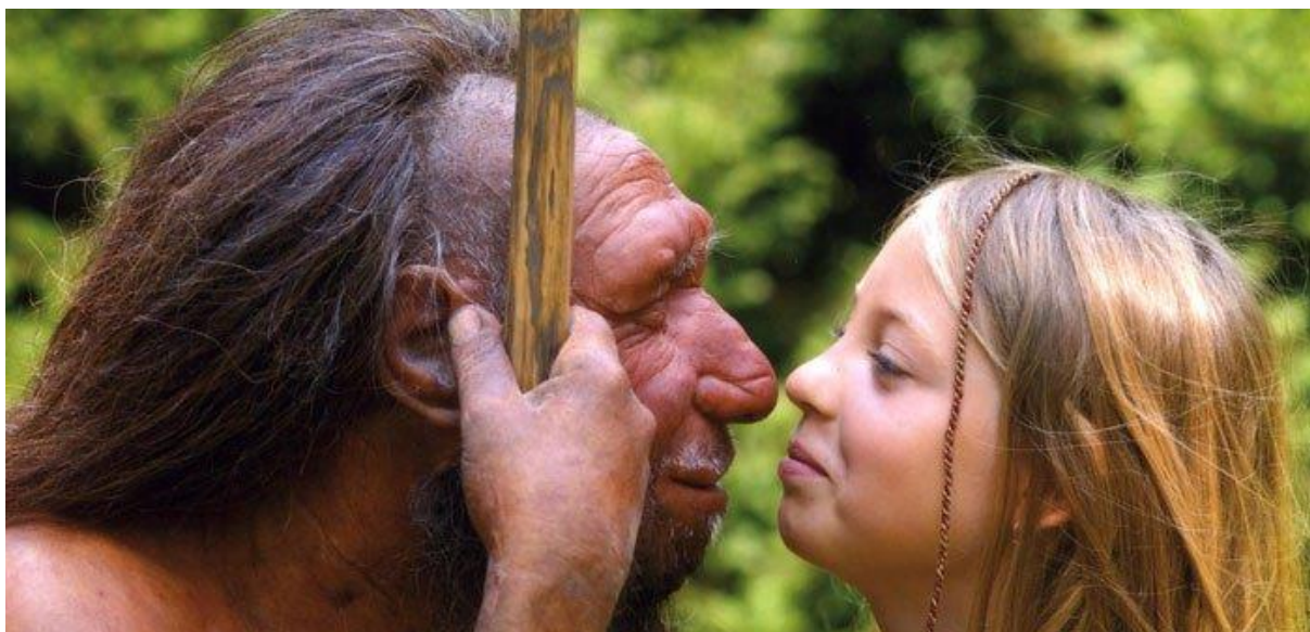
Slika 7. Neandertalac i moderan čovjek