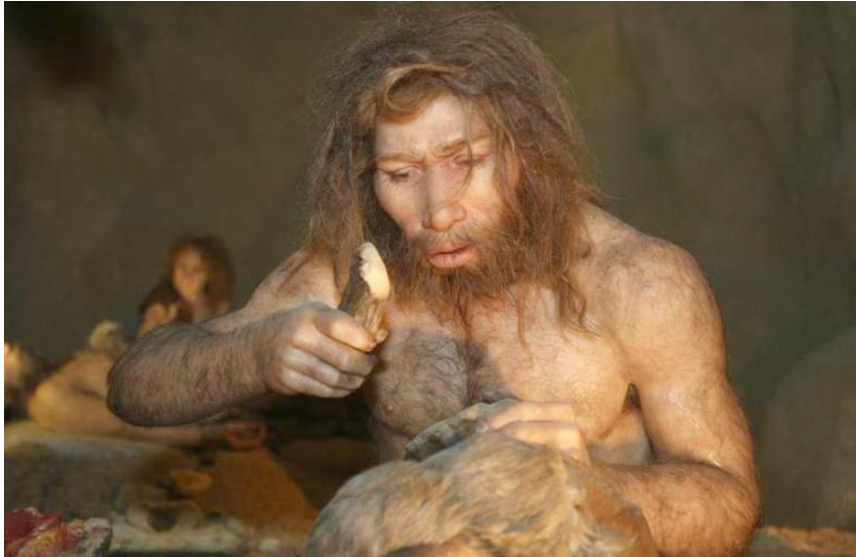
Slika 1. Fizički izgled neandertalaca