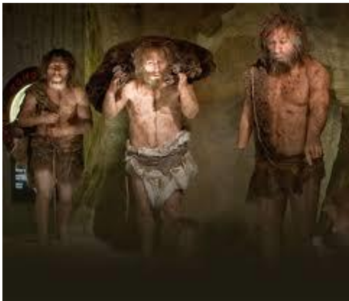
Slika 6. Neandertalci i plijen