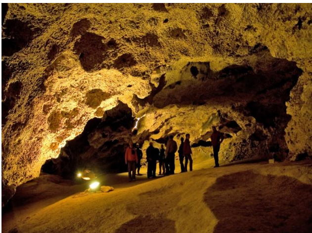
Slika 4. Veternica

otkriveni i tragovi vatrišta. 24 Međutim ovdje nisu pronađene kosti prapovijesne populacije. Malez je posebnu pažnju posvetio nalazima špiljskog medvjeda, koji čine oko 70% ukupne pronađene faune. Ti nalazi navele su Maleza da predloži postojanje „kulta medvjeda“ , to jest da su njima neandertalci pridavali posebnu važnost. Pridavanje važnosti bilo je iz razloga kako bi oslabili fizičku snagu životinje, a udobrovoljili njen duh da bi ju mogli uspješnije uloviti. Osim kostiju medvjeda pronađeni su i nalazi drugih životinja kao što su špiljski lav, jelen, nosorog, glodavaca i slično. 25 O „kultu medvjeda“ govorit će se u nastavku ovog rada, gdje će pobliže biti objašnjena kultura i način života neandertalca.