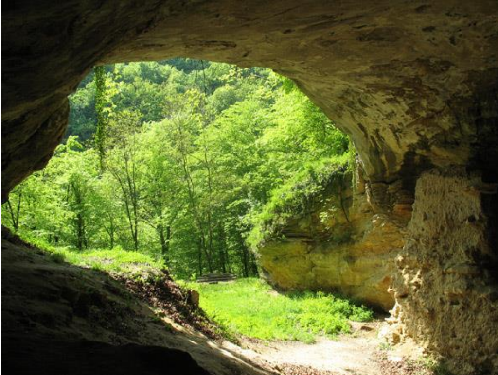
Slika 2. Špilja Vindija

zbog njene dobre očuvanosti i dostupnosti čine ju veoma atraktivnom turističkom lokacijom. 17