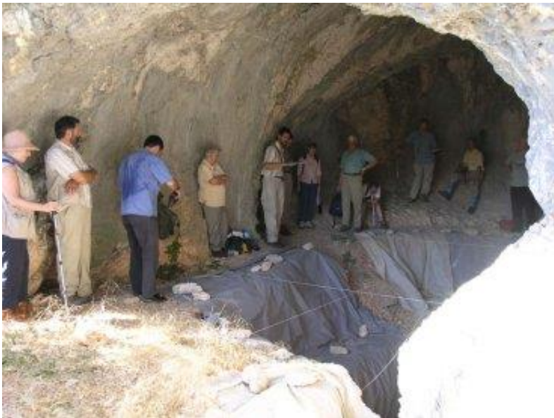
Slika 5. Istraživanje Mujine pećine

Analizom ugljena doznaje se da su koristili borovicu kao loživo za vatru koju su prije paljenja sušili. Ovo nam otkriće pokazuje da su oni doista bili sposobni snalaziti se u prirodi. 30