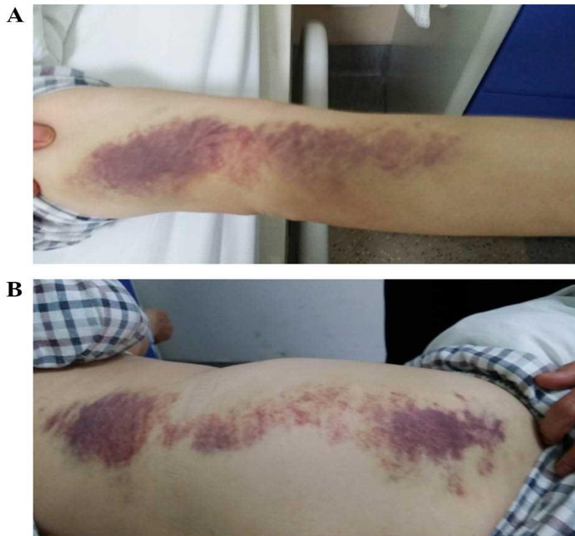
Slika 2. - Potkožni hematomi kod hemofilije. Veliki difuzni potkožni hematomi na ruci (A) ruci i (B) desnom struku i boku bolesnika s hemofilijom