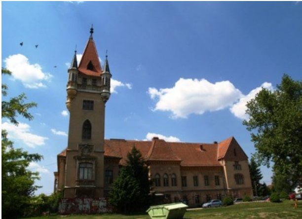
Slika 4. Dvorac Feštetić u Pribislavcu