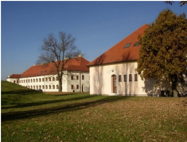
Slika 9. Tvrđava u Slavonskom Brodu