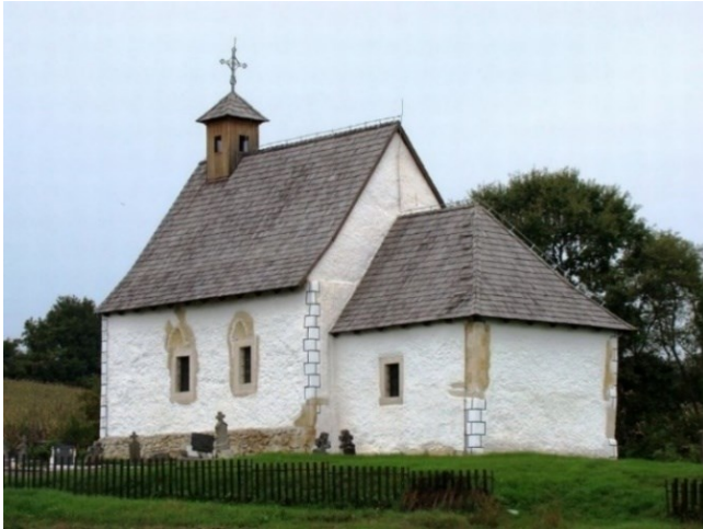
Slika 7. Crkva sv. Stjepana u Glogovici