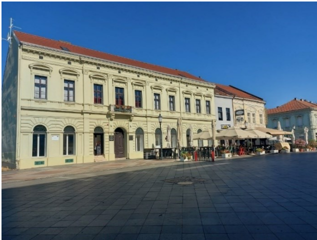
Slika 10. Kuća obitelji Brlić u Slavenskom brodu