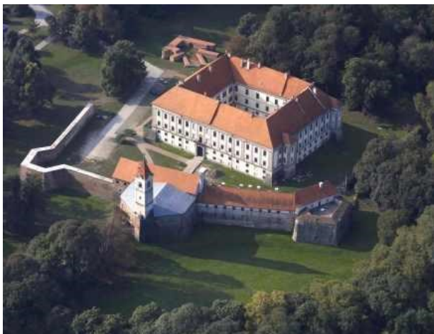
Slika 3. Kompleks Staroga grada Čakovec