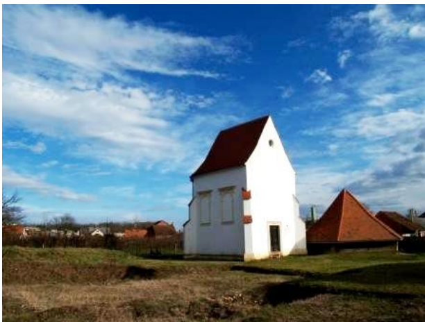
Slika 2. Kapela sv. Jelene u Šenkovcu