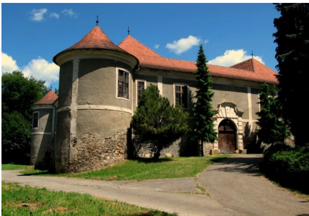
Slika 11. Dvorac Marković - Kulmer