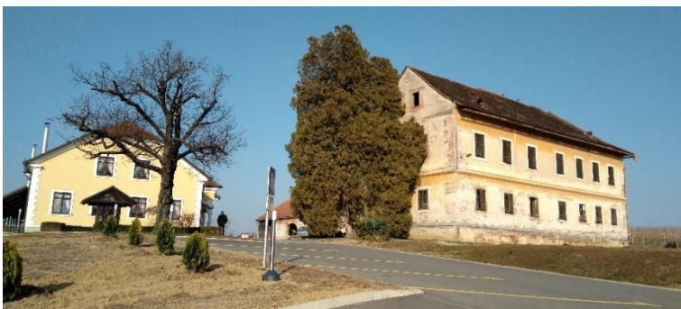
Slika 5. Kurija Zichy - Terbócz