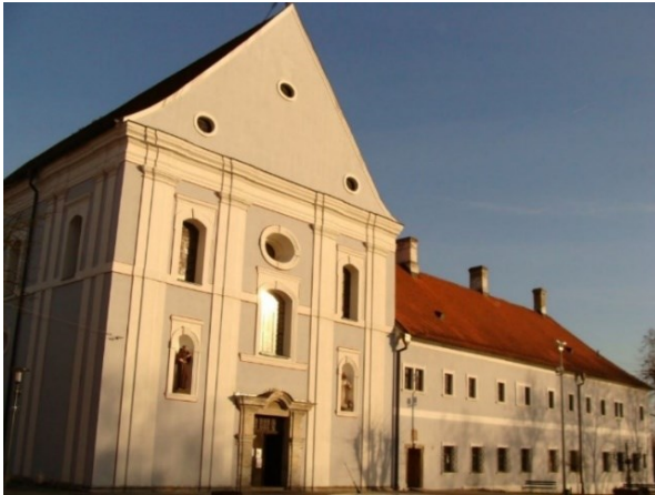
Slika 8. Crkva sv. Trojstva sa samostanom