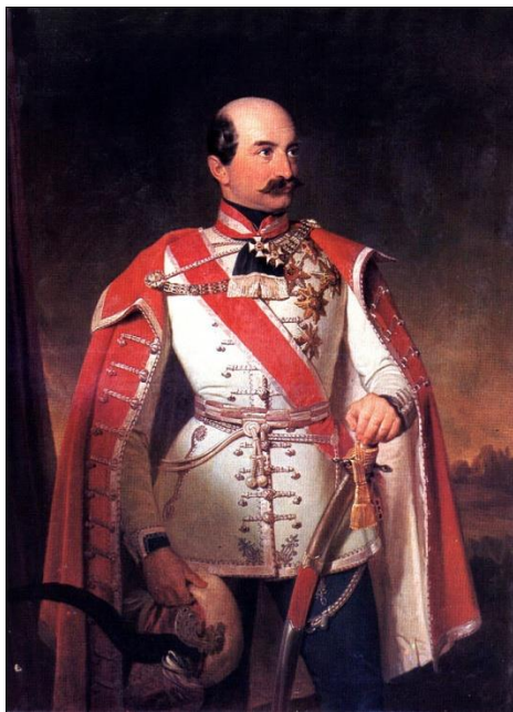
Slika 5. Ban Josip Jelačić, 1848.

U svojim mlađim danima pisao je pjesme, te je 1825. u Zagrebu objavio svoju zbirku od 27 pjesama na njemačkom jeziku koje su nosile naziv "Stunde der Erinnerung", što bi u prijevodu značilo "Trenutak sjećanja". Ilirac i pristaša Narodne stranke, bio je cijenjen među ilircima, narodnjacima i vojnim krugovima. U izvještaju brigadnog generala Johanna Kempena, Jelačića hvali kako govori i piše šest jezika, od koja četiri tečno. Kempen je tvrdio kako Jelačić ima plemenito srce, vatreni duh, čudorednost, prijazno držanje, jednostavan i pristojan život te da je veseo u dodiru s ljudima. Takvo mišljenje o pukovniku Jelačiću izrazili su i general Maximilian Auersperg i podmaršal Hermann Dahlen. 18