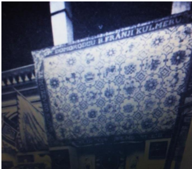
Slika 4. Sag zagrebačkih ilirskih domorotkinja, narodni dar F. Kumleru, 1843.

S obzirom na to da je Kulmer zagovarao imenovanje Josipa Jelačića za hrvatskog bana, isticao je njegovu učenost, čvrsto privrženost vladaru, potpuno poznavanje narodnog života, zrelost u prosuđivanju, te ugled i utjecaj kod Hrvata. Kulmer je smatran savjetnikom i ekspertom za hrvatska pitanja. Bez njegovog zauzimanja i Gajevog nastojanja, Josip Jelačić ne bi bio hrvatski ban. 17