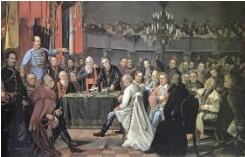
Slika 6. Zasedanje Hrvatskog sabora 1848. prvi hrvatski građanski sabor.

jeziku tekst odluke kojom je kralj imenovao Josipa Jelačića za hrvatsko-dalmatinsko-slavonskog bana. Zatim je slijedila prisega koju su saborski zastupnici jednoglasno odobrili (slika 6.).