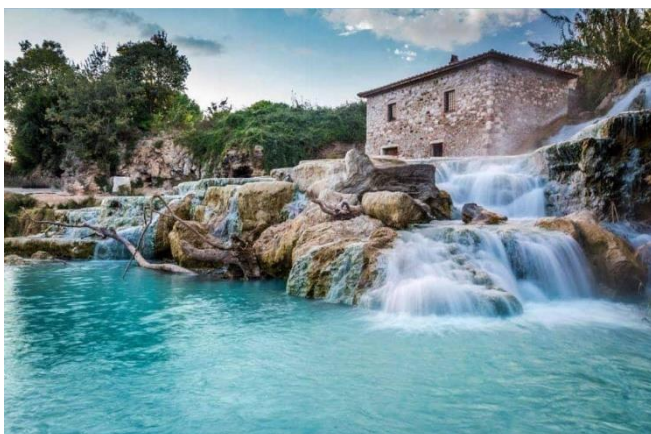
Fotografija 17. Cascate del Mulino