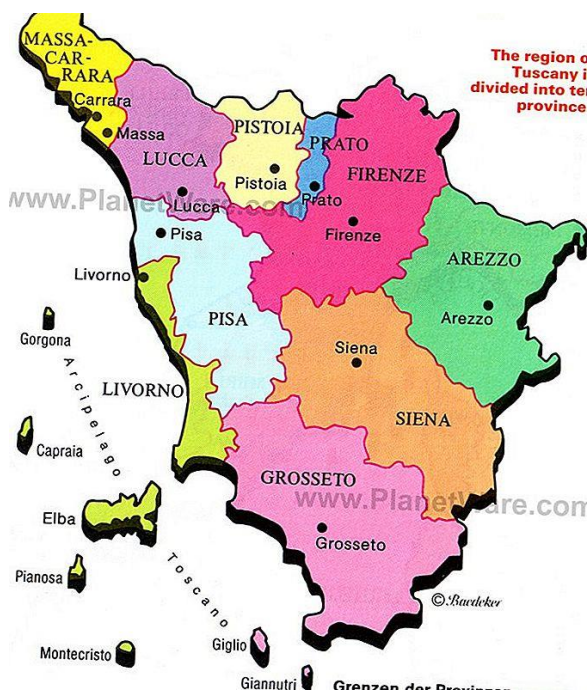
Fotografija. 1. Pokrajine Toskane