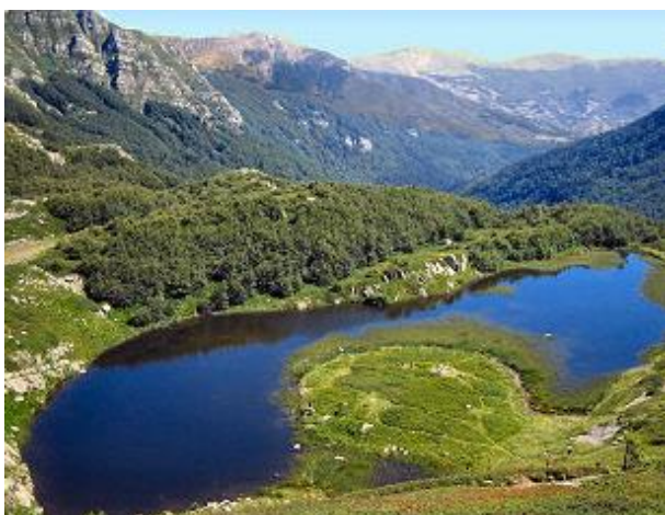
Fotografija 5. Jezero Piatto