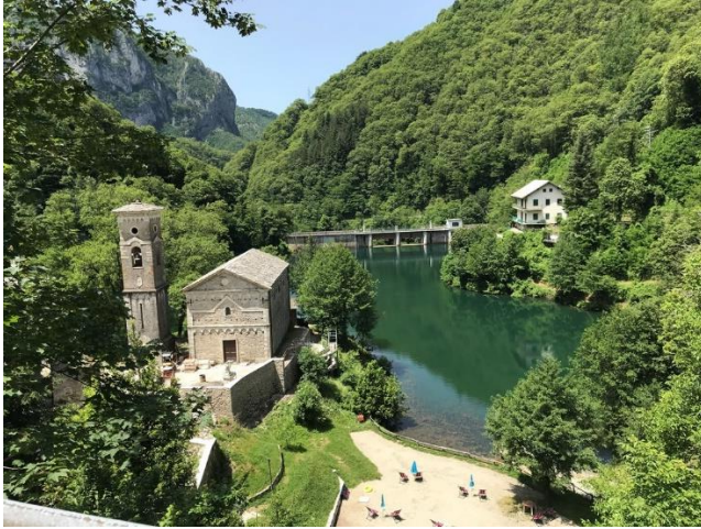
Fotografija 8. Jezero Isola Santa