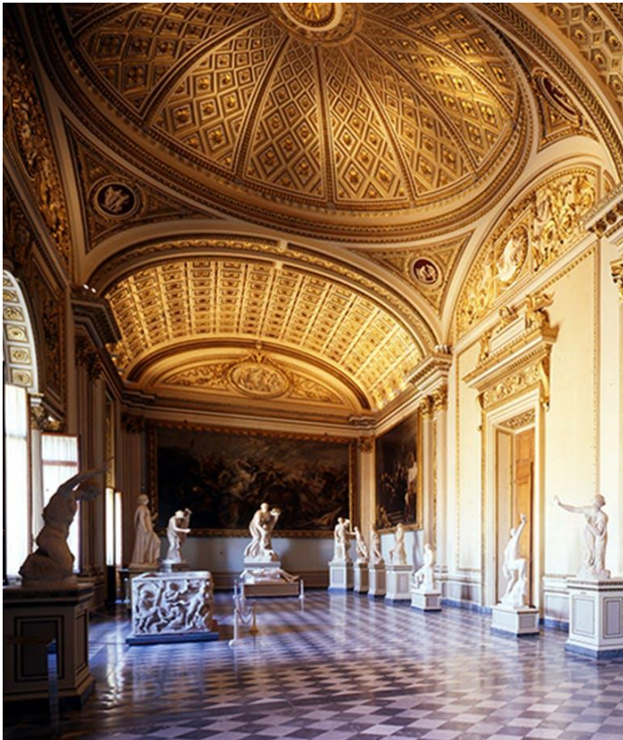
Fotografija 18. Uffizi