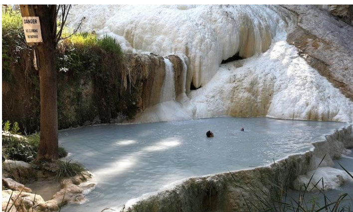
Fotografija 16. Bagni San Filippo