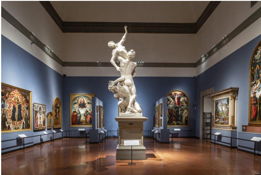
Fotografija 20. Galleria dell' accademia di Firenze