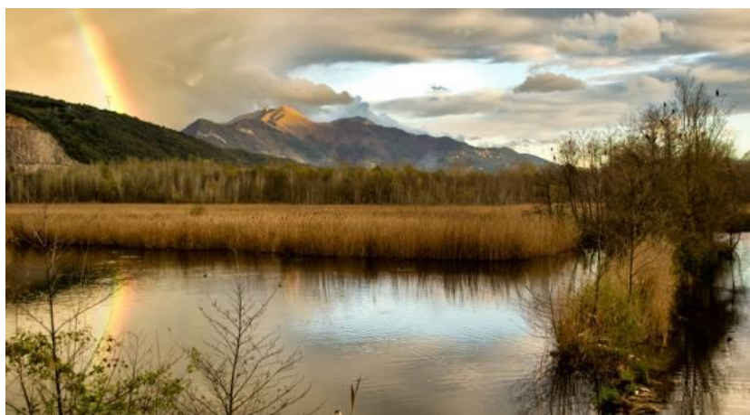
Fotografija 7. Jezero Porta