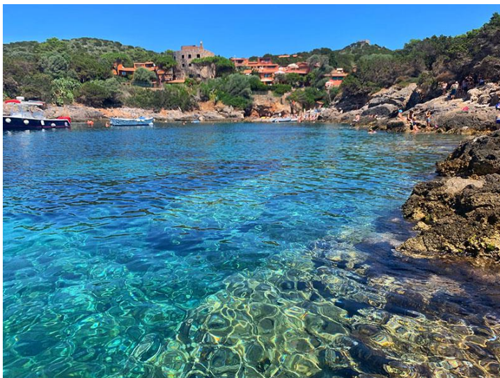
Fotografija 14. Otok Giannutri