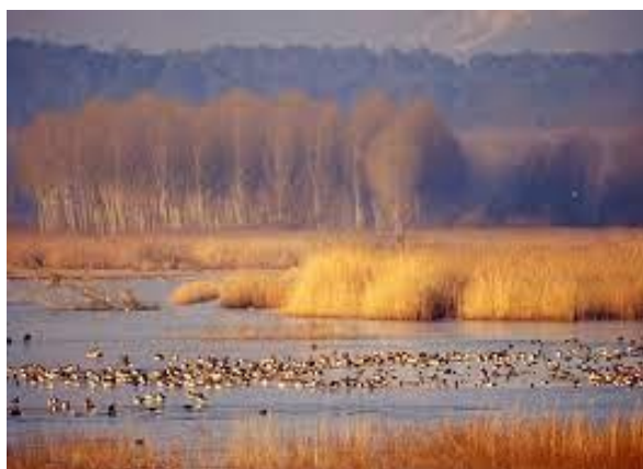
Fotografija 6. Jezero Bientina ili Sesto