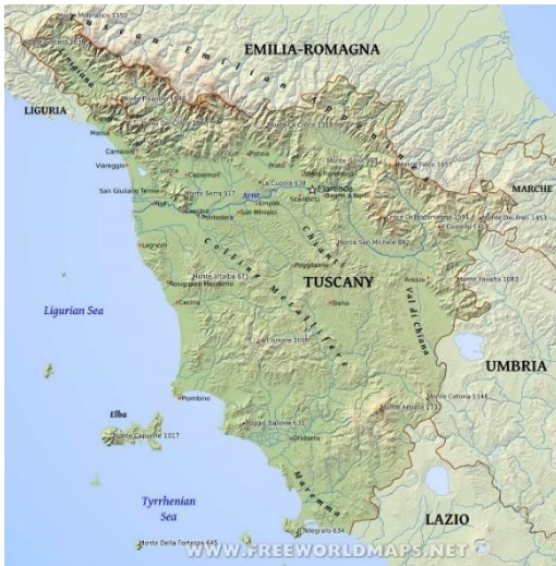
Fotografija 1. Geografski položaj Toskane