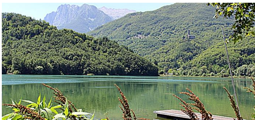
Fotografija 3. Jezero Gramolazzo