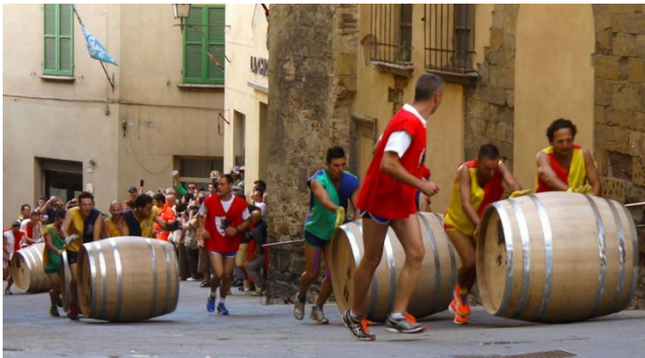
Fotografija 21. Festival Bravio delle Botti