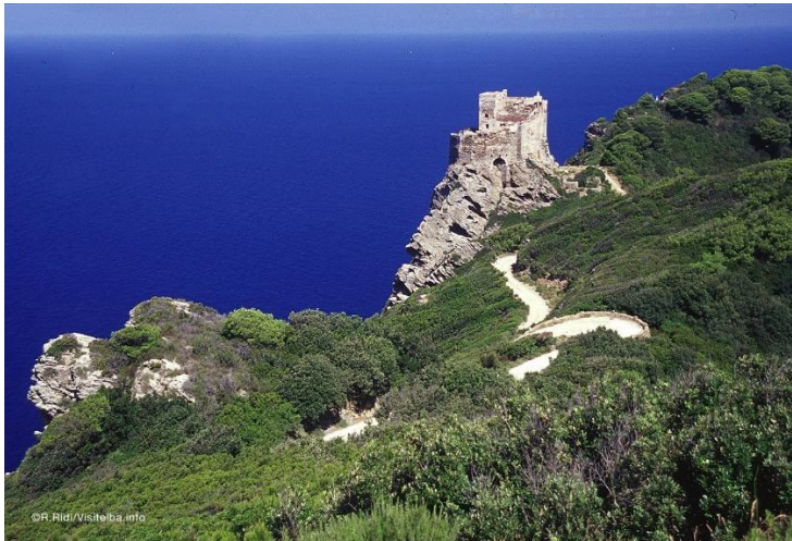
Fotografija 10. Otok Gorgona