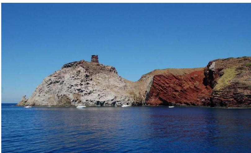
Fotografija 11. Otok Capraia

Otok Capraia (fotografija.11.) treći je najveći otok Toskanskog arhipelaga i otok južno od Elbe. Njegov prepoznatljivi eliptični oblik nalazi se duž linije prijeloma u mikroploči koja se spušta sa Sardinije. Oblik otoka nastao je zahvaljujući magmi koja je izbila iz pukotine na zemljinoj površini prije mnogo godina. Iako magma više ne pridonosi rastu otoka, drevni vulkan Zenobito ostaje kao dokaz zanimljivog geološkog rođenja Capraije. Taj golemi svjetlocrveni kameni zid tisućama godina nagrizan je elementima u Cala Rossi. Sada gleda na more u svojoj veličanstvenosti. 13