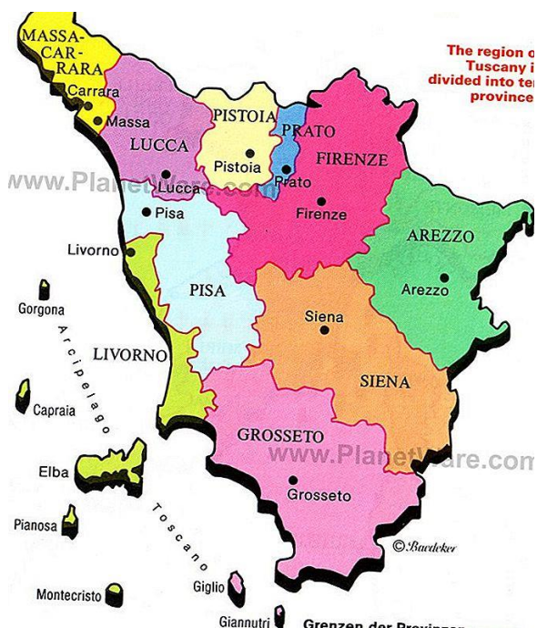
Fotografija. 1. Pokrajine Toskane