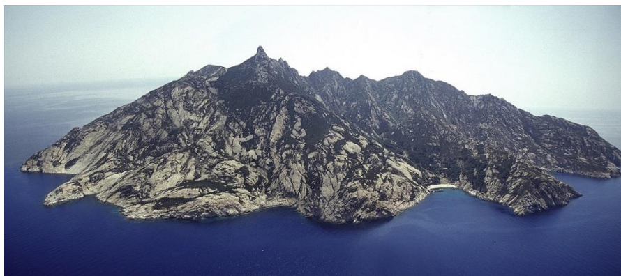
Fotografija 15. Otok Montecristo