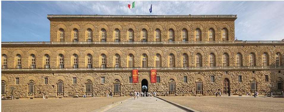
Fotografija 19. Palača Pitti