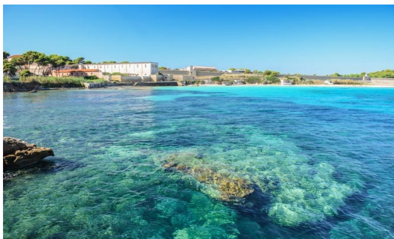
Fotografija 12. Otok Pianosa