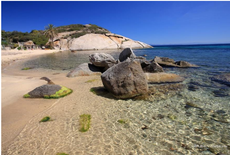
Fotografija 13. Otok Giglio