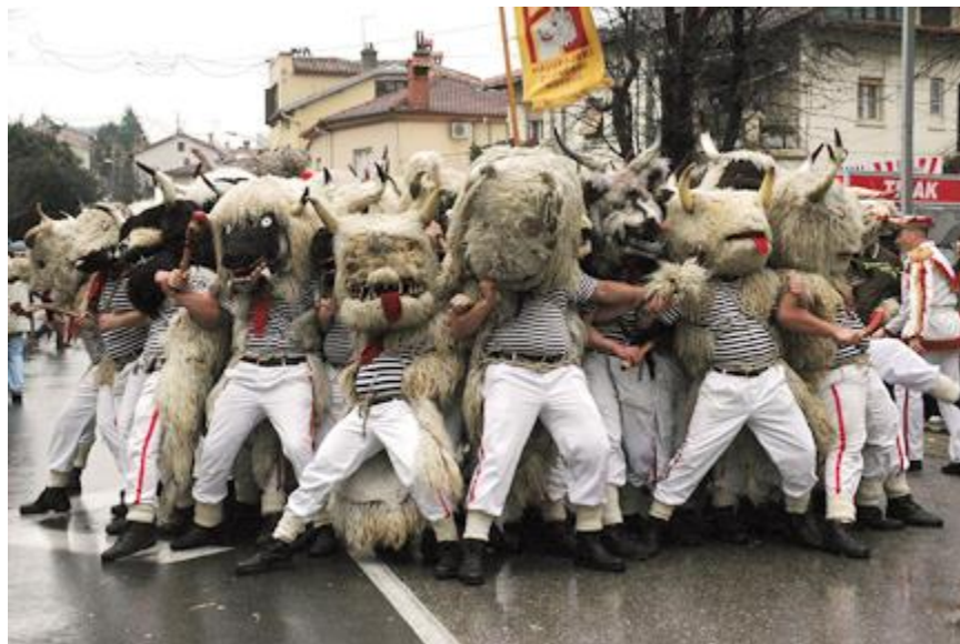
Slika 6: zvončari s Kastavštine