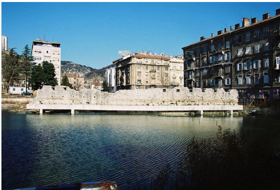
Slika 5: Stari gradski zid