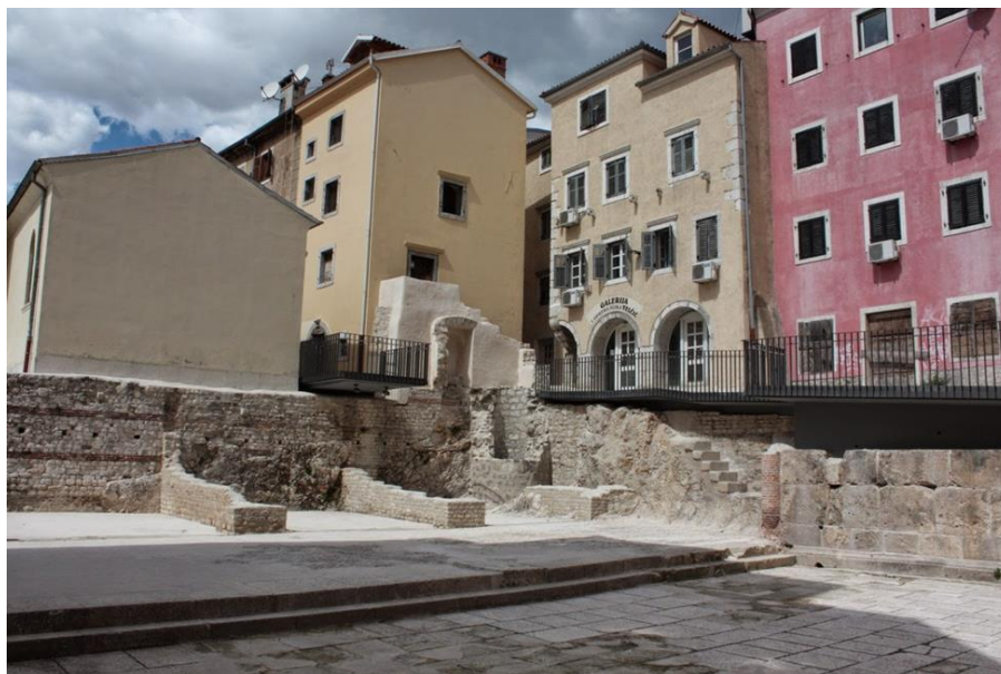
Slika 2: Ostaci tarsatičkog principija