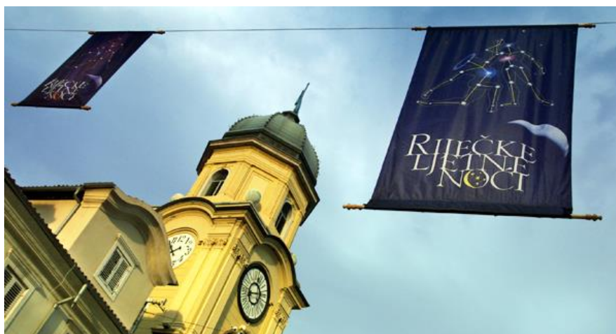
Slika 7: oglas o događaju Riječke ljetne noći