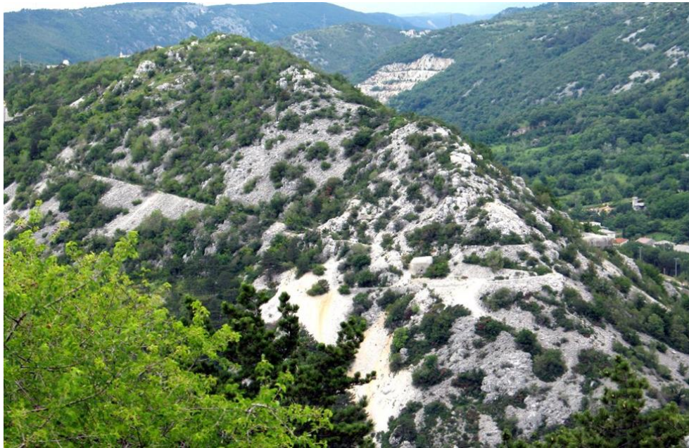
Slika 1: Brdo Sv. Križ