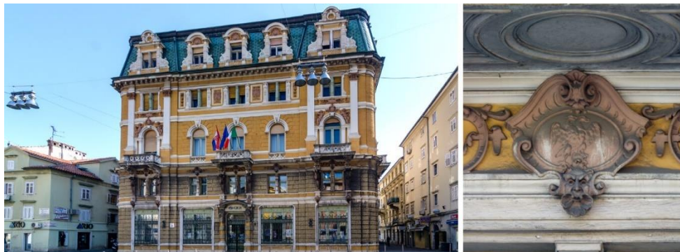
Slika 3: Palazzo Modello