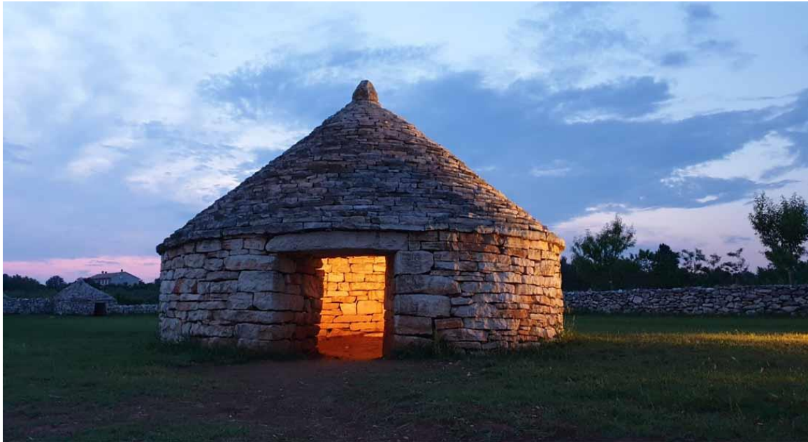
Slika 7. Tradicionalna istarska građevina - kažun