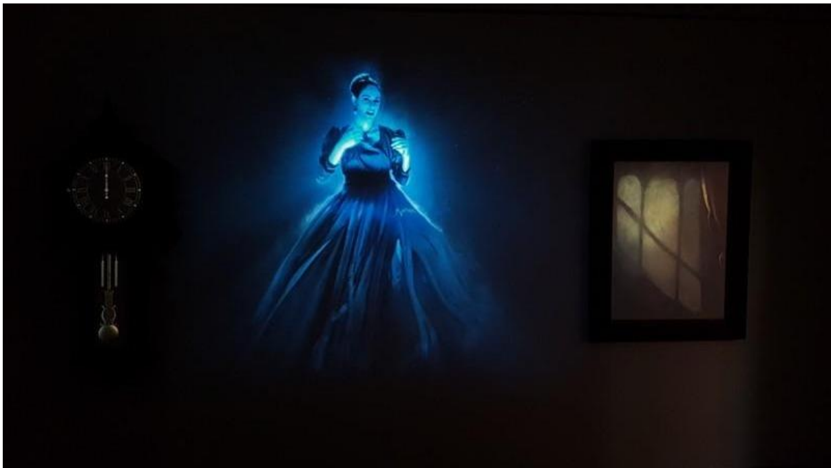
Slika 12. Iskustvo virtualne stvarnosti u Kući vještice Mare