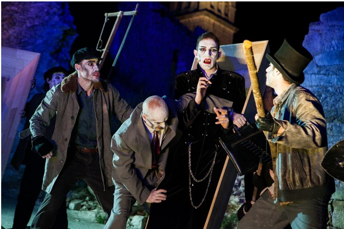
Slika 17. Predstava Jure Grando 2016.