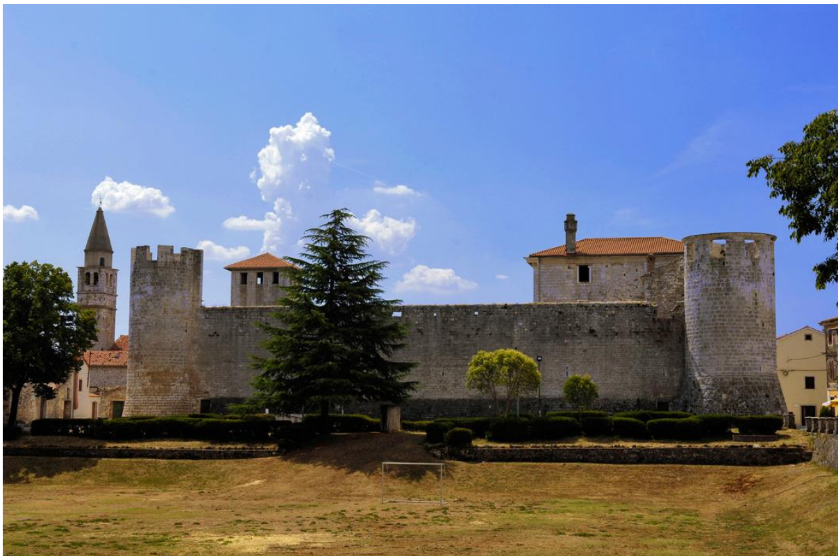
Slika 11. Kaštel Morosini Grimani u Savičenti