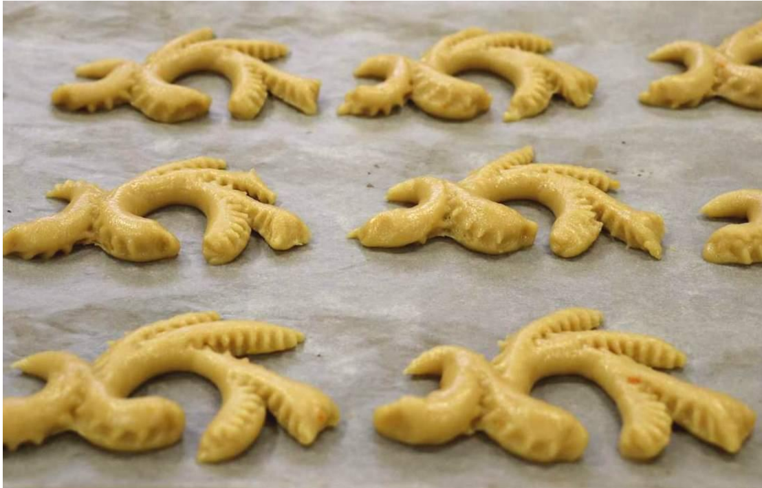
Slika 8. Izgled pazinskih cukerančića