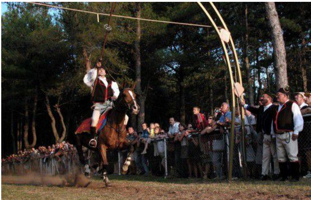
Slika 9. Barbanska Trka na prstenac