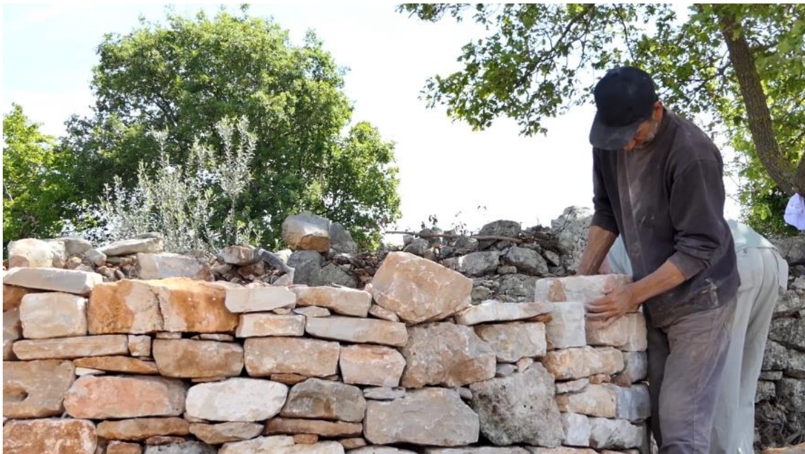
Slika 6. Umijeće gradnje suhozida