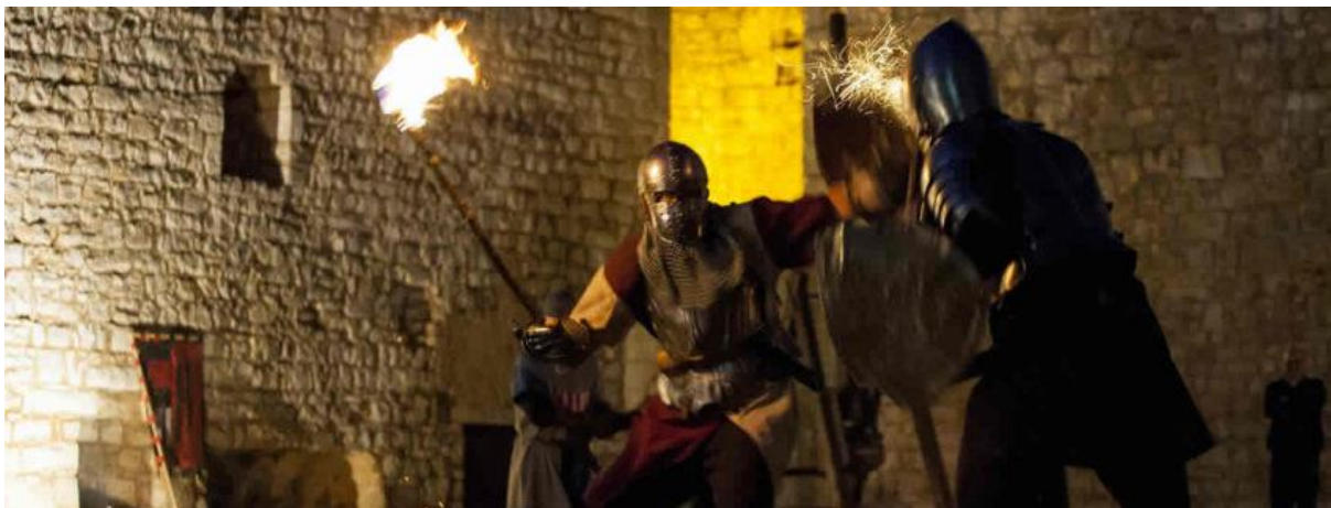
Slika 14. Viteške borbe na manifestaciji Srednjovjekovni festival