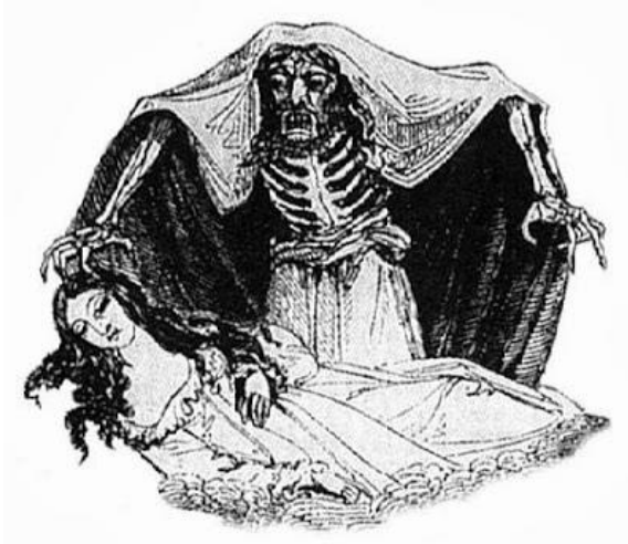
Slika 1. Ilustracija more