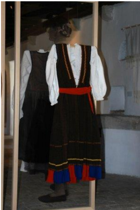
Slika 3. Tradicijsko odijevanje narodne nošnje za žene