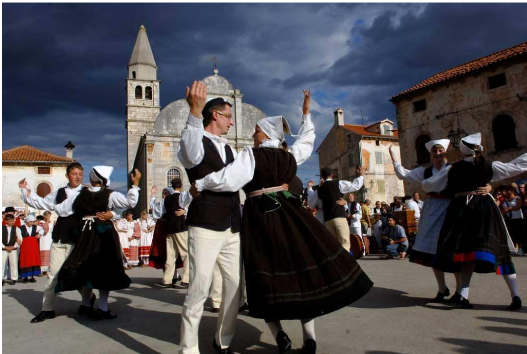
Slika 2. Izvedba baluna na Danima otvorenih vrata agroturizma Istre