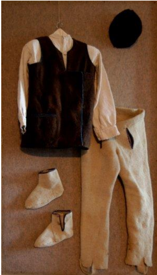
Slika 4. Tradicijsko odijevanje narodne nošnje za muškarce