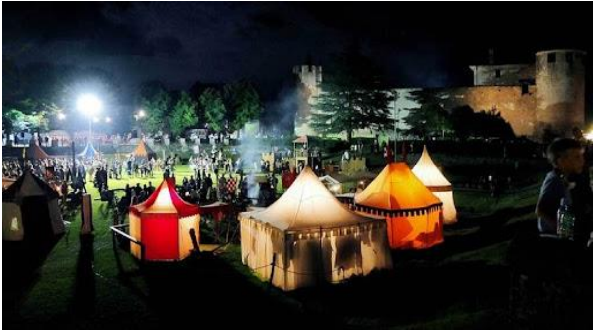
Slika 13. Večernji program manifestacije Srednjovjekovni festival u Savičenti