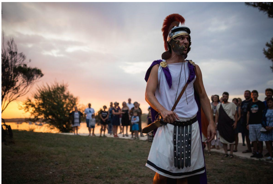
Slika 16. Izvedba predstave Crispo na poluotoku Vižula