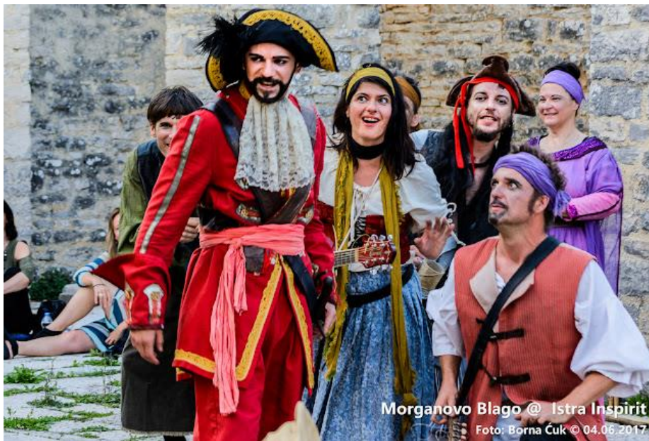
Slika 15. Izvedba predstave Morganovo blago u Dvigradu