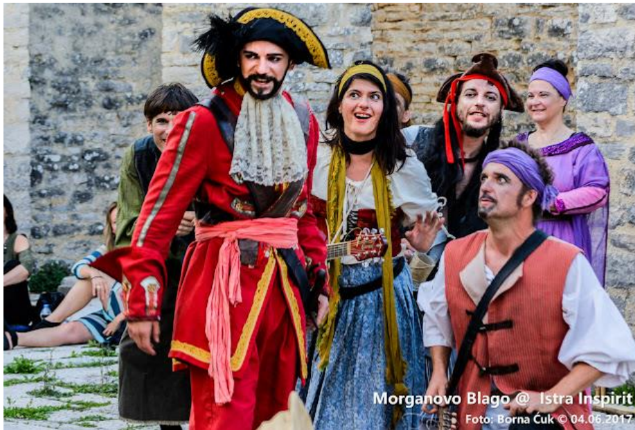
Slika 15. Izvedba predstave Morganovo blago u Dvigradu

Izvor: https://www.press-photo.eu/2017/06/predstava-morganovo-bлаго-istra.html , pristup 7. listopada 2022.