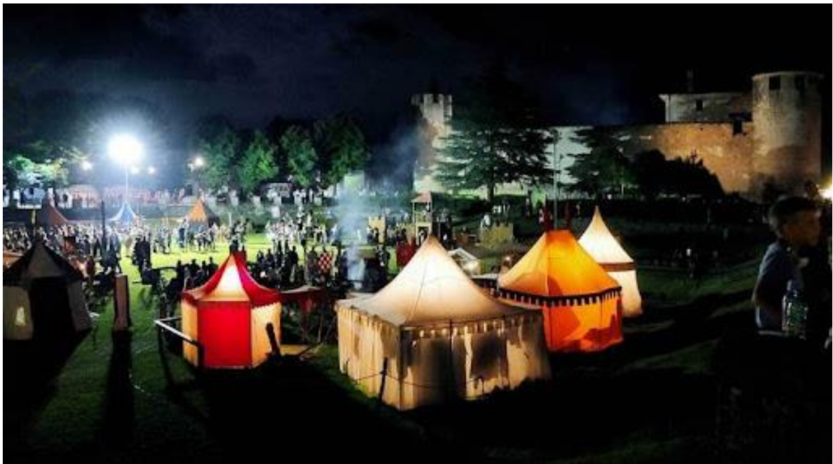
Slika 13. Večernji program manifestacije Srednjovjekovni festival u Savičenti