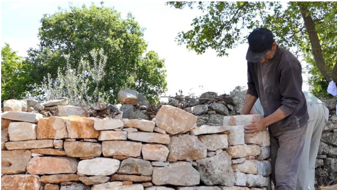
Slika 6. Umijeće gradnje suhozida