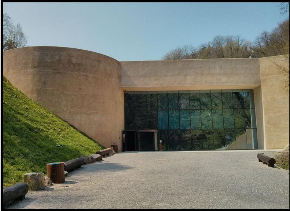
Slika 4. Muzej krapinskih neandertalaca „Kraneamus“

prošloga stoljeća u zgradi nekadašnjeg Kneippovog lječilišta osnovan je Muzej evolucije čiji je stalni postav osmislio M. Malez. Onodobni muzej, prema mišljenju Jakova Radovčića i Željka Kovačića, nikad nije pružao dovoljan uvid u širi kontekst i pravo značenje toga svjetskog lokaliteta. 49