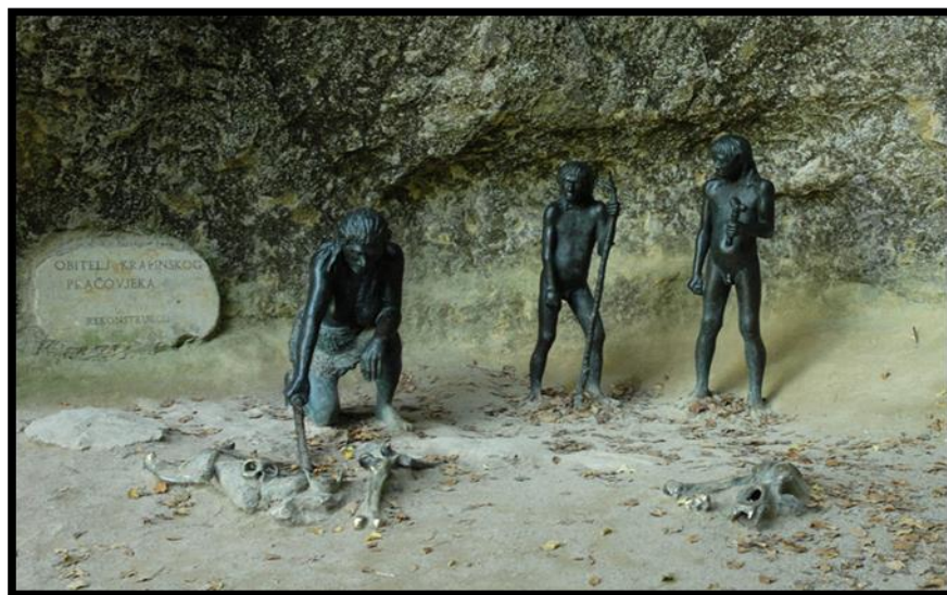
Slika 2. Rekonstrukcija obitelji krapinskog pračovjeka

šupljinom. Prsa su im bila bačvasta, a donja čeljust nije imala izbočenu bradu. Bili su izdržljivi i otporni lovci snažne građe. Neki znanstvenici smatraju da su bili dvostruko snažniji od današnjih ljudi. Njihova prosječna visina iznosila je oko 167 cm, a težina oko 80,8 kg. Prsti na rukama bili su im kraći i deblji nego u modernih ljudi. Prosječan obujam mozga iznosio je oko 1 520 kubičnih centimetara, što je približno 120 kubičnih centimetara više nego od nas. 30 Kratko stupasto tijelo, napose kratke podlaktice i potkoljenice rezultat su prilagodbe hladnim vremenskim uvjetima. Brojne analize potvrđuju da su bili pretežno dešnjaci, a oštećenja na njihovim zubima (posebice prednjim) dokazuju da su ih često rabili kao treću ruku. Na temelju analize zubi ustanovljeno je da su pronađene individue prosječno umrle u trinaestoj godini života. Također je poznato da je najmlađa jedinka imala tri godine, a najstarija dvadeset i sedam što dokazuje da su prevladavale uglavnom mlađe jedinke. 31 Dokazano je da su manje jedinke bile podložnije nedostatku hrane, traumama i bolestima, dok su stariji članovi mogli preživjeti razne traume. O tome svjedoči neurološki nalaz iz Krapine koji pokazuje da je čovjek sedam do deset dana bio u komi, nakon čega se oporavio. To pokazuje da su njegovi suvremenici vodili brigu o njemu kako bi preživio. S obzirom na to da su neandertalce mučile brojne životne teškoće, katkad su doživjeli kasne tridesete ili rane četrdesete godine. 32