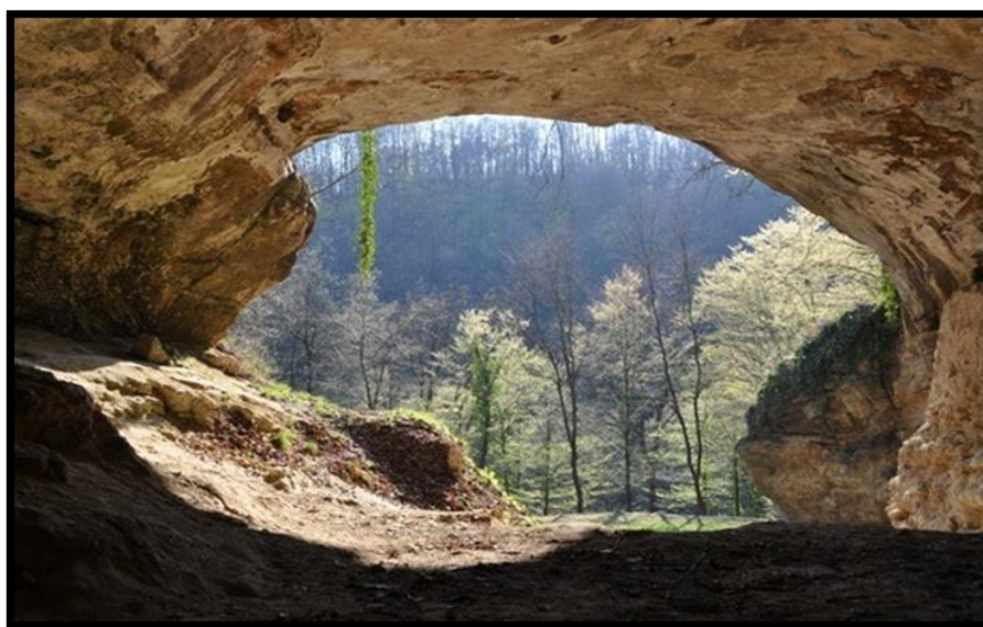
Slika 5. Pogled iz špilje Vindije

Ova špilja kao treće paleolitičko nalazište u Hrvatskoj (nakon Krapine u Hrvatskom Zagorju i špilje Bukovac u Gorskom Kotaru) otkrivena je 1928. Stjepan Vuković obavljao je iskopavanja špilje i pretšpiljskoga terena s prekidima više od tri desetljeća. Sustavna istraživanja ovog prostora započeta su 1974. pod vodstvom Mirka Maleza i trajala su sve do 1986. U tom su periodu prikupljeni mnogobrojni fosilni ostaci, faunistički i litički materijal. Stratigrafski profil ove špilje visok je 9 m i sadržava naslage koje su se taložile poprilično dugi niz godina (preko 150 000 godina). 52