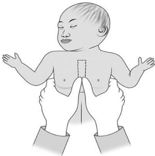
Slika 3. Vanjska masaža srca: Tehnika s dva palca