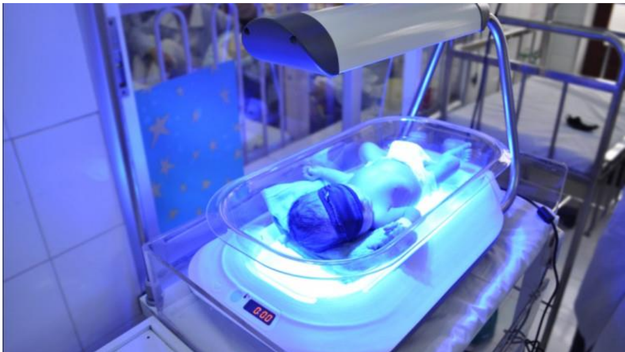
Slika 6. Fotolampa