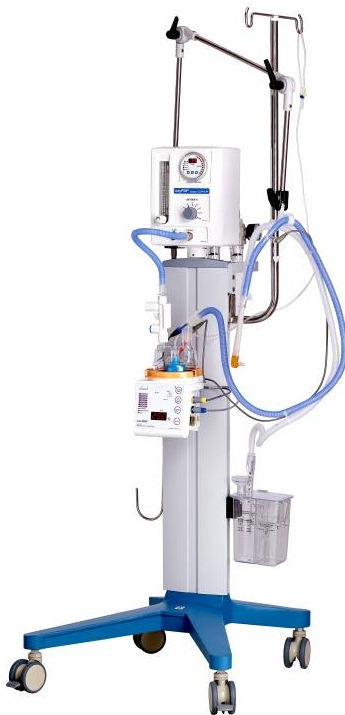
Slika 7. C-PAP za novorođenčad