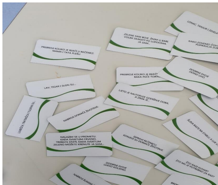
Slika 6. Logopedaska igra kroz kartice, autor: Martina Labaš Batković, mag.logoped., Ruža Petric, mag.logoped., izdano 2020, Zagreb, u sklopu društvene igre s govornim oblačićem u školu)