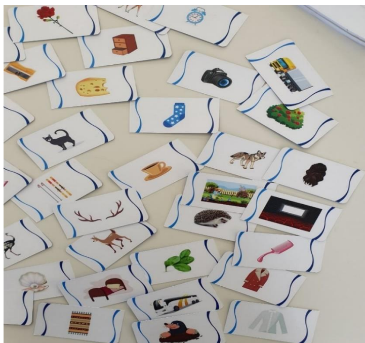
Slika 4. Logopedaska igra kroz kartice, autor: Martina Labaš Batković, mag.logoped., Ruža Petric, mag.logoped., izdano 2020, Zagreb, u sklopu društvene igre s govornim oblačićem u školu)