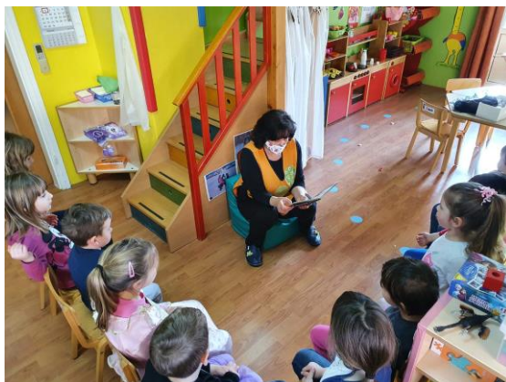
Slika 1. Čitanje bajke djeci. Izvor: vlastita foto-arhiva, 2021.