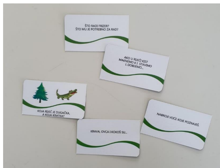
Slika 5. Logopedaska igra kroz kartice, autor: Martina Labaš Batković, mag.logoped., Ruža Petric, mag.logoped., izdano 2020, Zagreb, u sklopu društvene igre s govornim oblačićem u školu)