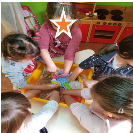
Slika 3. Obiteljski centar aktivnosti „,pranje posuđa“ u vrtiću „Buje“ u Bujama, Izvor: vlastita foto-arhiva, 2021.