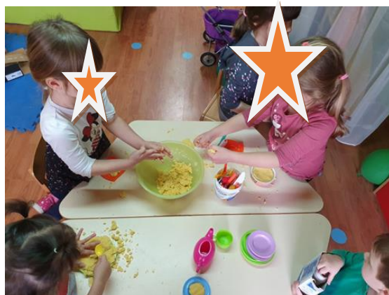
Slika 2. Obiteljski centar aktivnosti „kuhanje“ u vrtiću „Buje“ u Bujama, Izvor: vlastita foto-arhiva, 2021.