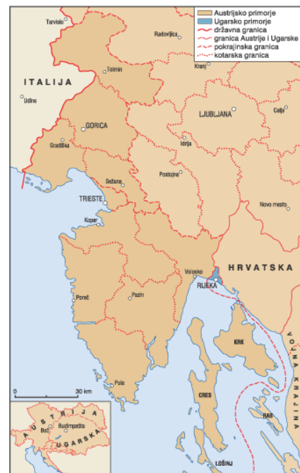
Slika 2 Austrijsko primorje

Nakon što je donesena Listopadska diploma, a nakon nekoliko mjeseci i Veljački patent, u Monarhiji dolazi do reorganizacije uprave i nove teritorijalne podjele države. Tim aktima ukinuto je Istarsko okružje sa sjedištem u Pazinu koje je djelovalo od 1825. do 1860. godine 10 te je sada teritorijalno Istra, zajedno s otocima Krkom, Cresom i Lošinjom činila Markgrofoviju Istre, jednu od 21 autonomne pokrajine u Monarhiji. Markgrofovija Istra, zajedno s pokneženim Grofovijama Goricom i Gradiškom te gradom Trstom činila je Austrijsko primorje koje je svoje Namjesništvo imalo u Trstu (koje nije izravno utjecalo na rad pokrajinskih sabora u Poreču, Gorici i Trstu), čije su granice ostale nepromijenjene i nakon krizne 1867. godine kada se provodi Austro-ugarska nagodba te Markgrofovija Istra postaje dijelom cislajtanijskog austrijskog dijela Monarhije. 11