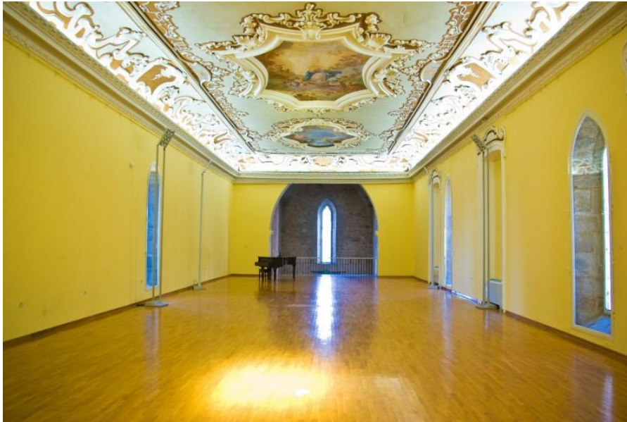
Slika 6 Istarska sabornica

Carevinskom vijeću. Gian Paolo Polesini bio je prvi predsjednik Istarskog poljoprivrednog društva, koje je osnovano 1869. godine na njegovu inicijativu te je u više navrata bio načelnik i općinski namjesnik. 74 Dok je još uvijek bio zastupnik u Saboru, Polesini 1882. umire te tako završava njegovo djelovanje na društvenom, političkom i gospodarskom planu koje je obilježilo ne samo Poreč već i Istru kroz 19. stoljeće. Obitelj Polesini ustupila je zgradu u kojoj je zasjedao Istarski sabor, a koja je nekada bila crkva i samostan svetog Franje s početka 14. stoljeća.