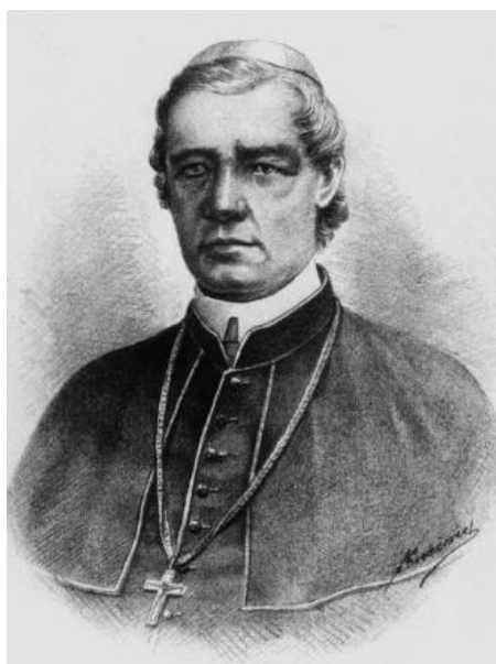
Slika 3 Juraj Dobrila

Juraj Dobrila, biskup i hrvatski narodni preporoditelj, rođio se 16. travnja 1812.