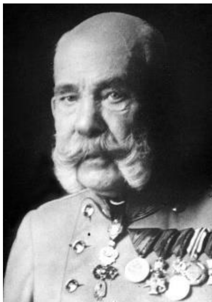
Slika 1 Franjo Josip I.