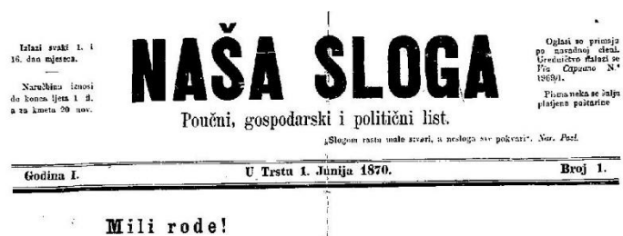
Mili rođe! Slika 4 Naša sloga

Naša sloga , u razdoblju od 1870. do 1899. godine novine su se tiskale u Trstu nakon čega se tiskanje seli u Pulu od 1899. do 1915. godine. Juraj Dobrila je najzaslužniji za njezino pokretanje, prvi urednik je bio Antun Karabaić,