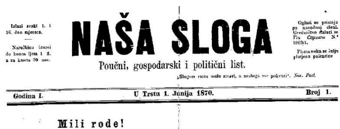
Slika 4 Naša sloga