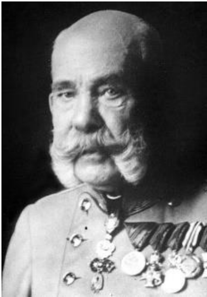
Slika 1 Franjo Josip I.