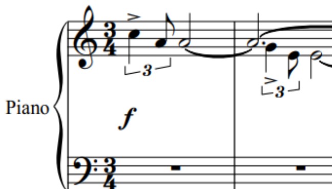
Primjer 44. Klavirski izvod – 1. i 2. takt

U 3. i 4. taktu postavio sam pedal iz razloga jer ima ležećih tonova i tonova koji se rastavljaju, a dio su vertikalnog akorda kako bi se već na početku dobio taj osjećaj jeke i naricanja ( Primjer 45 ).