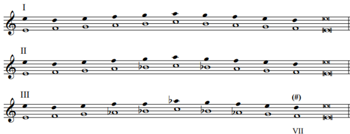
Slika 6. Tri varijante istarskog dvoglasja

Dalje je konstatirao da taj niz podliježe promjenama koje ga odvede bliže dijatonici i udaljuju od izvornog arhaičnog niza. To odstupanje pojavljuje se u tri varijante što ih je zabilježio na slijedeći način: