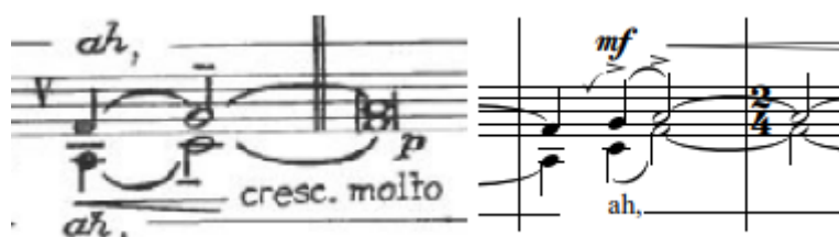
Primjer 56. Ćaće moj - takt 33.

Takt 36. donosi razliku u solo dionici. Prva doba je zapisana kao duola dok je u verziji za dječji zbor zapisana kao triola. Izvedbeno je duola nešto dramatičnija zbog šesnaestinke. Sljedeća doba je zapisana kao kvartola, u verziji za dječji zbor zapisane su četiri osminke nakon kojih slijedi triola koja je ograđena s isprekidanim crtama, kao i duola. U verziji za mješoviti zbor nema isprekidanih crta i nije zapisana duola, već samo dvije osminke ( Primjer 57 ).