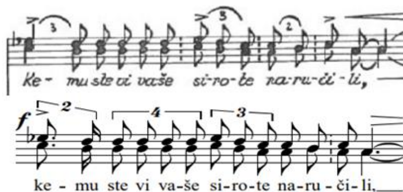
Primjer 57. Ćaće moj - takt 36.

Takt 39. donosi razliku u triolama. U dječjoj verziji su tonovi a-g-g , a u verziji za mješoviti zbor su tonovi a-a-g ( Primjer 58 ).