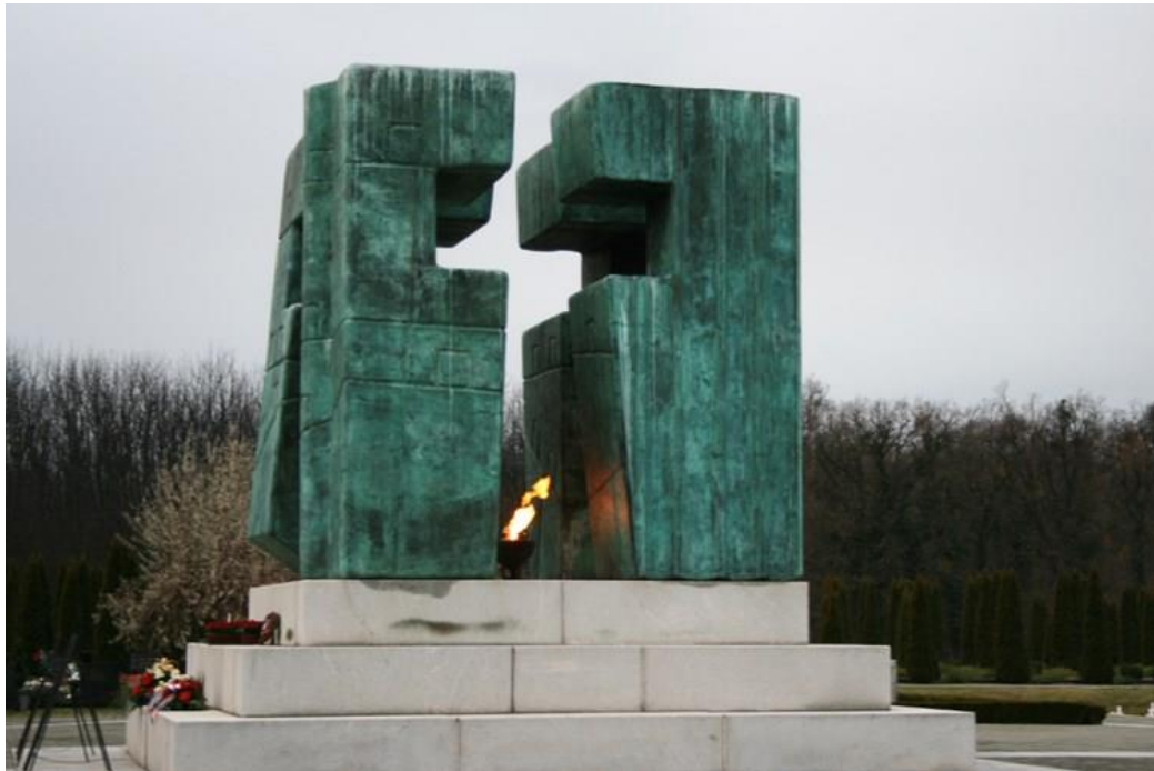
Slika 9. Spomen-obilježje s vječnim plamenom

Uokolo mjesta masovne grobnice prostire se Memorijalno groblje podijeljeno u aleje u kojima su vječni mir našli poginuli branitelji, civilne žrtve, umrli hrvatski ratni vojni invalidi i članovi njihovih obitelji. U središnjem dijelu groblja 5. kolovoza 2000. godine postavljen je spomenik autorice Đurđe Ostoje. Spomenik je izrađen od patinirane bronce, visok je četiri metra, a u središtu je zračni križ i vječni plamen 73 (Slika 9.).