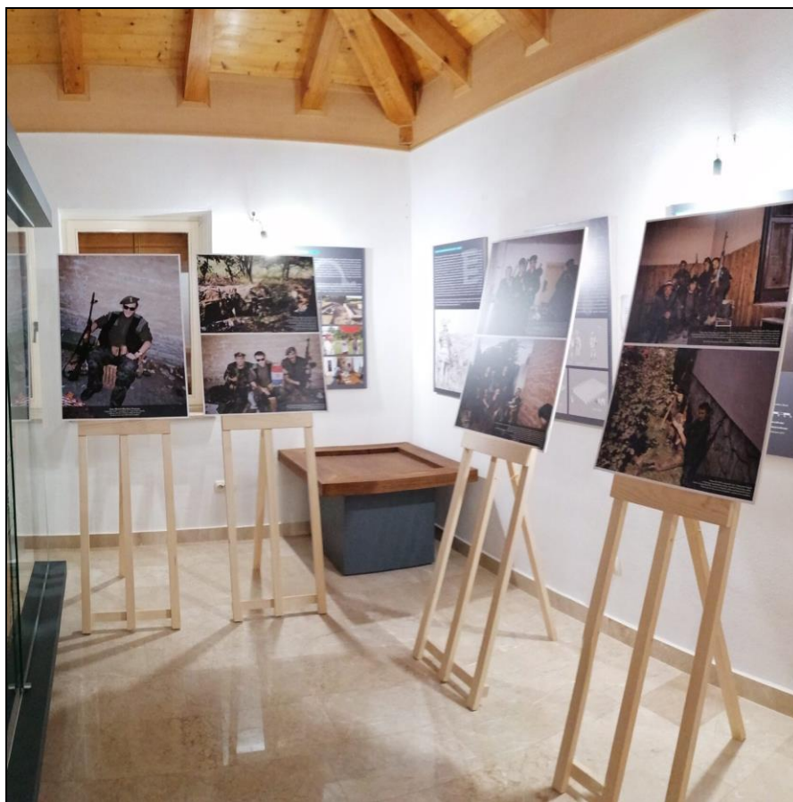
Slika 5. Izložba postavljena u Muzej Domovinskog rata u Splitu

branitelja s tog područja uključe u proces osnivanja budućeg muzeja. Zborno područje Split pokrivalo je teritorij od južnih padina Velebita do Dubrovnika. U borbama na području ZP-a Split sudjelovale su sve gardijske brigade, a i većina pričuvnih brigada. Uz to, na području ZP-a Split kontinuirano su se odvijala borbena djelovanja od 1991. do 1995. godine. Također odlučeno je da budući muzej nosi naziv Muzej Domovinskog rata u Splitu. Službeni početak rada na prikupljanju građe započeo je 26. studenog 2015. kada je cijeli projekt predstavljen široj javnosti. Nakon dobivanja suglasnosti Ministarstva kulture Republike Hrvatske te ispunjavanja svih uvjeta koji su propisani, Muzej je osnovan 20. listopada 2017. godine 67 (Slika 5.).