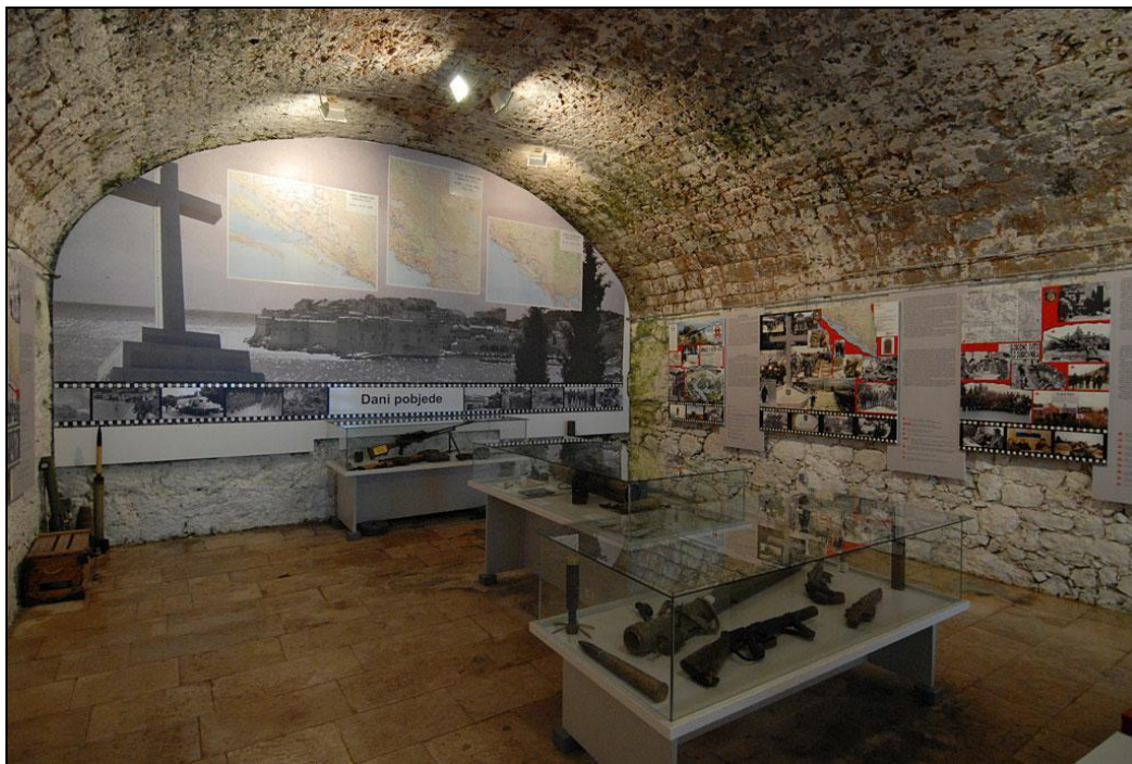
Slika 6. Muzej Domovinskog rata Dubrovnik

memoarske građe i zbirku fotografija i negativa koja je dostupna na službenoj web stranici Muzeja.