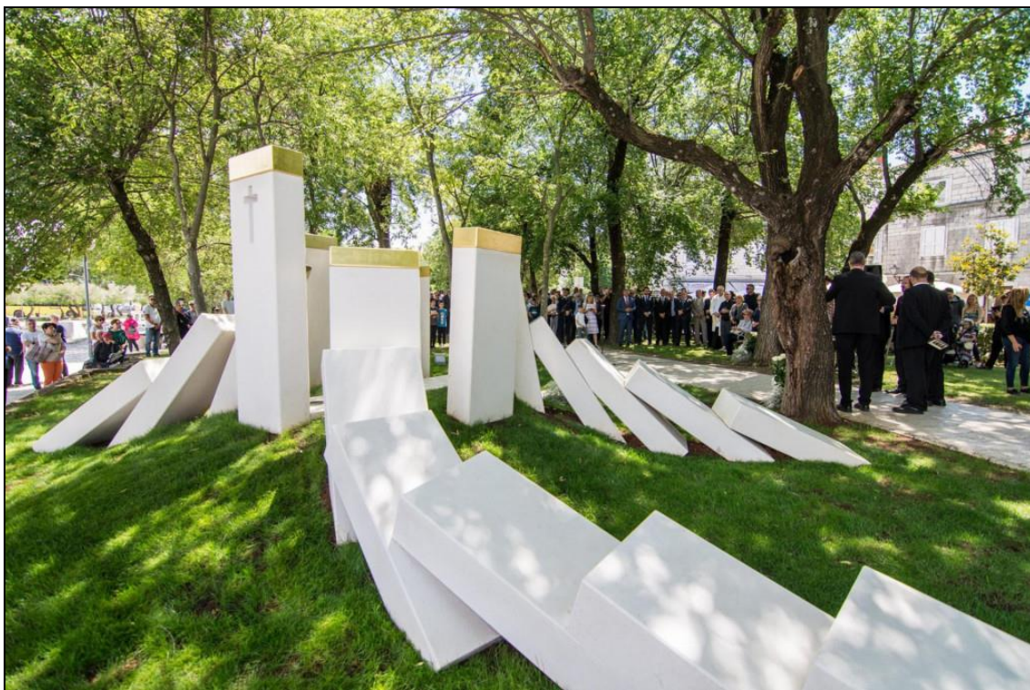
Slika 12. Spomen-obilježje Trogirski kruna