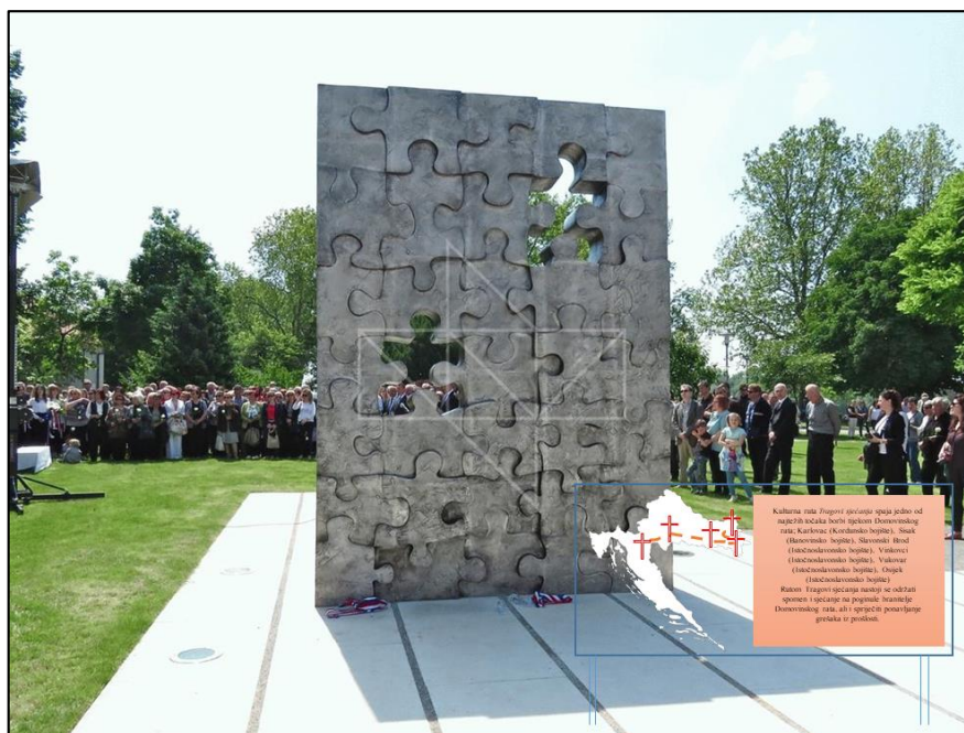
Slika 14. Primjer ploče postavljene uz spomenik poginuloj djeci Domovinskog rata u Slavonskome Brodu