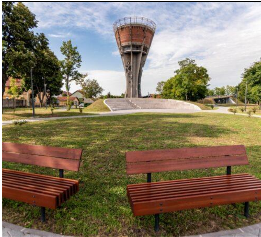
Slika 8. Vukovarski vodotoranj

povezuje i dodatno ojačava. Oduzimanjem elementa, krugova koji simboliziraju projekte iz jednog kvadrata te njihovim premještanjem u okvir novog, prikazuje se upravo ta ideja. 72