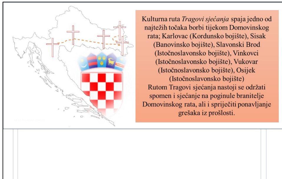
Slika 13. Primjer ploče postavljene uz spomen-obilježja kulturne rute Tragovima sjećanja

Na svim spomenutim točkama stajanja nalazila bi se ploča s glavnim informacijama o kulturnoj ruti (Slika 13.).