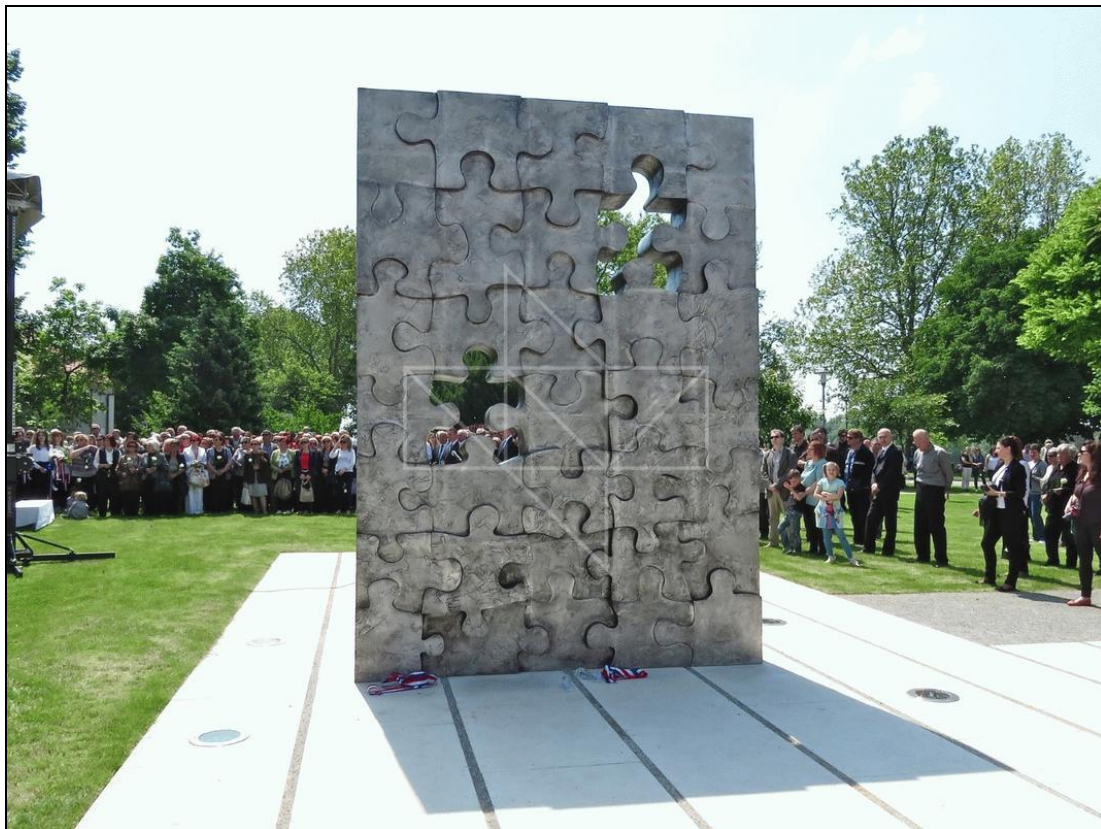
Slika 11. Spomenik poginuloj djeci Domovinskog rata