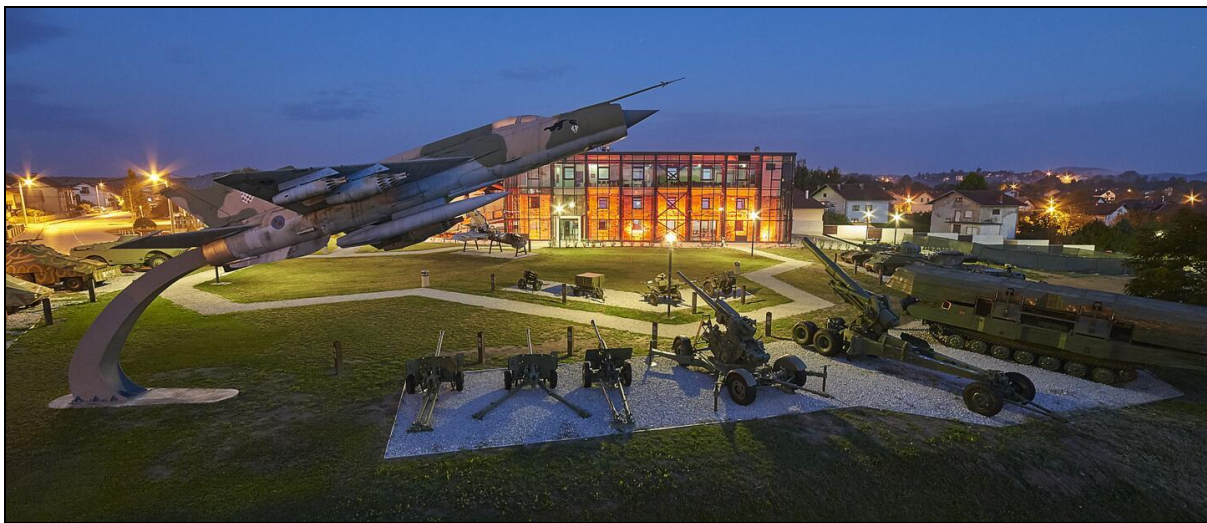
Slika 4. Muzej Domovinskog rata Karlovac – Turanj

1582. godine, koja je s vojnom posadom krajišnika/graničara čuvala južne prilaze karlovačkoj tvrđavi od osmanlijskih osvajača, Turanj je predstraža, posljednja crta obrane grada Karlovca. U Domovinskom ratu (1991 – 1995) Turanj je bio strateški važna točka u obrani grada, mjesto na kojem je zaustavljen pokušaj zauzimanja grada i presijecanja Hrvatske. O bogatoj vojnoj povijesti grada Karlovca svjedoče ostaci zgrada austrijske vojne arhitekture sačuvani na prostoru kompleksa. U obnovljenoj zgradi, koju su branitelji nazivali Hotel California , uređen je suvremeni muzejski prostor. Ideju o osnivanju muzeja na ovome mjestu inicirao je brigadir u miru Dubravko Halovanić koji je i prikupio prve predmete krupne vojne tehnike koji su na ovoj lokaciji postavljeni prije otvaranja muzeja. Arhitektonskim rješenjem zgrade Californije očuvana je njezina memorijska vrijednost - sačuvani oštećeni zidovi, obučeni u staklenu ovojnici, zadržali su autentičan izgled te tako preuzeli simboličnu vrijednost svjedočanstva ratnog razaranja, a unutarnji prostor oblikovan je za potrebe suvremenog muzeja 65 (Slika 4.).