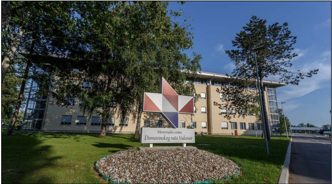
Slika 7. Memorijalni centar Domovinskog rata Vukovar

Skendra, spomenik 12 redarstvenika, spomen-obilježje masovne grobnice Nova ulica i Memorijalno groblje žrtava iz Domovinskog rata. Posebna pozornost pridaje se obilježavanju obljetnica, upravljanju i održavanju objekata, prikupljanju i čuvanju artefakata iz Domovinskog rata, pripremi i opremanju stalnog tematsko-kronološkog postava, uređenju i opremanju mjesta sjećanja te revitalizaciji već postavljenih vanjskih i unutarnjih eksponata. 70