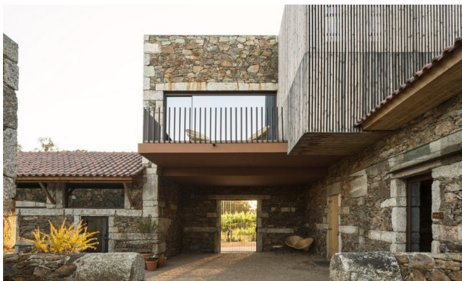
Slika 10. Eksterijer soba Vineyard Experience