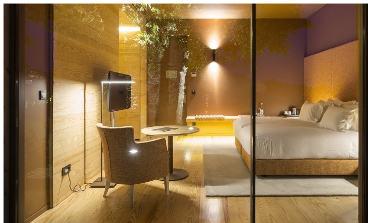
Slika 9. Interijer sobe Charming