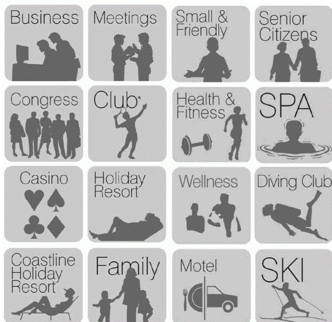
Slika 3. Grafička rješenja ploča posebnih standarda za ugostiteljske objekte iz skupine Hoteli