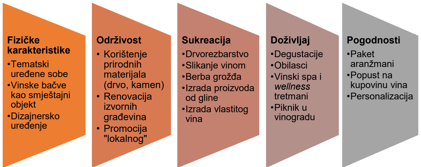
Tablica 5. Specifični proizvodi kao dio hotelske ponude u vinskim hotelima