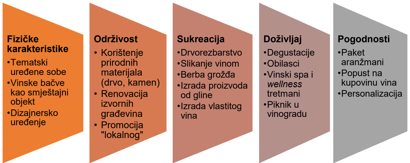
Tablica 5. Specifični proizvodi kao dio hotelske ponude u vinskim hotelima