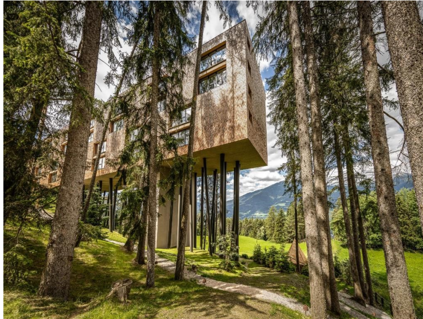
Slika 6. Hotel My Arbor – Plose Wellness Hotel