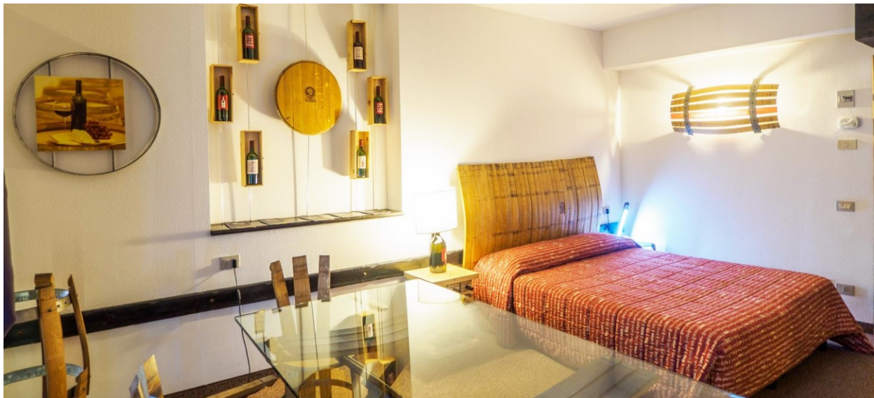
Slika 5. Uređenje sobe u hotelu Giò Wine e Jazz Area