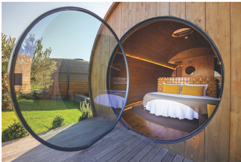
Slika 8. Wine Barrels – vinske bačve u sklopu The Wine House Hotela