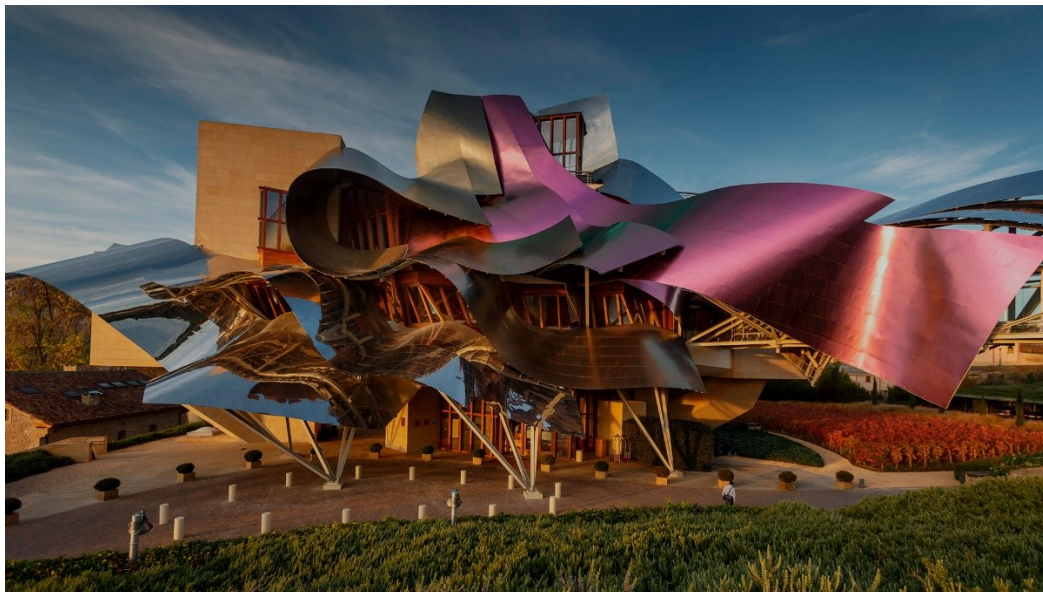
Slika 12. Eksterijer hotela Marques de Riscal