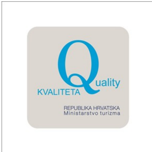
Slika 4. Ploča za oznaku kvalitete