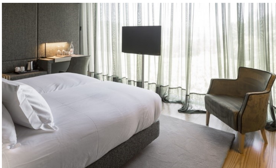
Slika 11. Interijer soba Vineyard Experience