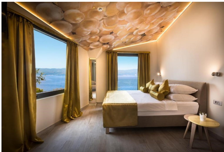
Slika 7. Soba u Vinotelu Gospoja