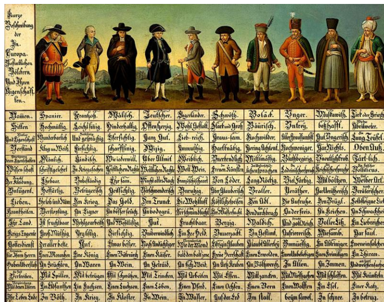
Slika 2. Völkertafel 49